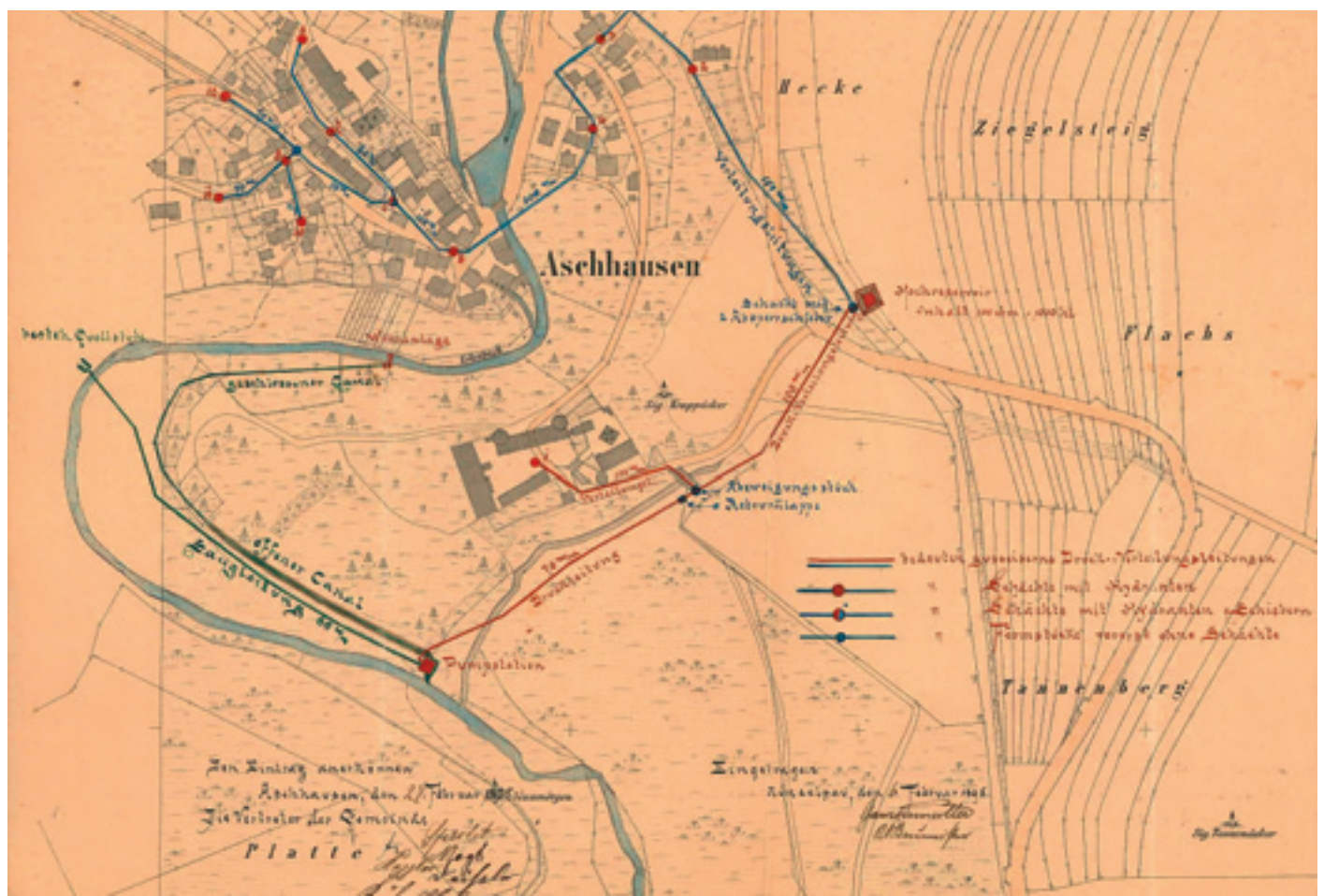
1 Flurkarte mit technischen Informationen.

rasche Umsetzung. Erst der extrem trockene Sommer 1893 führte erneut die Dringlichkeit einer Wasserversorgung vor Augen. Wiederum wurde Baurat Ehmann betraut. Sein nun zur Realisierung angenommenes Projekt baute auf seinen bisherigen Überlegungen auf, benötigte aber aufgrund einiger Verbesserungen einen erhöhten Finanzbedarf von 29.050 Mark. Für das Projekt erfolgten insgesamt vier Genehmigungen durch die Königliche Kreisregierung in Ellwangen: Erstgenehmigung vom 23. Juni 1894 mit Folgegenehmigungen 1895, 1899 (Erhöhung des Wehres) und 1924. Die