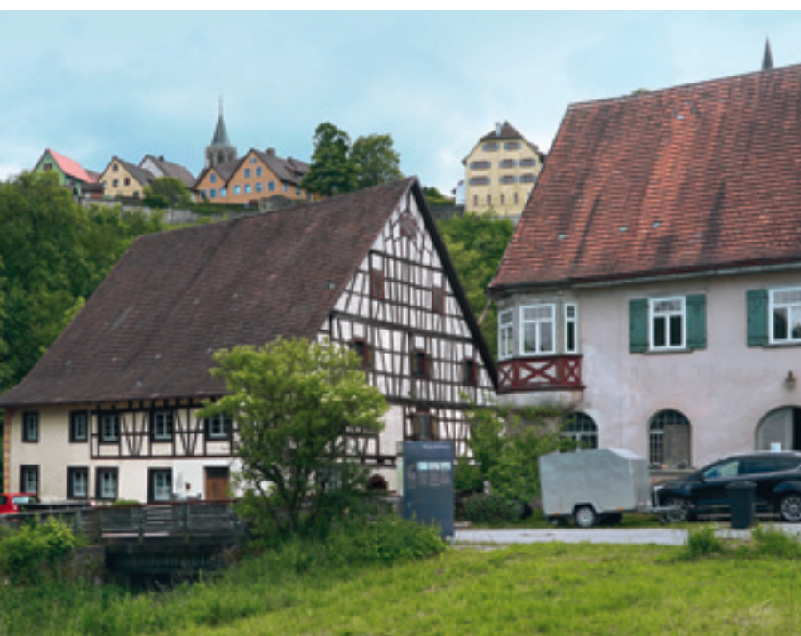
7 Neuerlich vor Dreher- und Kochlinsmühle aufgestellte Schautafeln.

sern und die Flüsse für die Wanderung von Fischen durchgängig zu machen. Wehranlagen sind unüberwindliche Hindernisse und müssen entweder mittels Fischtreppe umgangen oder abgebaut werden.