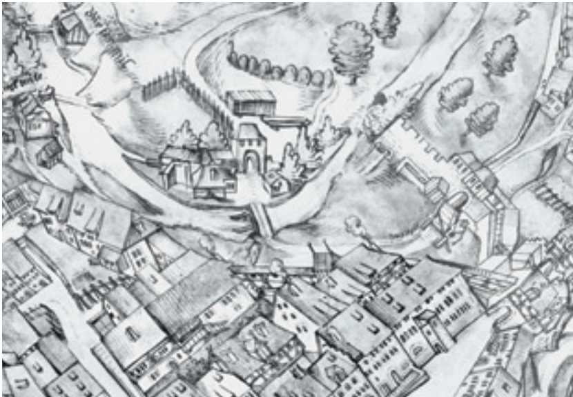
6 Ausschnitt aus der 1564 gezeichneten Püschgerichtskarte. Am Mühlenstandort ist das Zürner Tor in der Funktion als Brückenkopf zum Neckarübergang wiedergegeben.

giegewinnung weiter zurückreicht und ob der Kanal natürlichen Ursprungs sein könnte. Die als Furt genutzte Flussbiegung war flach und breit, sodass sich ein Nebenarm als Überlauf bei hohen Wasserständen gebildet haben könnte. Eine solche In-sellage hätte sich für eine vorgeschobene Befestigung zum Schutz der Brücke angeboten. Zugleich waren die Flachstelle für den Bau eines Wehrs und der Nebenarm zum Gebrauch als Mühlkanal geeignet. Dies würde sich als Erklärung für die ungewöhnliche Breite des Zulaufs und die besondere Situation mit zwei sich gegenüberliegenden Mühlen anbieten.