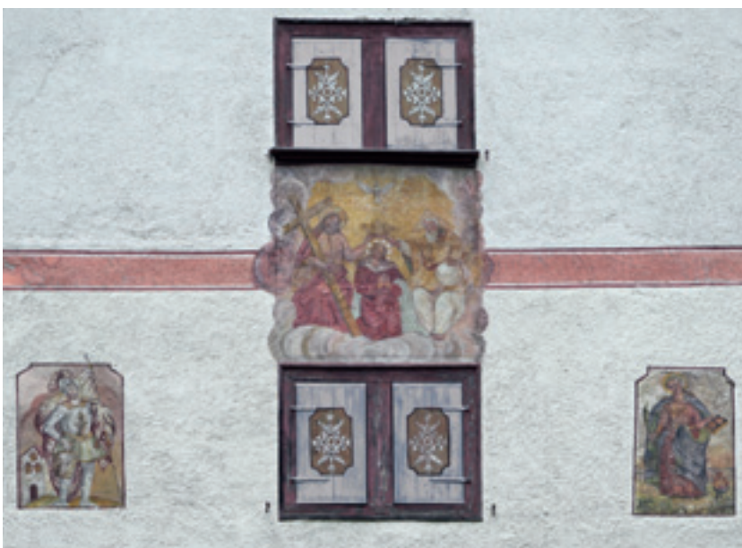
1 Die südliche Giebelseite der Drehersmühle mit einer Marienkrönung sowie dem hl. Florian und der hl. Agatha als Schutzheilige gegen Feuer.

Die ältesten urkundlichen Erwähnungen beider Mühlen fallen ins frühe 14. und 15. Jahrhundert. Im 17. Jahrhundert wurde die Kochlinsmühle durch die Familie Koch, später Köchlin, betrieben, wovon sich die heute gebräuchliche Bezeichnung herleitet. Der Name der Drehersmühle geht vermutlich auf Müller des 16. Jahrhunderts zurück. 1710 ereilte beide Mühlen das gleiche Schicksal, als sie in den Wirren des Spanischen Erbfolgekriegs niederbrannten. Sie wurden beide wiederaufgebaut, doch nur die Drehersmühle stammt noch aus dieser Zeit. Auf der Seite des Triebkanals zeigt die Giebelwand heute offenliegendes Fachwerk, den zum Neckar gerichteten Rückgiebel zieren drei kleine Wandbilder: Neben einer Marienkrönung den Heiligen Florian vor einem brennenden Haus und die Heilige Agatha mit dem Attribut einer Kohlschale, beide Schutzpatrone gegen Feuer, denn die Brandkatastrophe hatte offenbar großen Schrecken hinterlassen (Abb. 1). Die Kochlinsmühle wurde 1908 ein weiteres Mal ein Raub der Flammen. Das neue Gebäude bekam einen Erker mit Fachwerkdekor an der Ecke.