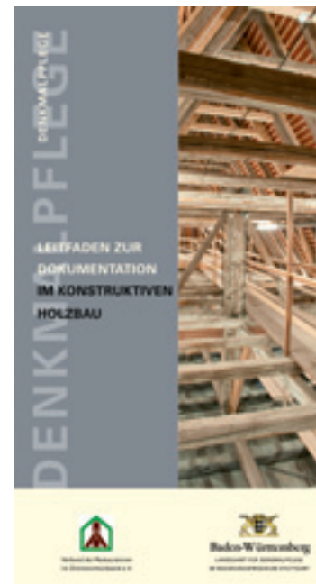
Die Broschüre „Leitfaden zur Dokumentation im konstruktiven Holzbau“.

Nur auf einer solchen Grundlage lässt sich eine fachlich fundierte Planung entwickeln. Diese garantiert, dass wertvolle Bausubstanz nicht aus Unkenntnis zerstört wird, und vermindert das Risiko unvorhersehbarer Kosten, damit gibt sie Planungssicherheit. Auf dieser Grundlage können detaillierte Leistungsbeschreibungen mit genauen Qualitätsanforderungen erstellt werden.