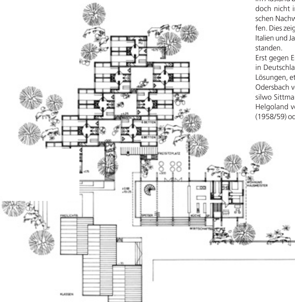
2 Wettbewerbsentwurf für das Schullandheim Mönchhof von 1964: Deutlich erkennt man strukturalistische Tendenzen.

Erst gegen Ende des Jahrzehnts entstanden auch in Deutschland architektonisch anspruchsvollere Lösungen, etwa das Haus der Jugend in Weilburg-Odersbach von Walter Schwagenscheidt und Tassilwo Sittmann (1959), das Haus der Jugend auf Helgoland von Ingeborg und Friedrich Spenglin (1958/59) oder die Jugendherberge in Oberstdorf/