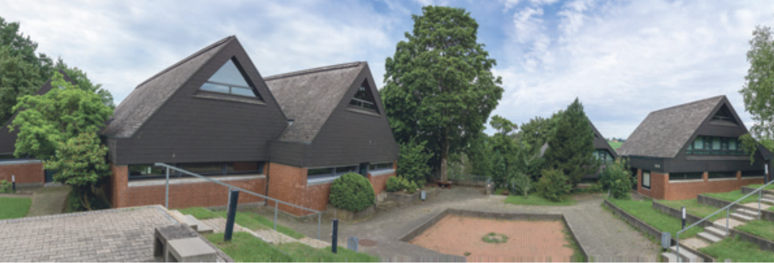
4 Fast wie ein Dorfanger mutet die Anlage an.

Das Innere wird bestimmt von der Holz­sichtigkeit der offenen Dachstühle und den Ziegelwänden. Die Kehlbalken sind aus einem Stück gefertigt, es wurden keine Leimbinder verwendet. Auch das funktionale Mobiliar, das ebenfalls vom Architekturbüro entworfen wurde, ist holzsichtig. Die Erschließung der Obergeschosse in den Bettenhäusern erfolgt über je zwei baugleiche Wendeltreppen, ebenfalls aus Holz (Abb. 8). Viele bauzeitliche Details haben sich erhalten, wie die schon erwähnten Möbel, einige Lampen im Innen- und Außenbereich, der Fliesenboden im Schulhaus sowie die Sitzelemente aus Betonfertigteilen im Hof. Der Hofbereich ist terrassenförmig angelegt. Die einzelnen von Betonplatten begrenzten Terrassenfelder sind begrünt und können als Sitzgelegenheit genutzt werden. Der Platz erinnert an antike Versammlungsstätten. Trotz der dominanten Holz- und Ziegelflächen im Inneren und der markanten Dachformen entsteht