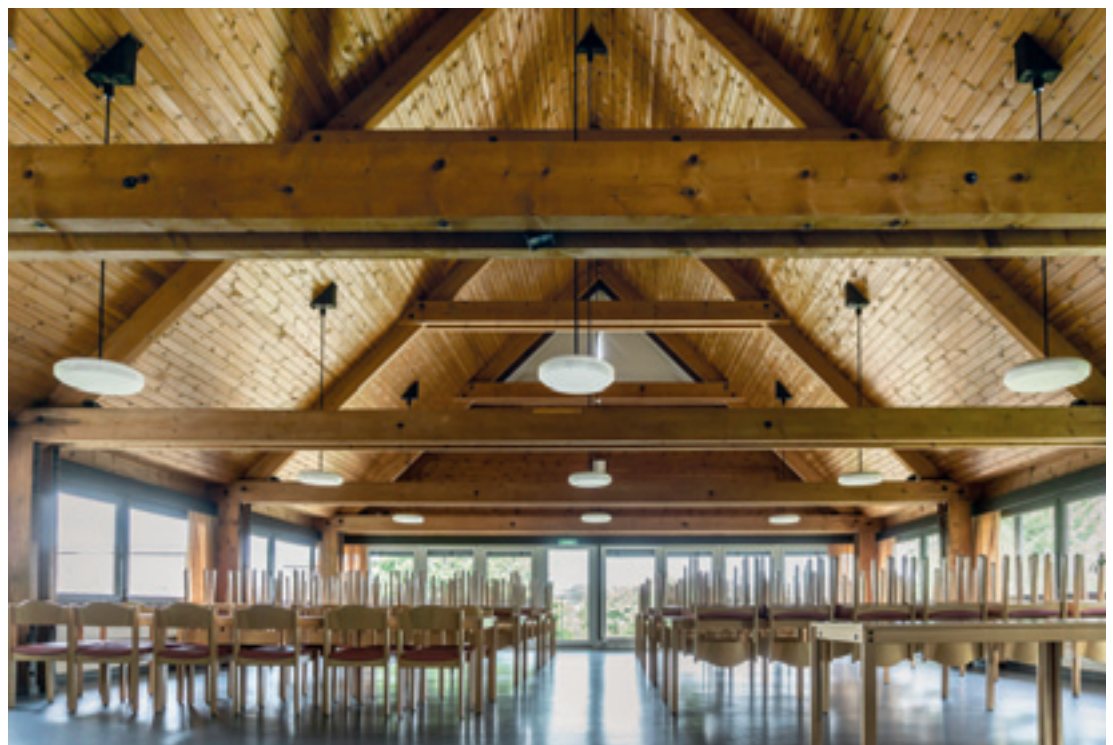
5 Der offene Dachstuhl im Speisesaal.

nicht der Eindruck einer betonten Heimeligkeit oder eines „sich Anbieterns“ an vergangene Bauformen. Dies wird durch die bewusste Reduktion auf das Wesentliche und die konsequent klare Formensprache der gesamten Anlage bis ins Detail vermieden. Mit dem Schullandheim Mönchhof widerlegen Kammerer und Belz die Befürchtung des oben erwähnten Oskar Splett, der davon ausging, dass es ein Widerspruch sei, „eine neue Bauaufgabe mit alten, von anderen Voraussetzungen her entwickelten äußeren Formen zu lösen“. So äußerten sich auch die Architekten in ihrem Werkbericht aus dem Jahr 1985 zu der Anlage: „Es freut uns noch heute, dass wir uns über die Klischees der damaligen Auffassungen hinweggesetzt und etwas entworfen haben, das in einer in unseren Augen wohlverstandenen Tradition steht“. Auf eine Reduktion bzw. bewusste Zurückhaltung legte auch der Landschaftsarchitekt Hans Luz bei der Gestaltung der Grünflächen wert. Hier zeigt sich die