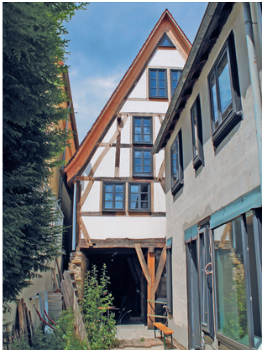
8 Der Hofgiebel nach Instandsetzung und Umbau. Zustand 2020.

Zu Beginn der Arbeiten zeigten sich enorme Schäden am Fachwerk der Traufseiten durch jahrzehntelang eindringendes Wasser. Die bis zu 50 cm verformten Decken erwiesen sich als Folgeerscheinungen.