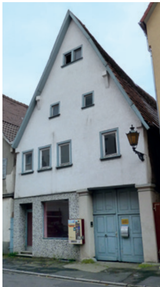
1 Das Ackerbürgerhaus Ochsengasse 13 in Bad Mergentheim und seine Bewohner im Jahr 1913.