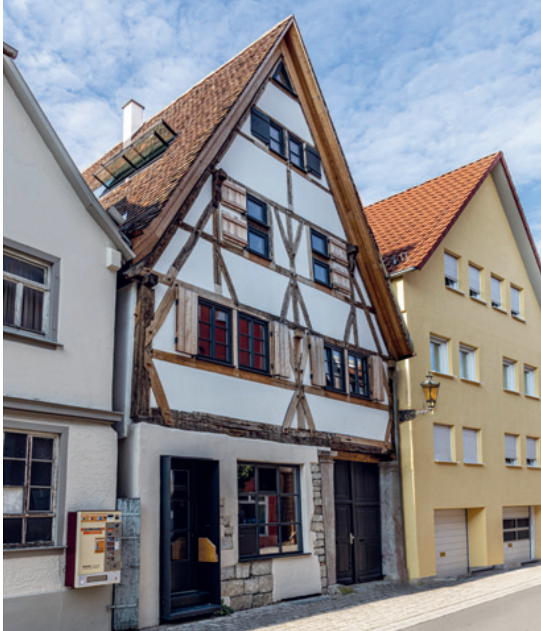
11 Das Haus Ochsen-gasse 13 nach der In-standsetzung. Zustand 2020 mit repariertem mittelalterlichen Sicht-fachwerk.

stimmung mit der Denkmalpflege. Die künstlich angelegten Fehlstellen im Fassadenputz des Erdgeschosses, die den Blick auf ein unspektakuläres Mauerwerk frei geben, werden hoffentlich bei der nächsten Renovierungsmaßnahme geschlossen.