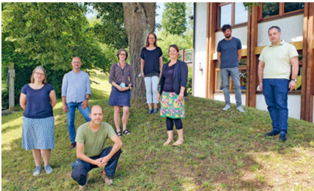
Abbildungsnachweis 1, 10 © R. Maucher; 2, 4-8, 11-14 RPS-LAD; 3 burkert ideenreich, Ulm; 9 © MLW; 15 © Verlagsbüro Wais & Partner; Jubiläumslogo: HUND B communication, München