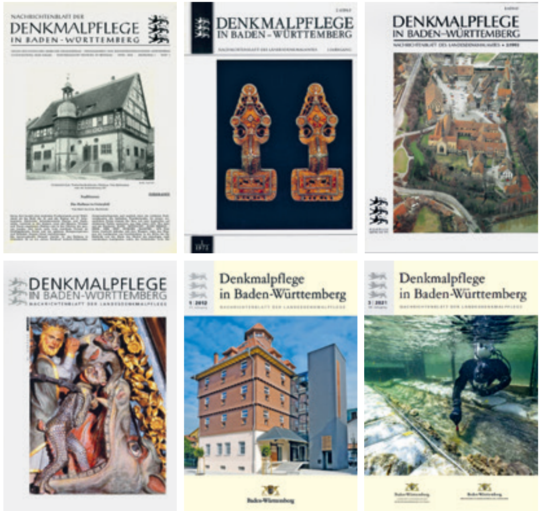
2 Titelblätter des Nachrichtenblattes im Wandel: Hefte von 1958 bis 2021.

amtes“ in „Nachrichtenblatt der Landesdenkmalpflege“ um. Dieser Titel ist ihr auch nach der Neuordnung der Denkmalpflege mit der Überführung aller Arbeitsgebiete in die Abteilung 8 des Regierungspräsidiums Stuttgart geblieben. Als Herausgeber fungieren heute das Landesamt für Denkmalpflege im Regierungspräsidium Stuttgart und das Ministerium für Landesentwicklung und Wohnen als oberste Denkmalschutzbehörde. 2022 wird nun mit dem Slogan „Wahre Werte Denkmale BW“ eine Dachmarke eingeführt, unter der sich die verschiedenen für die Denkmalpflege zuständigen staatlichen Institutionen (und ihre Kooperationspartner) versammeln (Abb. 3).