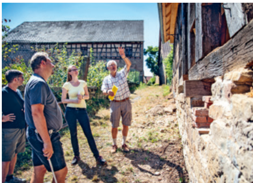
4 Eifrig diskutierten auch die Fachleute in Mühlacker-Lienzingen die Sanierung der ehemaligen Zehntscheune.