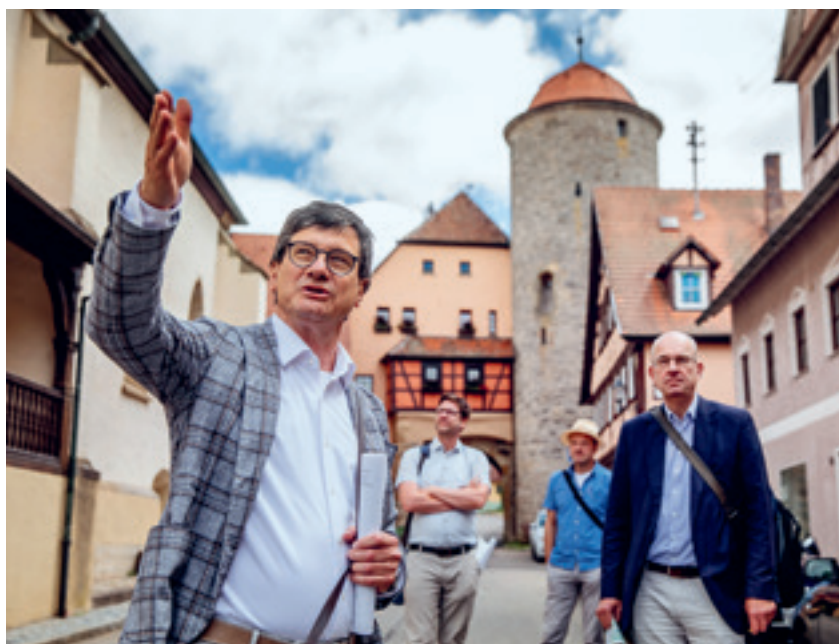
3 Beim Stadtrundgang in Langenburg wurde erörtert, nach welchen Kriterien in der denkmalgeschützten Gesamtanlage Solaranlagen installiert werden können.

Haben Sie Interesse an unserem neuen Veranstaltungsformat bekommen? 2023 findet der Tag für Ortsgespräche am 14. Juli statt. Bitte merken Sie sich den Termin heute schon vor. Irene Plein