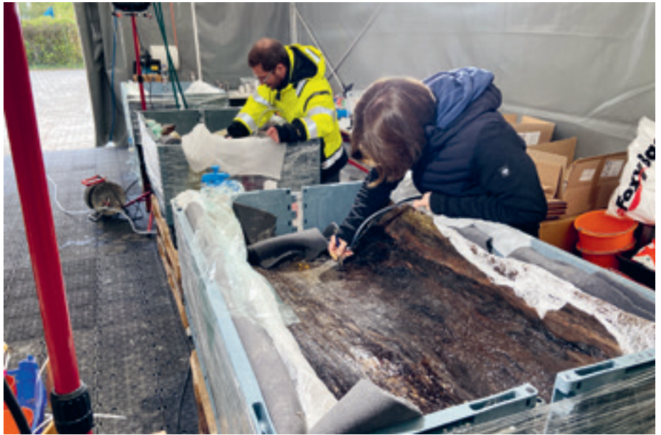
1 Konstanz, Einbaum vom Triboltinger Bohl, Reinigungsarbeiten mittels Airbrush, an der Innenseite eines Teilstücks des Einbaums aus Linde. An Land wurden die Teilstücke von der Archäologischen Restaurierung des Landesamts für Denkmalpflege übernommen und wenige Meter vom Wasser direkt versorgt.

Neben der Behandlung von herausragenden Objekten standen drei Fachthemen im Vordergrund. Zum einen das besonders bedeutsame Thema der langfristigen Konservierung solcher außergewöhnlicher Stücke, die allein schon ob ihrer Größe, man denke nur an den jüngst im Bodensee entdeckten jungsteinzeitlichen Einbaum, besonderer Logistik bedarf. Wie in den Beiträgen thematisiert wurde, hat in den letzten Jahrzehnten die archäologische Restaurierung beim Landesamt für Denkmalpflege in der Holzkonservierung neue technische Maßstäbe gesetzt, die den Erhalt bedeutsamer Funde auf lange Zeit sicherstellt. Allerdings führen die jüngsten geopolitischen Entwicklungen zu einer erheblichen Teuerung der Konservierungsverfahren, womit sich mittelfristig die Frage der Finanzierung stellen wird.