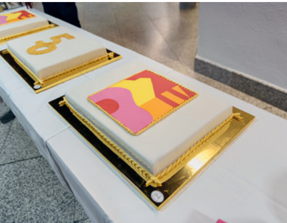
2 Motivtorten zum Jubiläum.

Das darauffolgende Podiumsgespräch unter dem Titel „Perspektiven der Denkmalpflege“