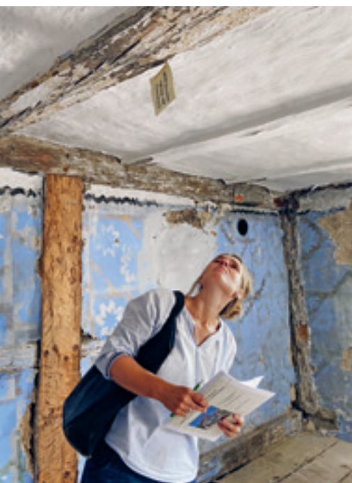
2 Auf Spurensuche im ehemaligen Verwalterhaus von Gut Bodman in Bodman-Ludwigshafen

Im Zuge des Klimawandels ist der massive und schnelle Ausbau regenerativer Energiequellen gefragt. Kulturdenkmale sind aufgrund ihrer grauen Energie, die im Bestand gebunden ist, allein durch ihren Erhalt gute Klimaschützer. Gleichwohl gilt es, in der Denkmalpflege liegen-