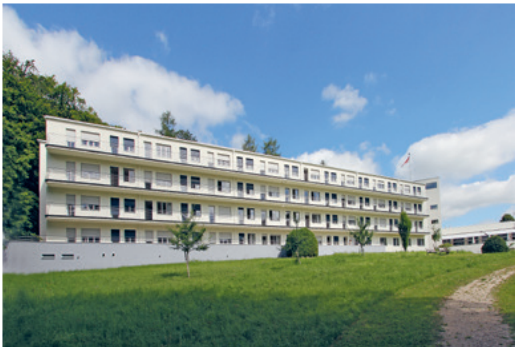
1 Ein Zeugnis des Neuen Bauens, das Haus auf der Alb in Bad Urach