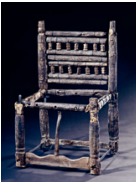
2 Der Zargenstuhl aus Grab 58 von Trossingen (zweite Hälfte 6. Jahrhundert) setzt sich hauptsächlich aus gedrechselten Teilen zusammen und wurde in Nut- und Federtechnik zusammengesetzt.

Unter dem reichhaltigen kulturellen Erbe, welches unter unseren Füßen schlummert, nehmen organische Funde eine besondere Stellung ein. Sie waren aufgrund der Erhaltungsbedingungen lange ein seltenes Fundgut und konnten auch nicht befriedigend konserviert werden. Insbesondere Holzfunde gehören in der Archäologie zu den besonders geschätzten Entdeckungen, da mit ihnen, abgesehen von den klassischen archäologischen Fragestellungen, auch Aussagen zur Umwelt beantwortet werden können und über naturwissenschaftliche Methoden eine zeitliche Einordnung möglich ist. In den letzten Jahrzehnten hat sich durch Untersuchungen in Feuchtböden, Seen oder unter Grundwasserabschluss, zum Beispiel in Latrinen oder Auffüllungen, der Fundanfall signifikant erhöht. Dies führt zu einer Ausnahmestellung von Baden-Württemberg im Vergleich zu vielen anderen Bundesländern, dem das Archäologische Landesmuseum aus Anlass seines 30-jährigen Jubiläums durch eine zweitägige Tagung in Konstanz Rechnung trug. Im Kreis von Kolleginnen und Kollegen aus Museen, Denkmalbehörden und Universitäten wurden aktuelle Forschungsergebnisse zu spektakulären Holzfunden von der Jungsteinzeit bis zur Frühen Neuzeit aus südwestdeutschem Boden präsentiert und diskutiert.