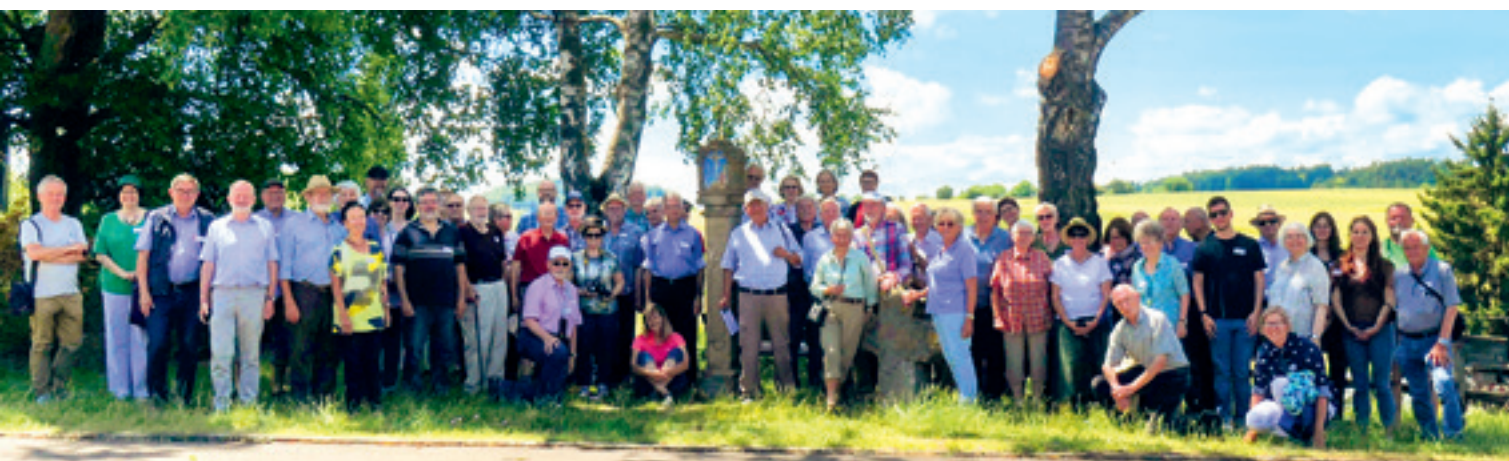
2 Die Tagungsgruppe auf der Exkursion zu Kleindenkmälern, hier in Rottenburg-Wendelsheim.