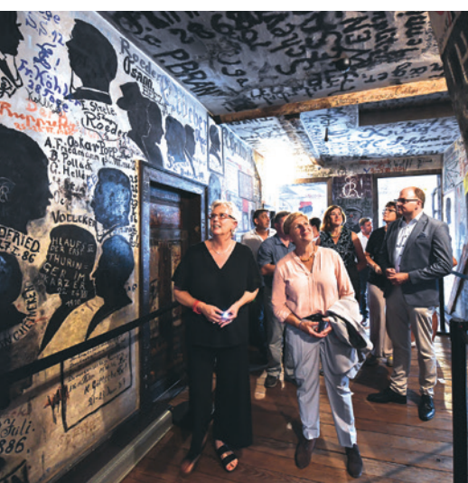
10 Die Ministerin zu Besuch im Studentenkarzer in Heidelberg (12.9.2026).