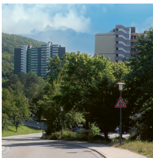
11 Wohnsiedlung im Wald: Heidelberg Emmertsgrund (16.9.2026).