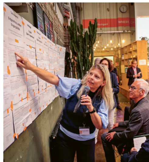
5 Ehrenamtsforum der Landesdenkmalpflege 2025 (15.4.2026).