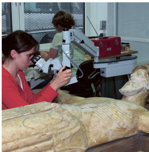
3 Arbeit in den Restaurierungswerkstätten der Bau- und Kunstdenkmalfpflege (30.1.2026).