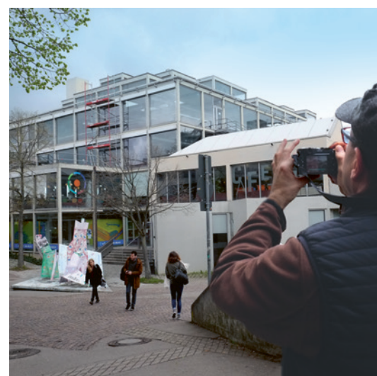
8 Inventariseur bei der Arbeit (8.7.2026).