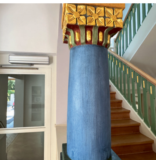
6 Immer wieder Gold bei der Innenraumgestaltung in Pforzheim (13.5.2026).