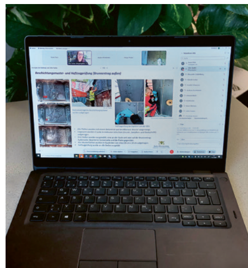
1 Im Fortbildungsprogramm wechseln sich digitale und analoge Angebote ab.