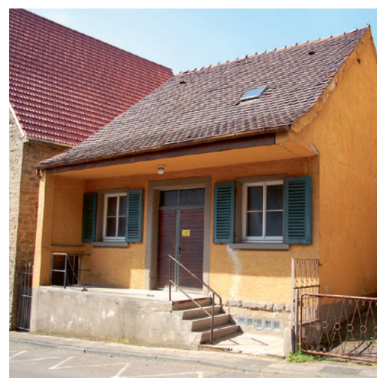
12 Schnell vergessen und bedroht: ländliche Bauten wie hier in Eppingen (11.11.2026).