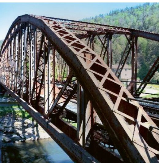
2 Eisenbahnbrücke Unterreichenbach (14.1.2026).