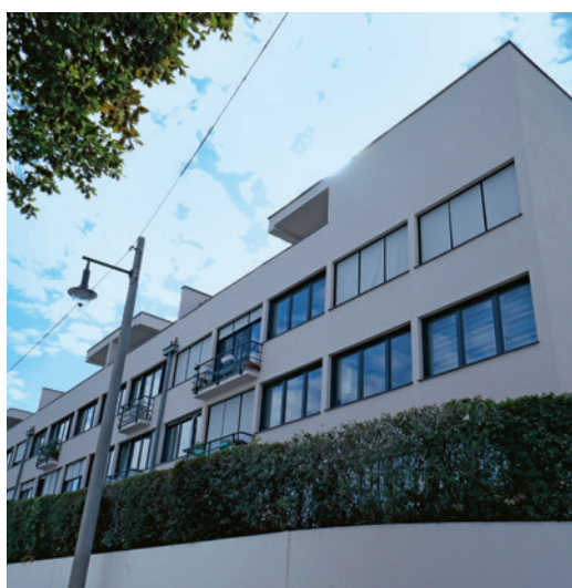
7 Wärmeschutz am Wohnblock von Mies van der Rohe auf dem Weißenhof (17.6.2026).