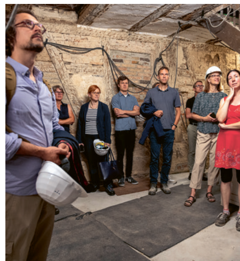
9 Besprechung vor Ort in der Denkmalbaustelle.