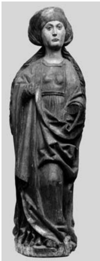
4 u. 5 Historische Aufnahmen von den Schreinflügelfiguren Sebastian und Magdalena nach 1900.

Die Flügelgemälde sind alle auf Nadelholztafeln gemalt, welche aus mehreren Brettern bis zur gewünschten Breite zusammengefügt wurden. In den oberen vergoldeten Bildbereichen wurden