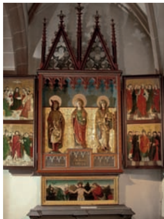
1 Das Retabel aus der evangelischen Stadtkirche in Murrhardt, Gesamtaufnahme nach der Restaurierung.

Vier Gruppen von Heiligen zieren die Gemälde an den Innenseiten der Schreinflügel, ebenfalls um das Jahr 1500 gemalt. Auf dem vom Betrachter aus linken Flügel ist im oberen Gemälde Maria im