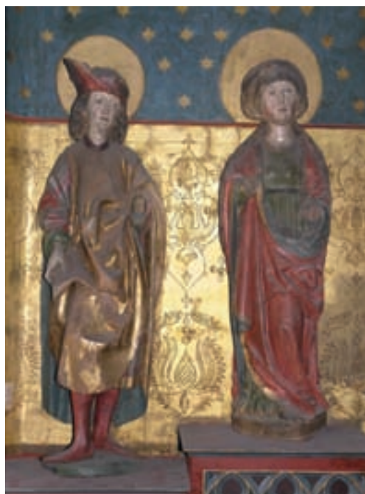
3 Sebastian und Magdalena im Schrein, Zustand vor der Restaurierung.

zuheben. Gesichter und Haare sind sehr fein ausgearbeitet, an den Handrücken sind, der Natur entsprechend, erhöhte Adern zu sehen. Dagegen wirkt die Magdalenenfigur in ihrer Ausführung schlichter. So sind zum Beispiel die Faltenwürfe ihres Mantels im Gegensatz zu denen der beiden flankierenden Skulpturen weniger plastisch ausgearbeitet (Abb. 3).