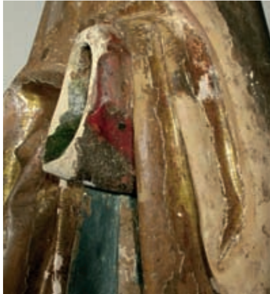
12 Linke Schulterpartie des hl. Sebastian nach der Restaurierung.