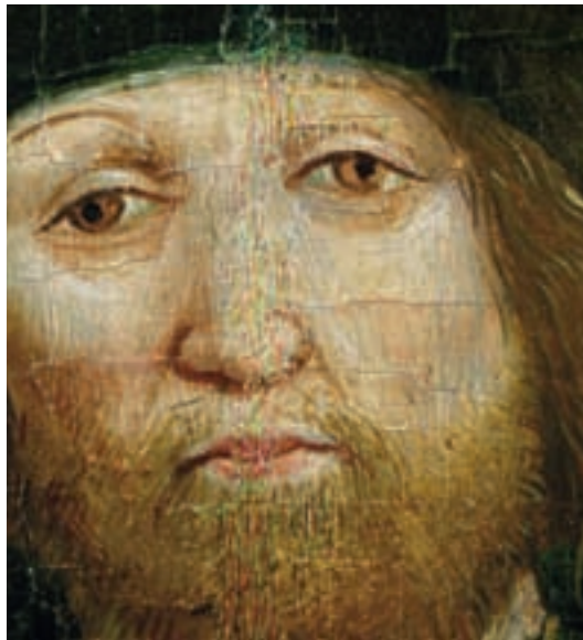
16 Kopf des Jakobus aus dem rechten Seitenflügel mit vierfarbiger Strichretusche.

Umfangreiche Dokumentationen gehören zum Standard heutiger Restaurierungspraxis. Deshalb wurden während der Arbeiten alle festgestellten