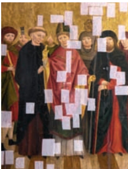
10 Unteres Gemälde des rechten Seitenflügels nach Abnahme der Altkittungen.