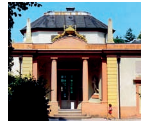
5 Südseite mit Vorhalle und Tambour im Zustand vor der Restaurierung. Die abgestufte obere Dachpartie des Tambours ist mit Blei gedeckt, während das Dach einen Schieferbelag hat, der 1996 provisorisch mit Dachpappe eingekleidet wurde.

Auf seinen Stichen bildet Graff 1799 eine balustradenartige Bekrönung des Tambours ab und zeichnet in den Schnitten eine auf den Abstufungen aufgesetzte Holzkonstruktion. In der Zeit von 1825 bis 1828 entstandene Abbildungen des