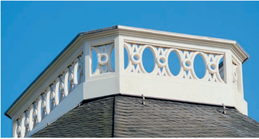
6 Anhand der Befunde und Stiche von Anton Graff rekonstruierte Bekrönung des Tambours.

Badhauses zeigen schon die Form des unfertig wirkenden Tambourdaches, wie sie bis 2005 vorhanden war. Die bei der Instandsetzung des Tambours erforderlichen Freilegungen boten die Gelegenheit, die Tambourkrone zu untersuchen. Schon vor längerer Zeit müssen die Abheilungen an den Kranzpfetten des Firstes erfolgt sein. Bis auf ein 3,60 m langes Balkenstück blieben von der Abstufung des Firstes keine Originalhölzer erhalten. An der Flanke dieses von der unteren Stufe stammenden Balkens sind in gleichen Abständen Löcher gebohrt, die als Befestigungspunkte einer Konstruktion gedient haben können. Bei Graffs Darstellungen fallen im Vergleich zu den neuen Maßaufnahmen die Maßgenauigkeit und die präzise dargestellten, in allen Einzelheiten dem Bestand entsprechenden Details auf. Graffs Dachbekrönung passt genau auf die vorhandene Konstruktion. Sie setzt durch die übereinstimmende Dachneigung und Seitenlänge so