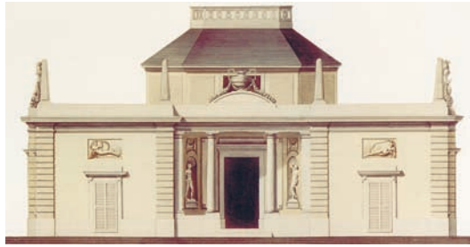
2 Frontseiten des Badhauses mit Bekrönung des Tambours. Stich von Anton Graff, 1799.