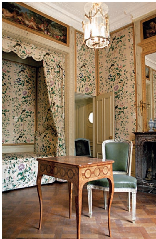
11 Ruhezimmer mit wiederhergestellter Seidentapete. Links Bettnische und Retirade.

Um bei der Rekonstruktion durch eine Dresdener Seidenmanufaktur ein in allen Einzelheiten dem Original entsprechendes Bild zu erreichen, wurde ein intakter Rapport des Originals mit einem