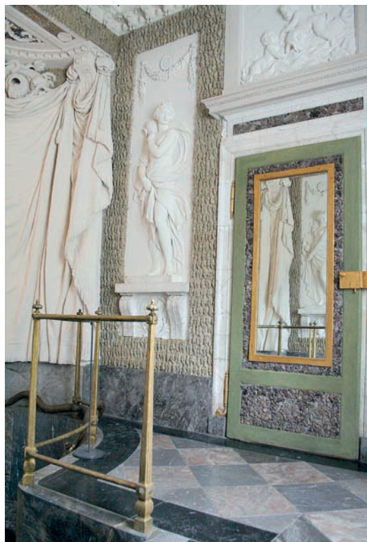
8 Vorzimmer mit Stuckmarmor und Stuckdekorationen. Blick durch die geöffnete Tür ins Badkabinett.