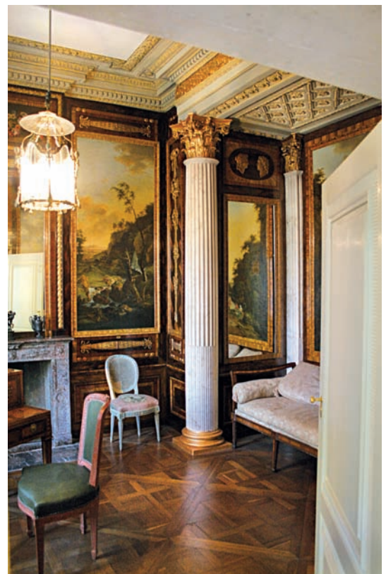
12 Schreibzimmer mit Vertäfelungen und Gemälden, Marmorsäulen des Alkovens mit vergoldeten Kapitellen.