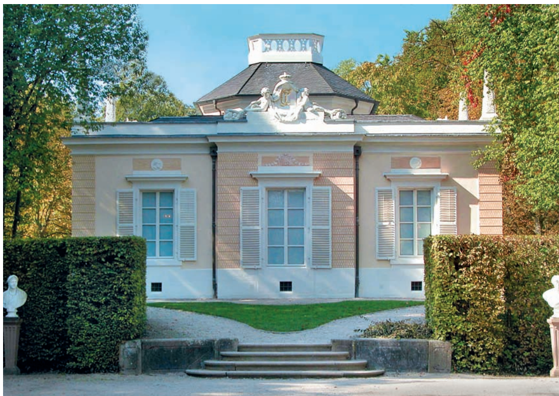
1 Ostfassade nach der Restaurierung. Das mittlere Wandfeld tritt risalitartig etwas hervor, auf der Attika darüber ein plastischer Aufbau eines von Putten flankierten Ovalschildes mit Mantel- drapierung, Monogramm CT und Kurhut. Darüber Tambour mit Bekrönung.