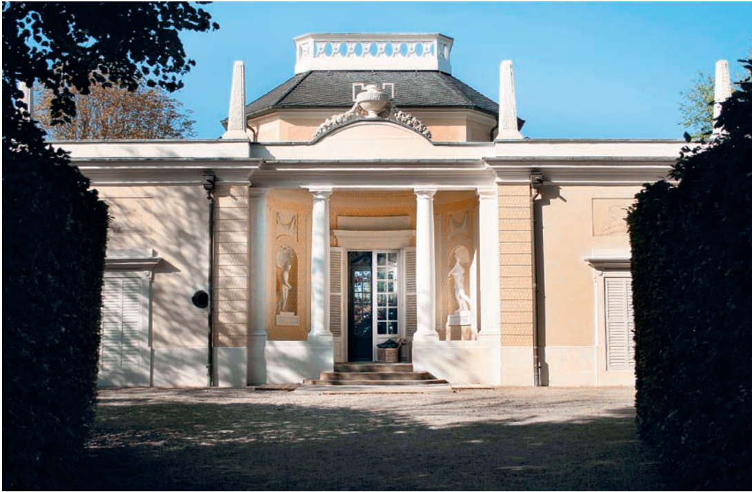
4 Zur Nordfassade identische Südfassade mit Vorhalle und Tambour mit Bekrönung nach der Restaurierung.