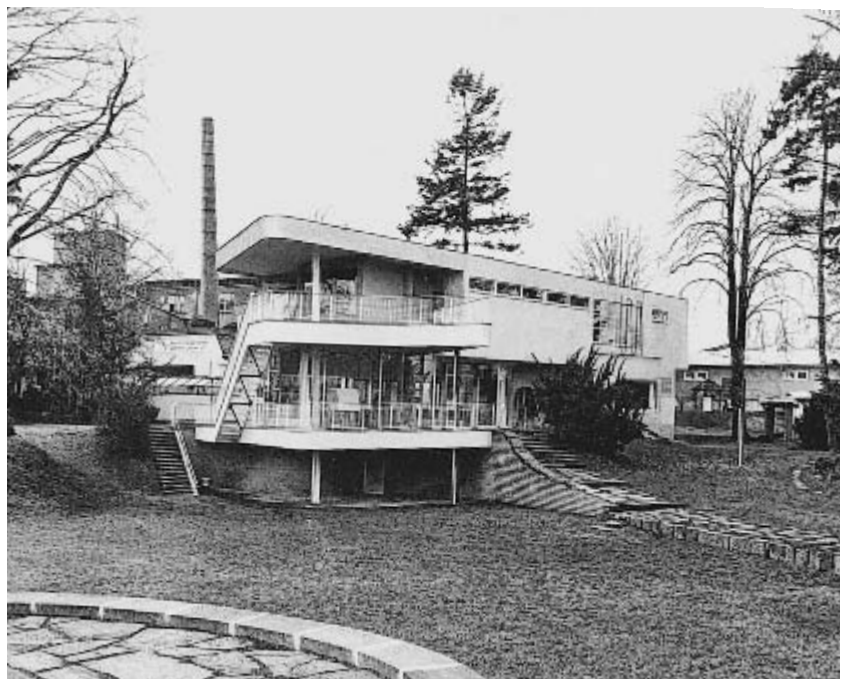
3 Löbau, Haus Schmincke: Nordostseite mit ehem. Fabrik im Hintergrund, Zustand 2001.

Die behutsame Restaurierung der weitgehend authentisch überlieferten Villa Schmincke in Löbau, erbaut 1932–33 von Hans Scharoun, stellte Ulrich Rosner vom Landamt für Denkmalpflege