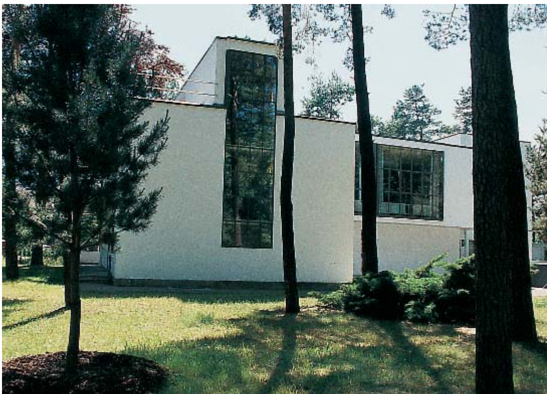
1 Die Meisterhäuser von Walter Gropius in Dessau, erbaut 1924/25 wurden bzw. werden auf den Zustand beim Auszug der Meister, 1934, restauriert; in diesem Zusammenhang werden an den Außenbauten die Atelierfenster und die ursprüngliche Höhe der Treppenhau-stürme sowie die Farb-igkeit rekonstruiert. Hier das bereits fertig gestellte Haus Feininger, das durch einen Kriegsverlust als halbes Doppelhaus auf uns gekommen ist.

HPC Weidner (Landesamt für Denkmalpflege Sachsen-Anhalt) charakterisierte in seinem Vortrag „Zeit, Ort und Bild. Denkmalgestalt und Denkmalpflege“ die drei Komponenten eines Kulturdenkmals. Jedes Denkmal ist statisch und/oder