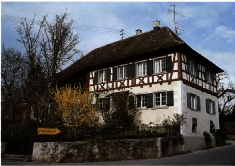
5 Anwesen in der Leder-gasse. Putz- und Fachwerkbauten, Giebel- und Traufstellung wechseln ab.