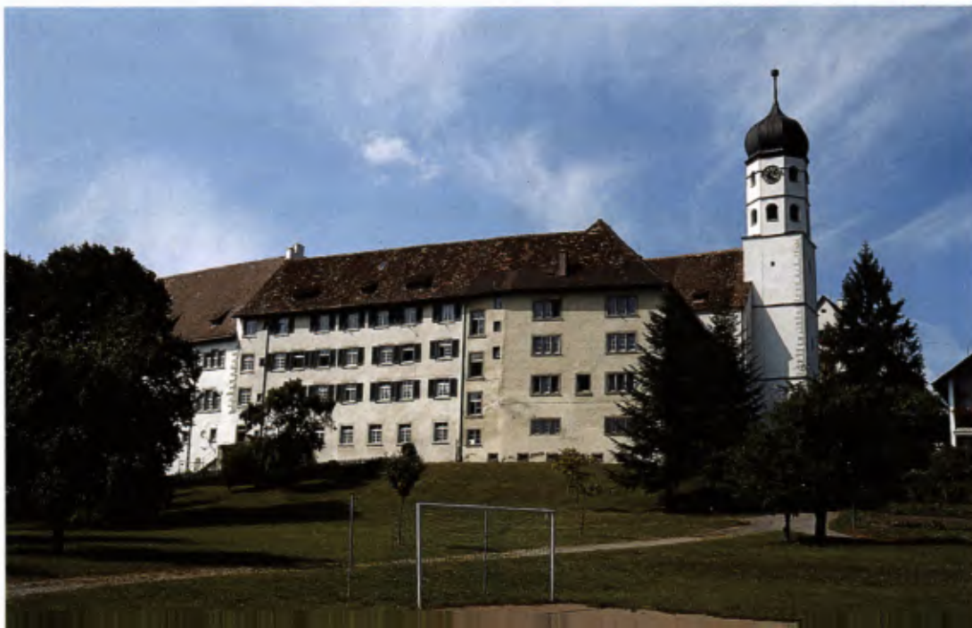
1 Ehemaliges Augustinerchorherrenstift Öhningen von Süden. Der westliche Teil des Stiftsbezirks mit Konvent, Kirche und Amtshaus.