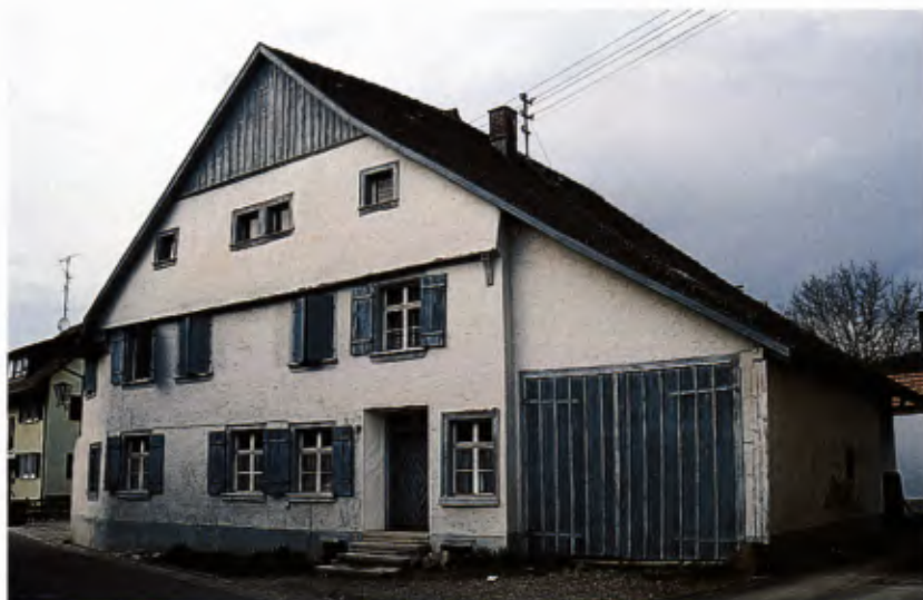
4 Anwesen in der Oberdorfstraße, der Hauptachse des Dorfes.

nung im Frühjahr 1999 wieder aufgenommen. Im Zusammenhang mit diesen Planungen fanden wiederholt Gespräche mit dem Landesdenkmalamt statt. Die hohe Bedeutung des Stiftsbezirks war allen Beteiligten von Anfang an bewusst; von Seiten der Gemeinde wurde die Frage gestellt, ob es sich um eine Gesamtanlage handle. Im Laufe der Gespräche wurde deutlich, dass der Stiftsbezirk nicht isoliert betrachtet werden dürfe, dass sinnvollerweise das angrenzende Dorf in die Überlegungen zur Erhaltung des historischen Ortskerns einbezogen werden sollte. Eine Sichtung der historischen Unterlagen und eine erste Bestandsaufnahme von Seiten unseres Amtes zeigte, dass Stift und Dorf seit dem Mittelalter eine enge funktionale und räumliche Einheit bildeten. Die Situation, die uns durch die Gemarkungskarte von 1703 und eine Vogelschau aus der Mitte des 18. Jahrhunderts (Abb. 3) überliefert ist, finden wir heute noch wieder. Die wesentlichen Bestandteile sind erhalten bzw. deutlich ablesbar.