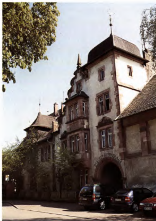
6 Lahr, ehemaliger Meyerhof, Schankhaus, der Riegeler Brauerei.

Die Auffassung, erst der Krieg von 1870, in dem die Badener mit Preußen und Bayern im Felde standen, habe es ermöglicht, in Baden das Bier als Volksgetränk durchzusetzen, da die Badner, heimgekehrt, das Getränk, an das sie sich gewöhnt hatten, nicht hätten missen wollen, erscheint plausibel, jedenfalls ist nach 1870 eine starke Zunahme des Bierabsatzes zu verzeichnen. Die Riegeler-Brauerei ragte durch ihre Meyerhöfe hervor, wobei sie es verstand, für diese bedeutende Architekten zu gewinnen. Nachdem eine Zeit lang Carl Schäfer (1844–1908) der Riegeler Brauerei als Architekt gedient hatte, trat der Münchner Julius von der Ohe an seine Stelle. In Lahr ist die Riegeler Bierablage nebst Schankhaus bis heute erhalten. Hier verfuhr die Riegeler Brauerei so, dass sie ein bestehendes, 1895 in neugotischen Formen von J. Radge erbautes Wohnhaus 1910 durch von der Ohe erweitern und in einen typischen Meyerhof in Formen der deutschen Renaissance verwandeln ließ. Die Schauseite der Anlage ist gegen die Kaiserstraße gerichtet, ein turmartig überhöhter Tordurchgang mit asymmetrischem Voluten-