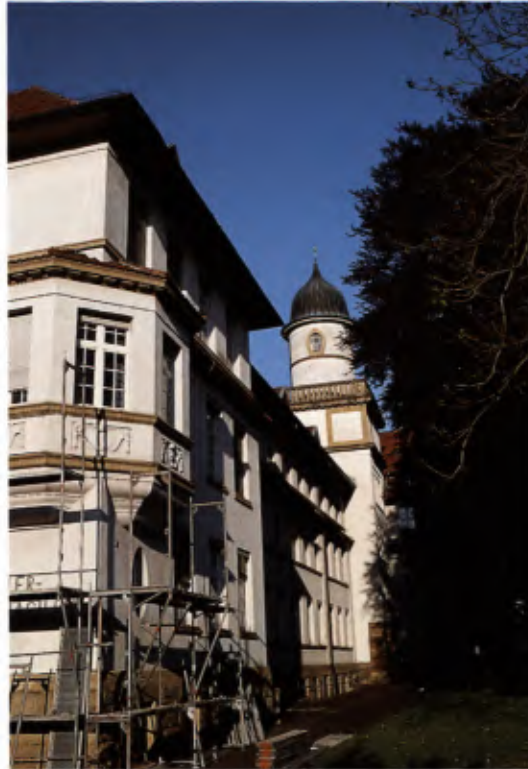
11 Offenburg, Schiller-Gymnasium.

Baden. Land-Staat-Volk. 1806–1807. Hrsg. vom Generallandesarchiv Karlsruhe. Karlsruhe 1980. Badische Geschichte. Vom Großherzogtum bis zur Gegenwart. Hrsg. von der Landeszentrale für politische Bildung Baden-Württemberg. Stuttgart 1979. Horst Dittrich/Lothar Mund: Plätze, Straßen, Häuser. Stadt Offenburg. Die Bauten der Jahrhundertwende am Beispiel der Oststadt. Offenburg 1983. Michael Friedmann: Die Offenburger Innenstadt. Ein historischer Rundgang. Offenburg 1979. Gerhard Gamber u. a.: Daheim im Ortenaukreis. Konstanz 1990. Otto Kähni/Franz Huber: Offenburg. Aus der Geschichte einer Reichsstadt. Offenburger Köpfe, Offenburger Gestalten. Offenburg 1951. Hubert Kewitz: Der Weinbrenner Schüler Johann (Hans) Voss. In : Geroldsecker Land. Heft 16, 1974, S. 89–103. Heinz Kneile: Bürgerliche Wohnarchitektur in Städten des Großherzogtums Baden. Freiburg 1976. Lahr um 1900. Bauten und Baumeister. Hrsg. vom Kulturkreis Lahr e.V. 2 Bde. Lahr 1997–91. Geschichte der Stadt Lahr. Hrsg. von der Stadt Lahr. 3 Bde. Lahr 1989. Gerhard Lötsch: Christian Roller und Ernst Fink. Die Anfänge von Illenau. Achern 1996.