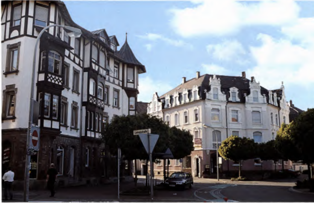
7 Offenburg, Schillerplatz.

mit Curjel und Moser zu tun zu haben. Auch in der Schweiz gewannen Curjel und Moser einen Wettbewerb nach dem anderen, wobei von Zeitgenossen berichtet wird, sie hätten die Anonymität des Wettbewerbs dadurch relativiert, dass sie ihre Planeinsendungen in die „Karlsruher Zeitung“ eingewickelt hätten, sodass mit „Karlsruhe“ offenkundig war, dass es sich um Curjel und Moser handelte. Nach dem Ausbruch des Ersten Weltkrieges erkannte Karl Moser, dass die gute Zeit endgültig dahin war, schloss 1915 sein Architekturbureau in Karlsruhe und kehrte in die Schweiz zurück. Die ehem. Reichsbank in Lahr von 1905 ist ein maßvoller, stilsicherer Jugendstilbau auf dem modernsten Stand der Zeit.