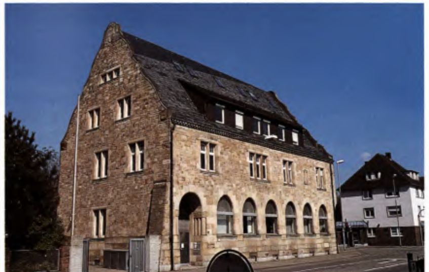
8 Lahr, ehemalige Reichsbank.

dort Gesundheit und neue Kraft zu schöpfen. Entsprechend blühten in dieser Zeit Einrichtungen wie der Schwarzwaldverein ganz besonders. Mit Jugendbewegung und Wandern in der Natur verband sich nicht selten auch die Heimatliebe und die Begeisterung für den Reichsgründer Bismarck. Diese Gedanken liegen der hochherzigen Stiftung zu Grunde, die „Fabrikdirektor“ Nauwerk in Oberachern und Vorsitzender des badi-schen Schwarzwaldvereins 1910 für die Errichtung eines der Aussicht dienenden Turmes (Bismarckturm) auf der Hornisgrinde als dem höchsten Punkt des nördlichen Schwarzwaldes machte. Mit der Planung dieses Turmes beauftragte er den Karlsruher Architekten Hermann Walder (1847–1921). Hermann Walder, der in Karlsruhe die Brauerei Monninger und andere Brauereien in Baden errichtet hatte, galt nicht nur als Spezialist für Brauereien, sondern auch für den Industrie-