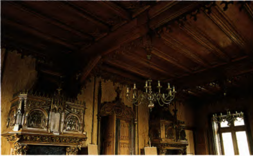
4 Ortenberg, Schloss, Rittersaal.