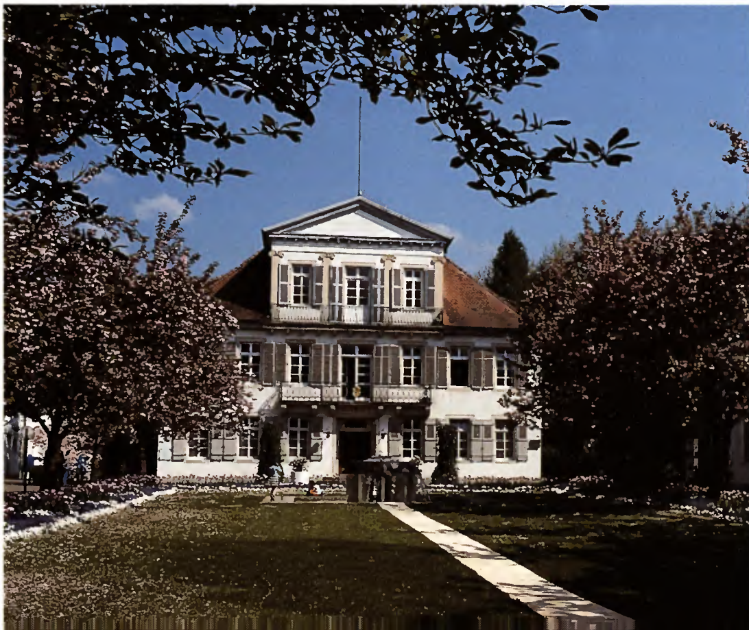
1 Lahr, „Fabrikvilla“ Lenz von Lotzbeck (jetzt Rathaus).