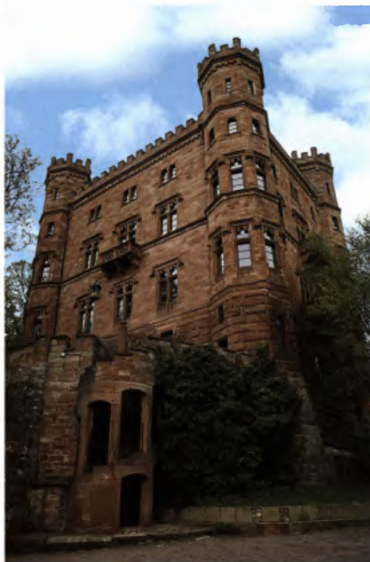
3 Ortenberg, Schloss.

Zu diesem Personenkreis gehörte der baltische Adlige Gabriel Leonhardt von Berckholtz (1781–1863). 1781 in Riga geboren, kam er durch Erbe und kaufmännische Tätigkeit zu großem Vermögen, das ihn 1825, durchaus im Stil des Adels im zaristischen Russland, dazu veranlasste, mit seiner Familie „auf Reisen zu gehen“. 1830 ließ er sich in Karlsruhe nieder, dort las er im Verkündblatt, dass die Großherzogliche Hofdomänenkammer das „herrschaftliche Ortenberger Schlossrebgut“ zum Verkauf versteigere. Er beauftragte Hofbanquier von Haber, für ihn zu bieten, und erhielt den Zuschlag. Damit kam er 1833 in den Besitz nicht nur von Reben, sondern auch einer großen mittelalterlichen Burgruine. Was nun einsetzte, kann für einen baltischen Adligen kaum typischer sein. Die baltischen Adligen, meist deutschstämmig, hielten in ihrem seit dem 18. Jahrhundert zum Kaiserreich Russland gehö-