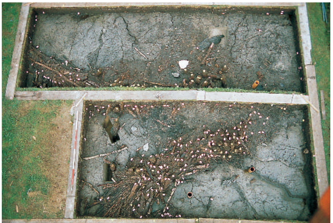
9 Eisenzeitliche Fischfanganlage in der Station Oggelshausen-Bruckgraben. Aus Brettern und Stangen gebaute Leitwerke führen trichterförmig unter ein kleines, im vorliegenden Ausgrabungsstadium nur noch durch einige Pfosten erkennbares Pfahlhaus. In die Engstelle wurden offenbar Reusen gesetzt und vom Haus aus bedient.

Für etwa 3800 Jahre waren die Feuchtgebiete des Federsees als Siedlungsgelände aufgesucht worden. Der Vorgang gibt sich nicht als Kontinuum, sondern als ein von Seespiegelanstiegen und Siedlungsdynamik vielfach unterbrochener Prozess zu erkennen. Im archäologischen Fundmaterial aller Epochen nachweisbare, weit reichende Kulturkontakte zeigen dabei, dass die ablesbaren Stadien der Entwicklung nicht als Sonderfall einer peripheren Kleinlandschaft abgetan werden können. Der Federsee war, unweit der Oberen Donau und an einer nach Süden zum Bodensee und über die Alpen führenden Verkehrsachse gelegen, in das weiträumige Geschehen Mitteleuropas eingebunden. Dies verleiht den hier unter günstigen Erhaltungsbedingungen gewonnenen Erkenntnissen besondere Bedeutung. Es ist deshalb besonders erfreulich, dass es durch Flächenerwerb mit Sondermitteln des Finanzministeriums und durch enge Zusammenarbeit mit dem Naturschutz in zunehmendem Maße ge-