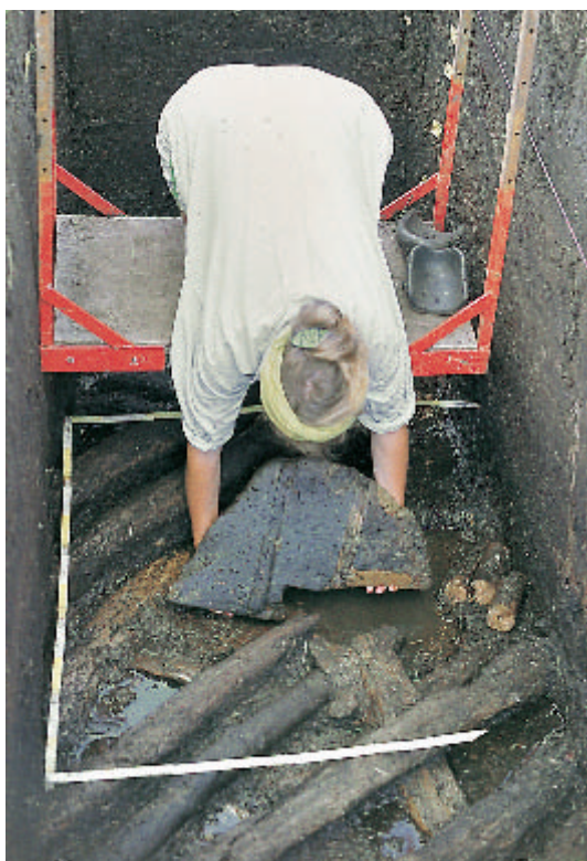
6 Bergung eines Vollscheibenrades am Rande der Siedlung Alleshausen-Grundwiesen. Deutlich erkennt man das rechteckige Achsloch und die Einschubleisten, mit denen das Rad aus zwei Teilen zusammengefügt war.

Für die Eisenzeit sind wiederum Moorwege zur Insel Buchau nachgewiesen, die offenbar weiteren Siedlungen Schutz bot. Eine Klimaschwankung hatte um 850 v. Chr. zur Aufgabe der Moorsiedlungen gezwungen. Vom Bodensee bis zum Neuenburger See wurden in diesen Jahren die Pfahlbausiedlungen für immer verlassen. Wir waren deshalb sehr erstaunt, als bei Oggelshausen eisenzeitliche Pfahlstrukturen und Siedlungsreste im Flachwasser einer subfossilen, heute nicht mehr bestehenden Bachmündung weit im ehe-