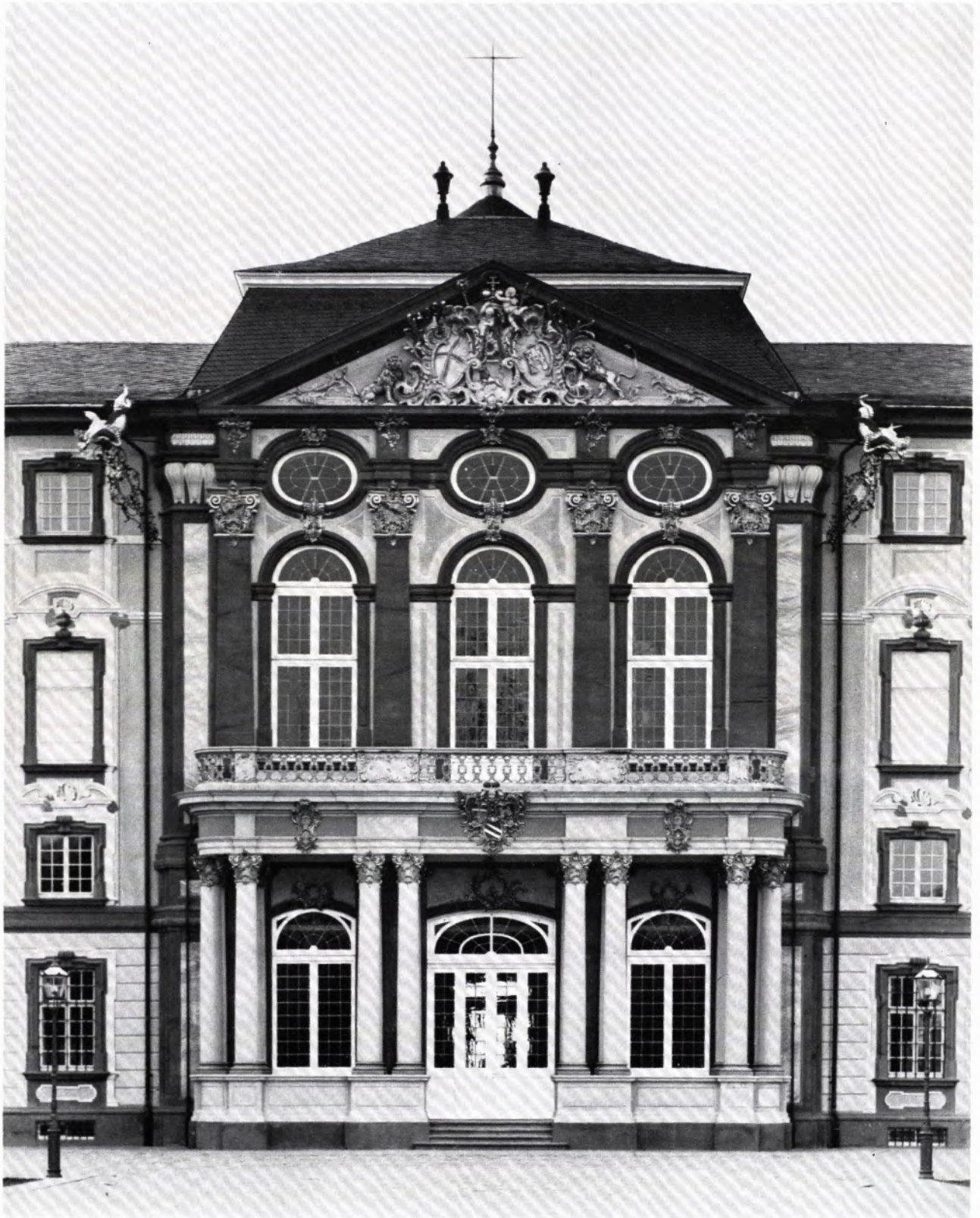
SCHLOSS BRUCHSAL. Dreißig Jahre nach der Zerstörung, nach rund achtzehnjähriger Wiederaufbauzeit, konnte die Stadt Bruchsal die Wiedereröffnung ihres Schlosses feiern. Der Mittelteil der berühmten Barockanlage wird als Außenstelle des Badischen Landesmuseums der Öffentlichkeit zugänglich sein. Kuppelsaal, Fürstensaal und Marmorsaal – die drei originalgetreu wiederhergestellten Prunkräume – sowie die Treppe Balthasar Neumanns sollen auch für repräsentative Zwecke zur Verfügung stehen.