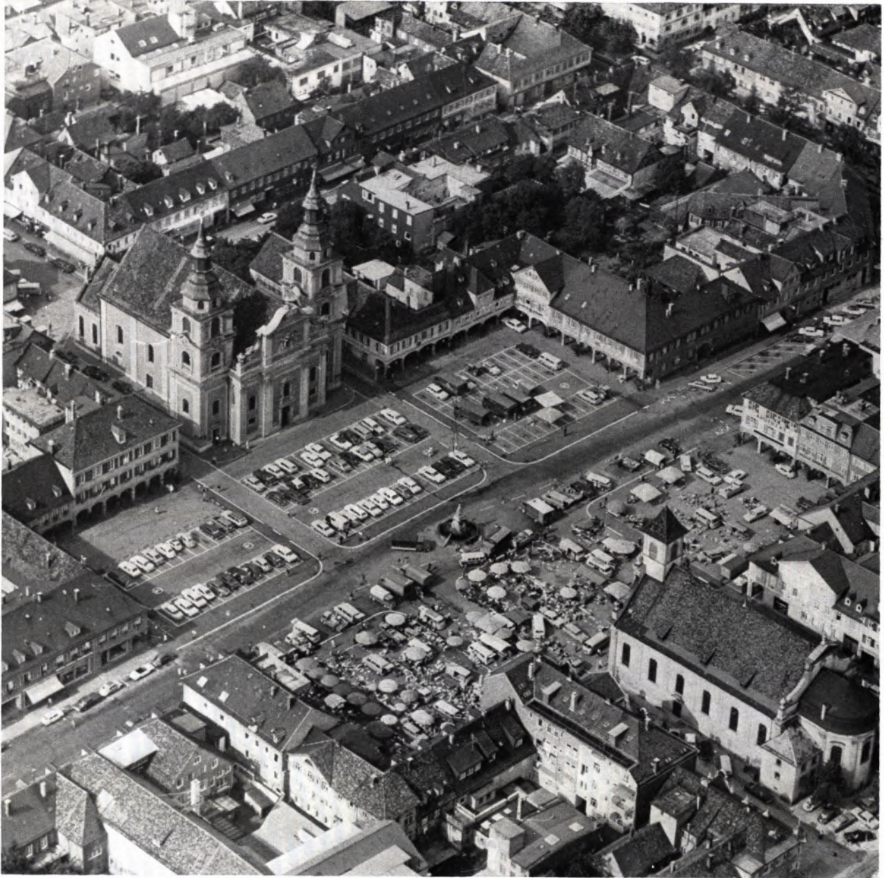
LUDWIGSBURG – MARKTPLATZ. „Weit und breit in seiner Ausdehnung umgeben ihn über luftigen Arkaden hingelagerte Häuser, deren Höhe der Baumeister absichtlich ganz niedrig bemessen hat, um den beiden Kirchen die beherrschende Wucht des Eindrucks zu sichern.“ (Belschner/Hudelmaier, Ludwigsburg im Wechsel der Zeiten, 1969) Seit 1709 entstand neben dem Schloß die Stadt Ludwigsburg. Wie sonst nicht oft zu sehen, konnte ihr Kerngebiet seine Einheitlichkeit über die Jahrhunderte bewahren und spiegelt so auch heute noch als erstklassiges Beispiel das Milieu seiner Entstehung, den aufgeklärten Absolutismus, wider. Noch in diesem Jahr wird die hervorragende Raumschöpfung unter Denkmalschutz gestellt werden.