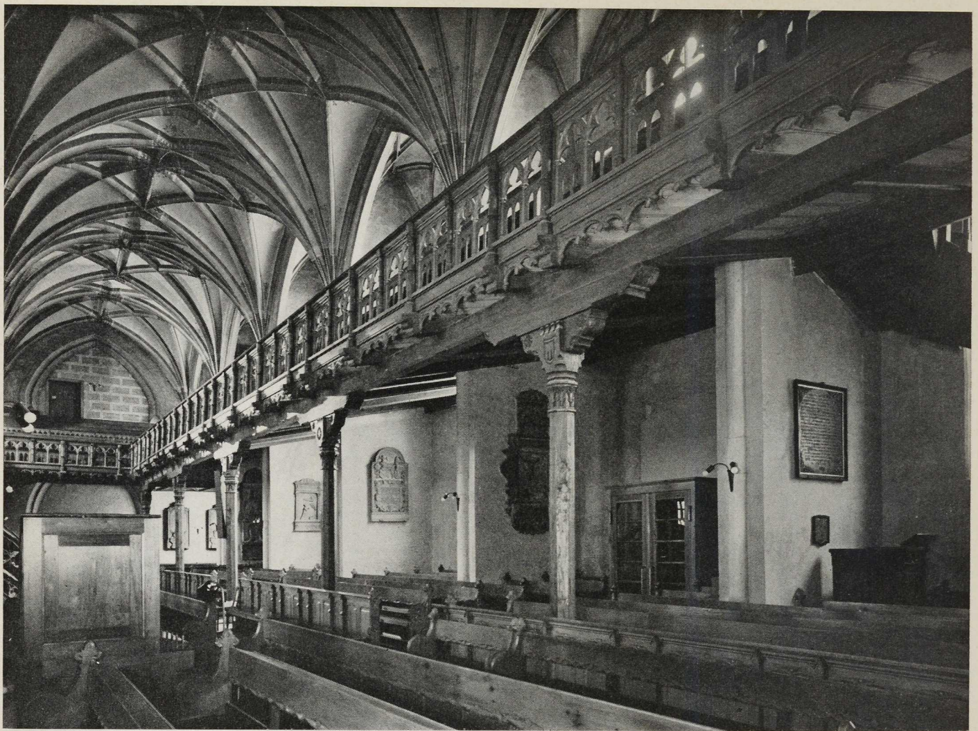
Tübingen. Ev. Stiftskirche. Nordschiff gegen Westen vor der Erneuerung