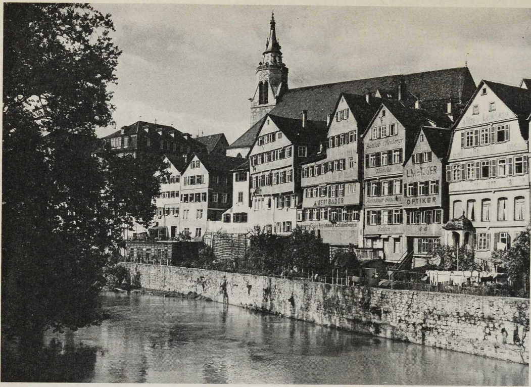
Tübingen Stiftskirche über der Neckarfront