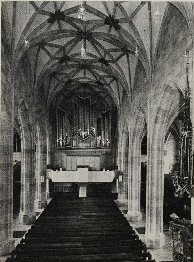
Tübingen. Ev. Stiftskirche. Langhaus gegen Westen vor der Erneuerung

festhalten wollte, was im Interesse der Raumwirkung einer Hallenkirche bedauert werden mag — eine zurückhaltendere Form gefunden werden. Immerhin wurden die Emporen tüchtig gesenkt und zurückgenommen. Hierdurch gelangen die Seitenschiffenster, die bisher in ihrem unteren Drittel schonungslos durchschnitten waren, besser zur Geltung. Auch sie wurden neu gestaltet; E. Kieß schuf die in abstrakten Formen gestalteten Verglasungen, während die mit figürlichen Darstellungen ausgezeichneten Fenster H. G. von Stockhausen und W. D. Kohler zu verdanken sind. Das Spiel der gegensätzlichen Wirkungen ist sehr reizvoll ausgefallen, nicht zuletzt im Blick auf die wertvollen ab 1476 entstandenen Scheiben des Straßburger Meisters Peter Hemmel im Chor.