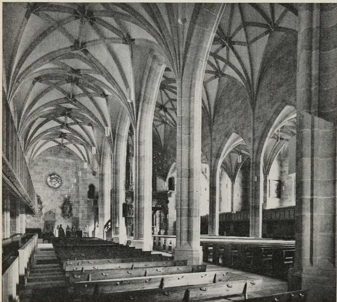
Tübingen. Ev. Stiftskirche

Es sprach bis zu einem gewissen Grade mit, daß die beiderseits des Altars aufgestellten spätgotischen Chorstühle unter den