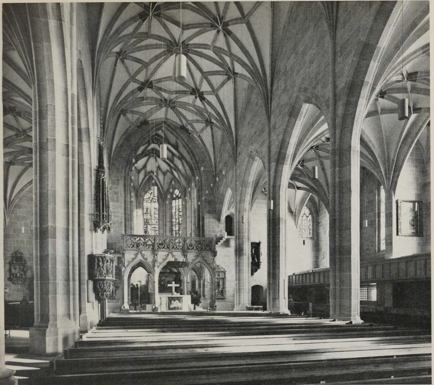
Tübingen. Ev. Stiftskirche. Langhaus (Mittelschiff) gegen Osten nach der Instandsetzung