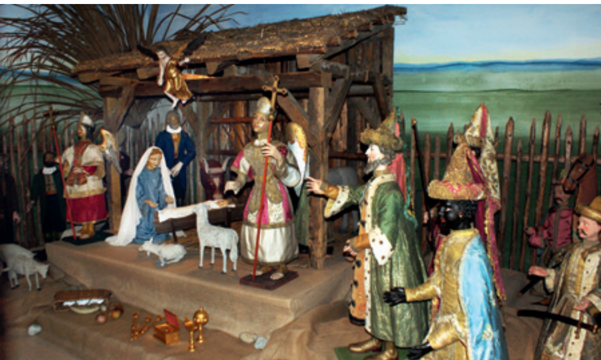
1 Die Krippe nach Abschluss der Maßnahmen.