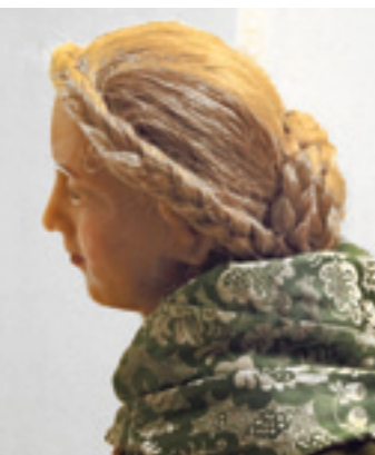
13 und 14 Hirtenfrau, Kopfhaar, oben: im ange-troffenen Zustand, unten: Ersatz des Haares.