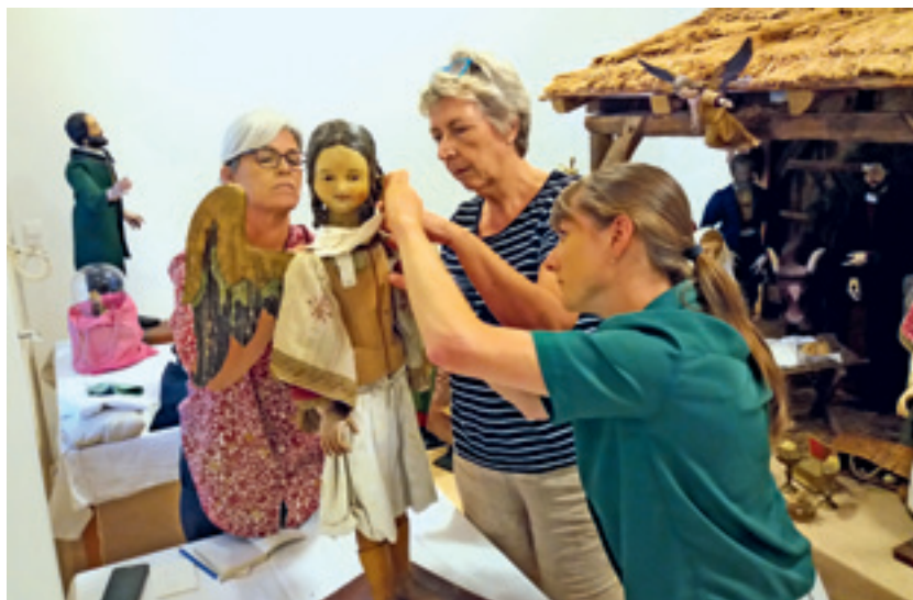
11 Das Team der Restauratorinnen.

Zunächst wurde eine massive Oberflächenverstaubung festgestellt. Der regelmäßige Auf- und Abbau der Szenerie führte zu Quetschungen, Knicken und Falten bis hin zu Brüchen in den empfindlichen Geweben. Vor allem die Seidenstoffe sind durch Alterung ausgebleicht und versprödet. Sie haben an Substanz verloren. Reibung untereinander hat besonders den Brokatstoffen hart zugesetzt. Durch dicht gedrängtes Stehen verhakte sich der