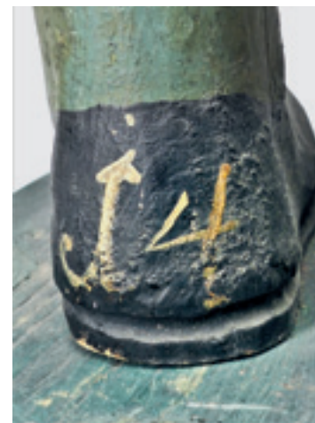
7 Fuß einer Hirtenfrau, Alt Nummerierung an der Ferse.