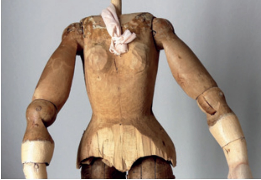
2 Hanna, detailliert ausgearbeitetes Körpergerüst, mit umfänglich variablen Gelenken. Vorne nachträglich derb abgearbeitet.