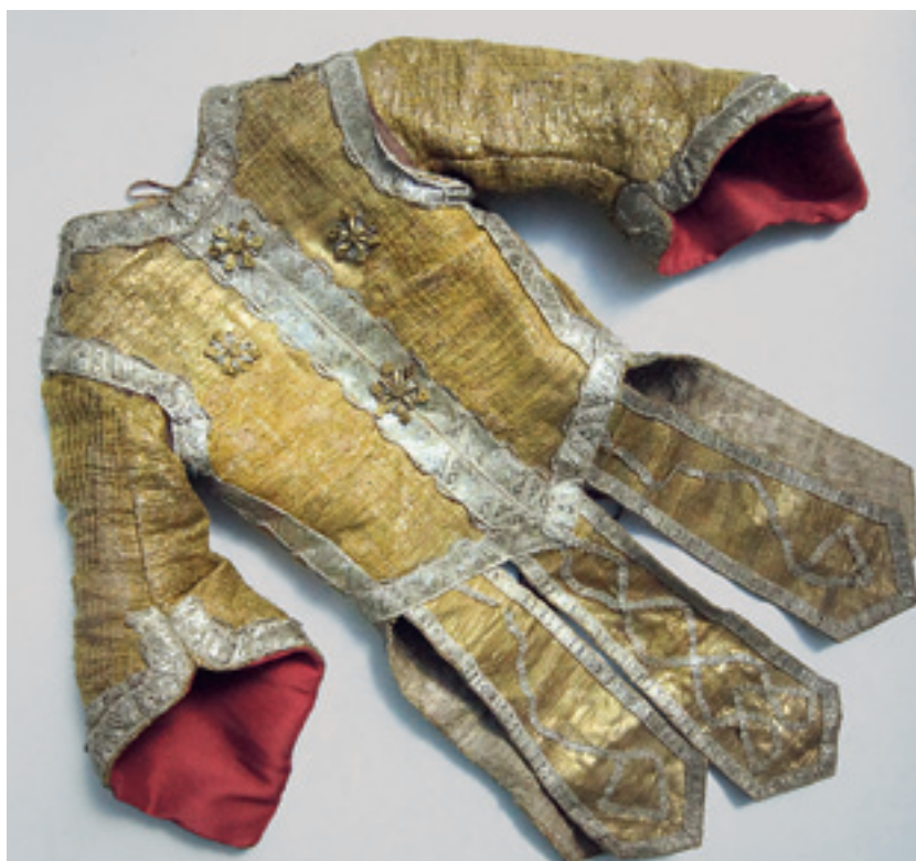
12 Ein Königswams im restaurierten Zustand.

Die Figuren wurden bei fotografischer Dokumentation der Arbeitsschritte gruppenweise vor Ort entkleidet (Abb. 11). Die meisten Jacken oder Mäntel konnten ohne Probleme entfernt werden, da zu diesem Zweck Bindebänder oder Haken und Ösen im Arm- und Schulterbereich angebracht sind. Manche Figuren wurden jedoch in die Kleidungsstücke eingenäht. Hier mussten Nähte geöffnet