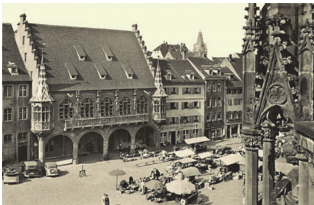
11 Das „Kaufhaus“ in Freiburg, 1946 bis 1951 Sitz des südbadischen Landtags, Postkarte nach 1950.

Asal und Wohleb konnten nutzbringend den Heimatbegriff in einen politischen Prozess einbringen, um ihr Ziel eines südbadischen Denkmalschutzgesetzes zu erreichen. Weniger erfolgreich war Schwenkels Initiative zur Reorganisation der württembergischen Denkmalpflege, die erst einige Jahre später und nach personellen Veränderungen möglich wurde. Das Gewicht der „Heimat“ offenbart sich nicht nur aus ihrer Bedeutung für die jeweils betroffenen Gruppen als identitätsstiftender Rückzugsraum. Sie hat immer dann besondere Konjunktur, wenn es gilt, Bedrohungen oder Verluste abzumildern. Gemeinsame historische Wurzeln erleichterten die „Vermählung“ von Heimatpflege und Denkmalschutz, die auch im deutschen Südwesten nachhaltigen Niederschlag fand.