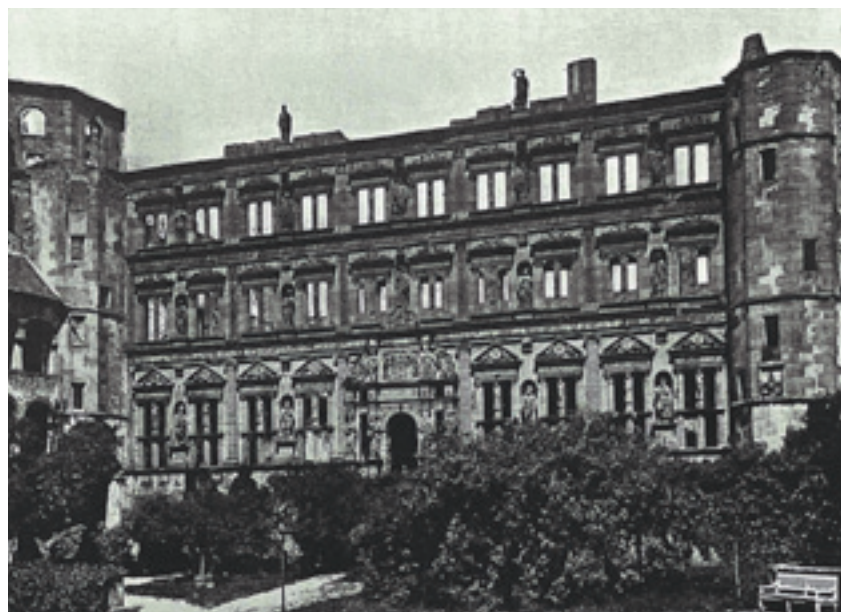
4 Das Heidelberger Schloss während des „Schlossstreits“, Postkarte um 1900.

Historisch betrachtet sind Heimatpflege und Denkmalschutz nämlich Kinder derselben Mutter mit dem Namen „Verlust“ oder – ins Positive gewendet – dem Wunsch nach Bewahren. Eine besondere Empfindlichkeit für Umgebungsqualität kannte bereits die Deutsche Romantik, die um die Mitte des 19. Jahrhunderts mit der Industriellen Revolution konfrontiert wurde. Die Heimatgesinnten bemühten sich seinerzeit bereits, den Verlust gewach-