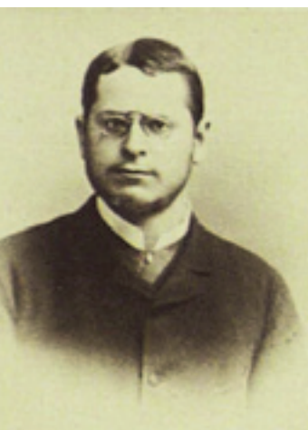
6 Alois Riegl an der Universität Wien, 1901.