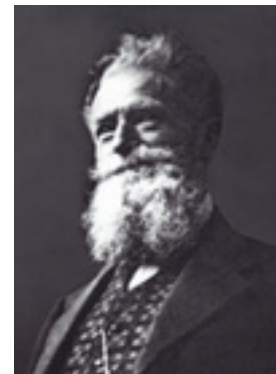
7 Darstellung eines vorbildlichen heimatischen Orts- und Landschaftsbilds, die nicht von ungefähr an das Heidelberger Schloss erinnert.