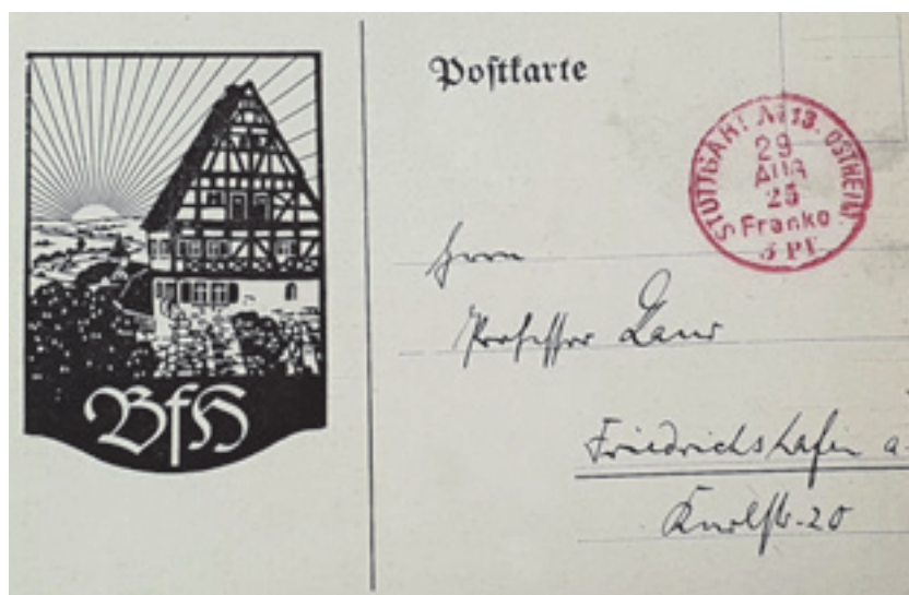
9 Logo des Bundes für Heimatschutz, ein vorbildliches heimatisches Orts- und Landschaftsbild, auf einer Postkarte an den hohenzollernschen Landeskonservator Wilhelm Friedrich Laur, um 1920.

Asal hatte Rechtswissenschaften in Leipzig, München und Freiburg studiert. Seit 1920 im Staatsdienst, durfte er durch seine Heidelberger Promotion zur Entwicklung der Denkmalschutzgesetz-