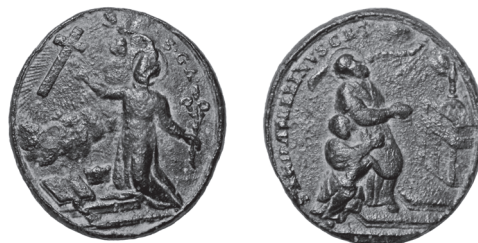
Abb. 17 Ölper FStNr. 6 und 7 und Watenbüttel FStNr. 6, Gde. Stadt Braunschweig, KfSt. Braunschweig (Kat.Nr. 15)

Medaille. Vorderseite: heiliger Kajetan von Thiene, Rückseite: heiliger Andreas Avellino. M. 1:1.