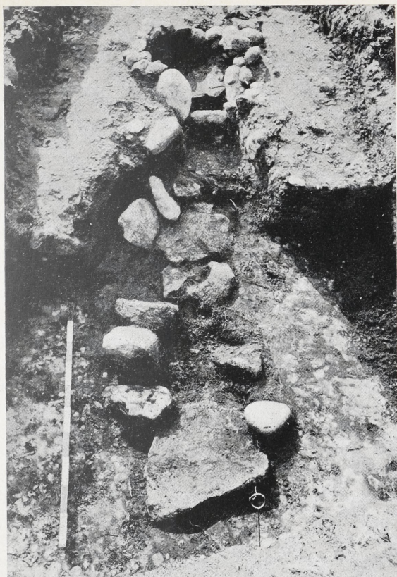
a. Buggehorn, Kr. Osterholz.

Vordergrund: Leichenbrandstreuung zwischen Steinsetzung.