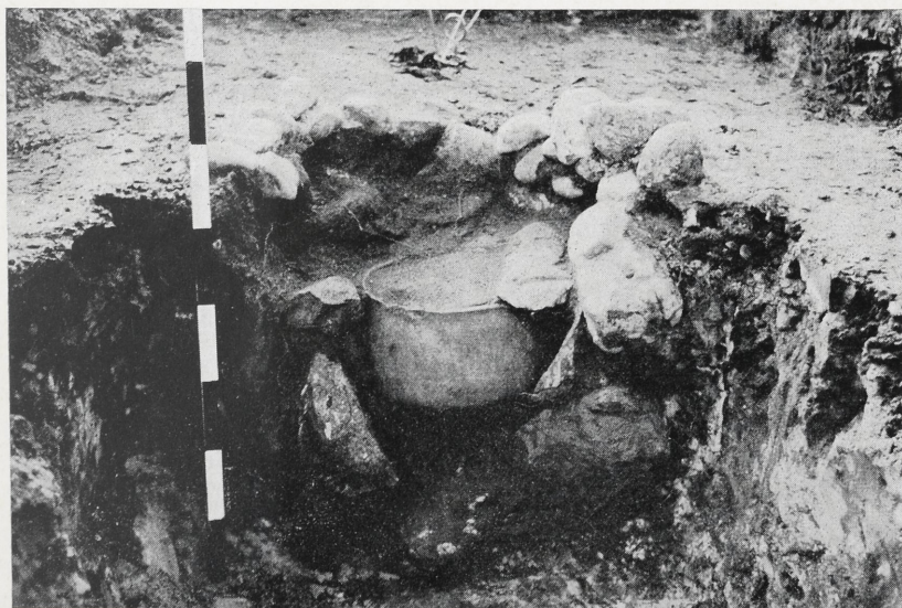
b. Buggehorn, Kr. Osterholz. Doppelkonische Urne in Steinkiste. (vgl. Abb. 1)

Hintergrund: Urnenbestattung in Steinkiste.