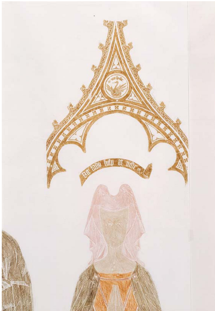
[Abb.: Storch im Baldachin-Okulus, Abrieb des Verfassers]

Fußinschrift, angeordnet in zwei Blöcken zu je sechs lateinischen Versen. Dazwischen erscheint wieder der Storch, diesmal auf einem Wollballen stehend, mit dem Leitspruch „ ✠ me spede “ in kleiner Schrift oberhalb des Vogels. Es gibt weder Namen noch Todesdaten, wahrscheinlich befanden diese sich auf dem verlorenen Randtext. (Maße über alles: 2216 x 1067 mm) 6