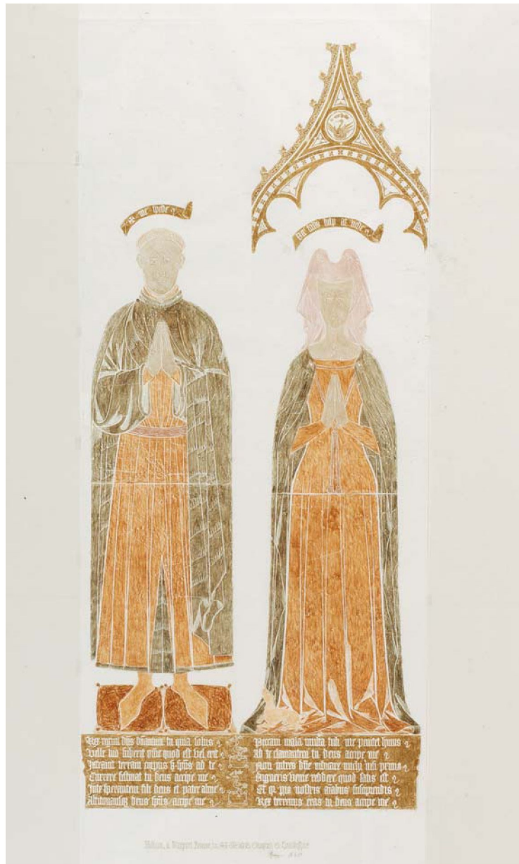
[Abb: Ganzbild, Abrieb Verfasser, ]