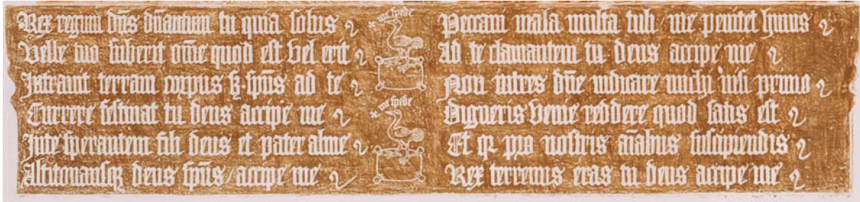
[Abb. der Fußinschrift, Abrieb Verfasser, Photo Margraf.]

,n', ,m', aber im Allgemeinen ist der Text lesbar, nur zwei Abkürzungen erfordern Nachdenken. Schlichte Schnörkel dienen als Zeilenbeendigung.