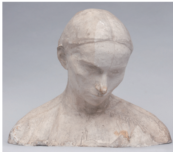
Il. 4. Xawery Dunikowski, Głowa kobiety (Popiersie kobiety) z cyklu Kobiety brzemiennie , 1906 r., odlew, gips, 37 × 46 × 29,5 cm; własność Muzeum Okręgowego w Tarnowie

Wacław Szymanowski w symboliczno-historycznych rzeźbach z Pochodu na Wawel ukazuje ową istotę twórczego zamyślenia (i spektakularne połączenie tych treści). Dzieła mają duży ładunek emocjonalny i cechują się ekspresją formy. Niedużych rozmiarów rzeźba króla Bolesława Śmiałego prezentuje i ucieleśnia siłę, potęgę średniowiecznego władcy, natomiast okazała Grupa humanistów – harmonię i idee renesansu widoczne zarówno w modzie, jak i postawie zamysłonych mężczyzn.