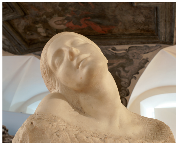
Il. 2. Henryk Hochman, Studium kobiety , 1903 r., rzeźbiona w białym marmurze, 35 × 44,5 × 27 cm; Muzeum Okręgowe w Rzeszowie, fot. ze zbiorów Muzeum Okręgowego w Rzeszowie – P. Nycz

Zajmującym, chociaż obecnie mało znanym twórcą tamtego czasu był Henryk Hochman (1879 lub 1881–1942) – polski rzeźbiarz żydowskiego pochodzenia, wykształcony na krakowskiej Akademii Sztuk Pięknych (jako uczeń Laszczki) i w Paryżu. Artysta tworzył przede wszystkim portrety. W jego Studium kobiety (z 1903 roku), wykonanym w białym marmurze, dostrzegamy niezwykle ujmującą twarz młodej damy (il. 2). Jej sugestywnie wygięta szyja, odchylona do tyłu głowa, ledwie zaznaczone ramiona, pełna nieomal ekstazy twarz (z zamkniętymi oczami) i rozchylone, zastygłe w półuśmiechu usta ukazują znajomość sztuki Auguste'a Rodina 8 .