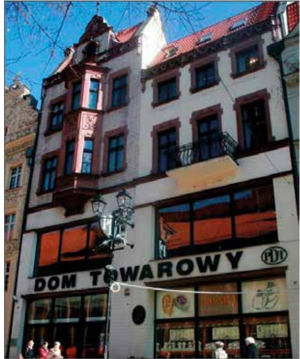
Il. 1. Kamienice przy Rynku Staromiejskim 36 i 37 w Toruniu. Obecnie Dom Towarowy, fot. J. Kucharzewska