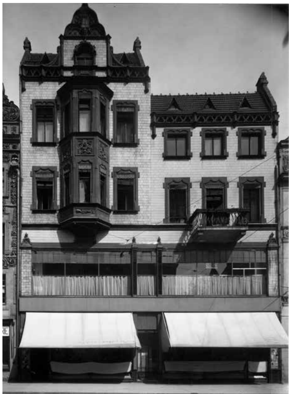
Il. 9. Ujednolicona fasada kamienicy na Rynku Staromiejskim nr 36 i 37. Fot. Kurt Grimm, 1940 r.; Muzeum Okręgowe w Toruniu, Zbiór fotografii, sygn. A 1371

nr 36 wprowadzono szerokie witryny (co skutkowało także koniecznością wyburzenia nieestetycznych i prowizorycznych zabudowań podwórka). W 1934 roku planowano przekryć szklanym dachem niewielkie wewnętrzne podwórko kamienicy nr 37 i zrobić tam ogólnodostępne patio. Niestety, ten nowatorski pomysł nie spotkał się z uznaniem urzędu miejskiego, który odrzucił projekt, powołując się na stosowne paragrafy prawa budowlanego i argumentując to w ten sposób: