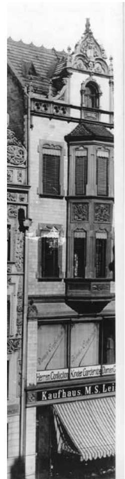
Il. 7. Fragment fotografii wykonanej przez A. Jakobiego około 1901 roku z widocznym domem towarowym M. S. Leisera; Książnica Miejska w Toruniu. Dział Zbiorów Specjalnych. Grafika, t. 4, nr 9