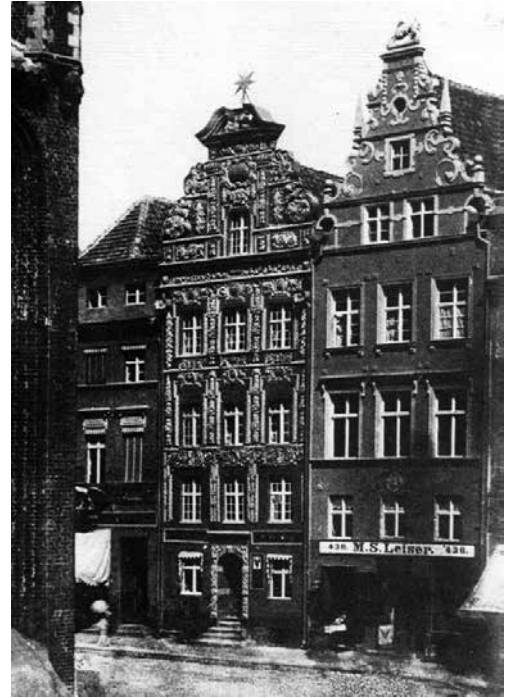
Il. 6. Fragment wschodniej pierzei Rynku Staromiejskiego z widoczną kamienicą Pod Gwiazdą i sąsiadującą z nią od południa kamienicą nr 36; Toruń, miasto i ludzie na dawnej fotografii , red. M. Biskup, Toruń 1999, s. 51