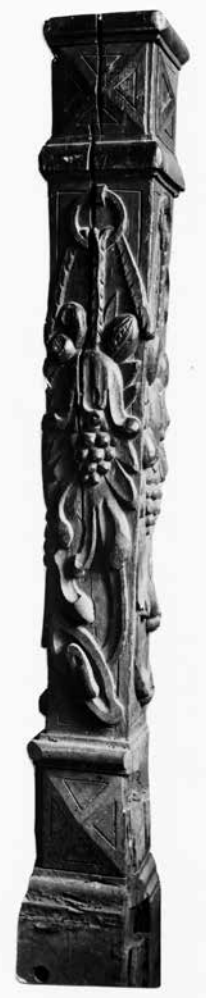
Il. 5. Słupek schodów z kamienicy nr 36. Obecnie w zbiorach Muzeum Okręgowego w Toruniu, Muzeum Okręgowego w Toruniu, Zbiór fotografii, sygn. A 386