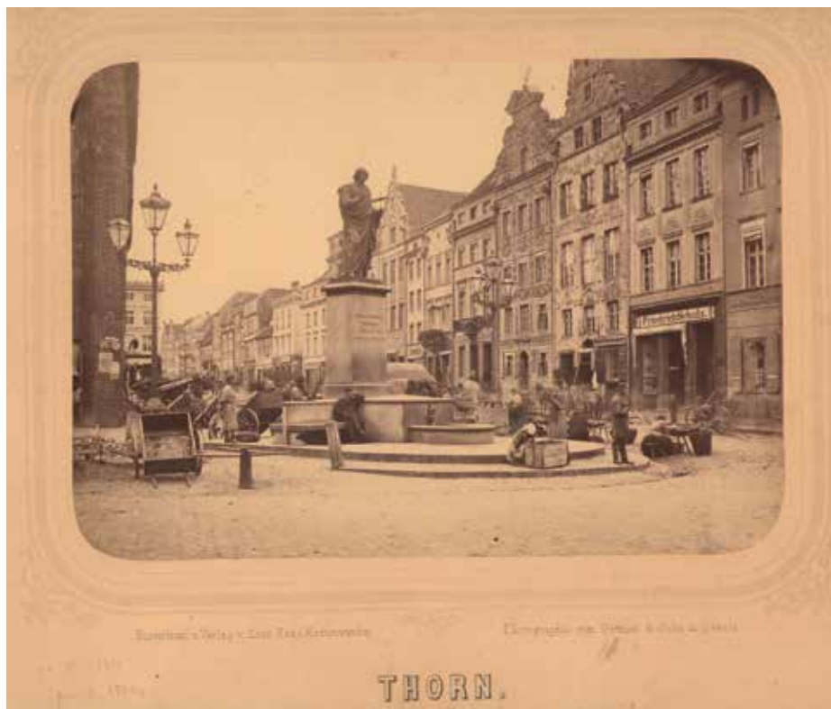
Il. 4. Widok wschodniej pierzei Rynku Staromiejskiego z kamienicami nr 36 i 37 (na fotografii po prawej stronie od kamienicy Pod Gwiazdą). Fotografia wykonana przez atelier von Gottheil i syn z Gdańska, między 1864 a 1870 rokiem, Muzeum Okręgowe w Toruniu, Zbiór fotografii, sygn. A 82

wprowadzono wiszącą izdebkę, może galeryjki w trakcie środkowym pięter.