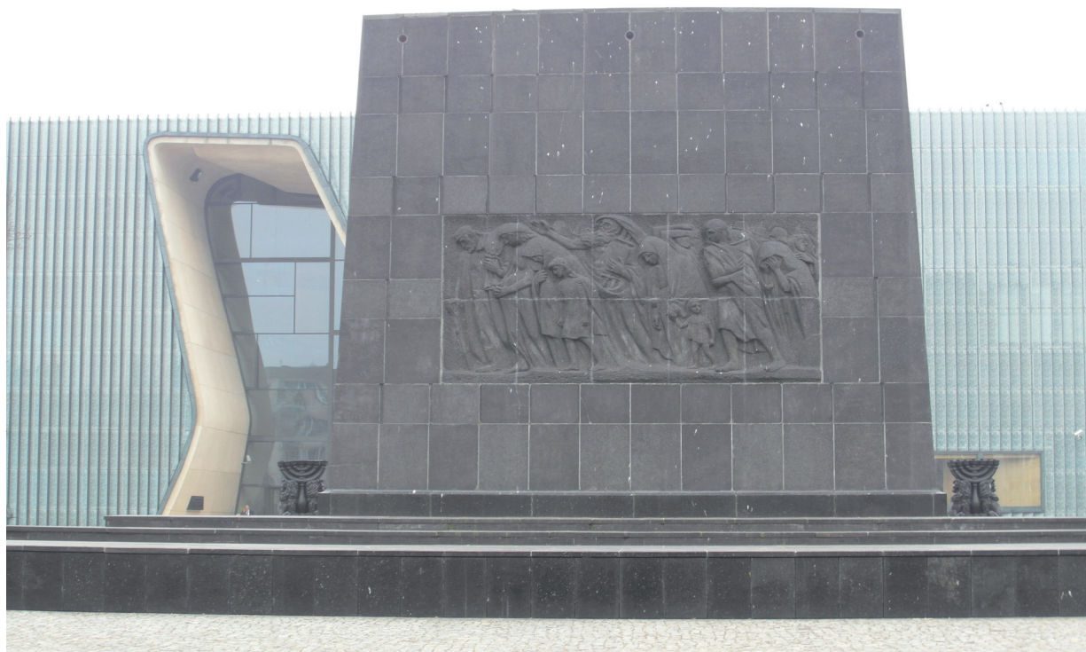
Il. 8. Natan Rapaport, relief Wygnanie , Pomnik Bohaterów Getta, Warszawa 1948, fot. M. Tarnowska (2015 r.)

Obchody V rocznicy powstania w getcie przypadły na czas przełomowy zarówno dla Polski, jak i dla Żydów na całym świecie. Dnia 14 maja 1948 r. decyzją Ligi Narodów/ONZ utworzono państwo Izrael. W Polsce nadchodzący stalinizm zlikwidował autonomię Żydów, zatrzymując proces odbudowy życia (ostatecznie w 1968 r.). We wrześniu 1949 r. uchwałą CKŻP zlikwidowano ŻTKSP, a utworzona przez nie Galeria Sztuki została włączona do Żydowskiego Instytutu Historycznego i stała się trzonem dzisiejszej kolekcji Muzeum ŻIH 147 . Ustały także badania nad kulturą i sztuką żydowską. Ich wznowienie nastąpiło dopiero w połowie lat 80. XX w. wraz z upadkiem komunizmu.