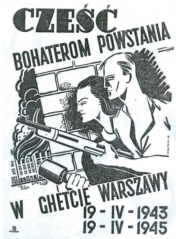
Il. 2. Plakat na II rocznicę powstania w getcie warszawskim, 1945, za: „Nasze Słowo”, 7–8 (19 IV 1948): 24

Pacanowskiemu za metaloplastyki przedstawiające Nachuma Bialika i Mendelę Mojcher Sforima. Wyróżnienie, w wysokości 3 tys. zł, otrzymał Izaak Rejzman za wizerunek Szaloma Asza 124 . W zbiorach ŻIH znajdują się nagrodzone portrety: Henryka Hechtkopfa, Szołema Alejchema, Szai Wajnsztoka, Szaloma Asza, Izaaka Rejzmana 125 (il. 2).