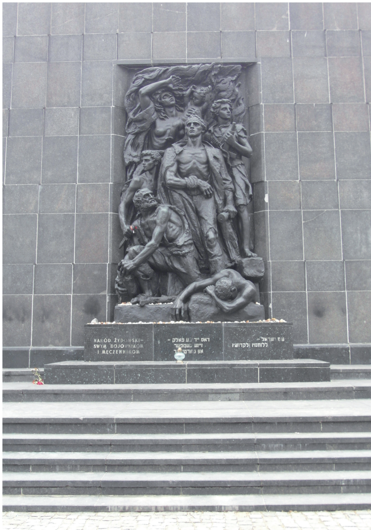
Il. 7. Natan Rapaport, Pomnik Bohaterów Getta, Warszawa 1948