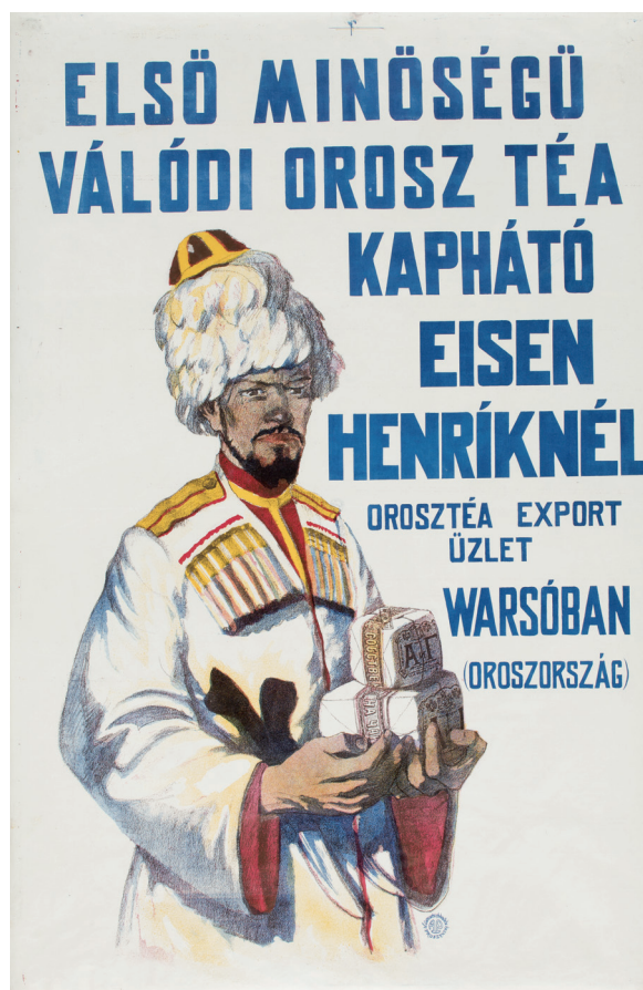
Il. 2. A. N., Zakład Litograficzny Aureliusza Pruszyńskiego w Krakowie, Prawdziwa herbata rosyjska pierwszej jakości [wersja w języku węgierskim], [ok. 1910 r.], litografia, papier, 95 × 62,3 cm; Muzeum Narodowe w Krakowie

Polskiej w Paryżu – pięć plakatów sprzed 1914 roku, w tym dwa komercyjne 5 . Bogate kolekcje mają muzea poza granicami Polski. Muzeum Etnografii i Przemysłu Artystycznego we Lwowie ma osiemdziesiąt osiem plakatów z przełomu wieków, w tym aż pięćdziesiąt plakatów komercyjnych, w większości związanych ze Lwowem 6 . Największe zbiory gromadzi Muzeum Puszkina w Moskwie. Ta znakomita kolekcja, darowana przez Pawła Ettingera, liczy sto dwadzieścia siedem plakatów z okresu do 1914 roku, w tym osiemdziesiąt dziewięć plakatów komercyjnych 7 .