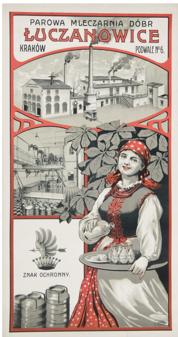
Il. 3. A. N., Litografia K. Kranikowskiego w Krakowie, Parowa Mleczarnia Dóbr Łuczanowice , [po 1905 r.], litografia, papier, 86 × 46 cm; Muzeum Narodowe w Krakowie

Plakaty z przełomu wieków pochodzące z MNK były wystawiane kilkakrotnie na przeglądowych wystawach: „Od Młodej Polski do naszych dni” w Warszawie w 1966 roku, „Polska secesyjna grafika i plakat” w 1979 roku w Pradze, na krakowskiej wystawie „100 lat polskiej sztuki plakatu” w BWA w 1993 roku oraz na wystawie „Art Nouveau. Les affiches de Cracovie” w Mons w Belgii w ramach festiwalu Europalia 2001. Ta ostatnia wystawa była prezentowana w Centrum Kultury „Zamek” w Poznaniu w 2003 roku i w tym samym roku w galerii na Zamku Książąt Pomorskich w Szczecinie. W 2005 roku plakaty z tego okresu zostały pokazane w najszerszym dotąd wyborze na wystawie Fin de siècle w Krakowie 8 w MNK.