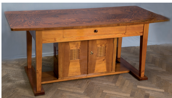
Il. 4. Stół z szafką z kompletu mebli wystawowych, Kraków 2012; Fundacja Muzeum Wojciecha Weissa, Kraków