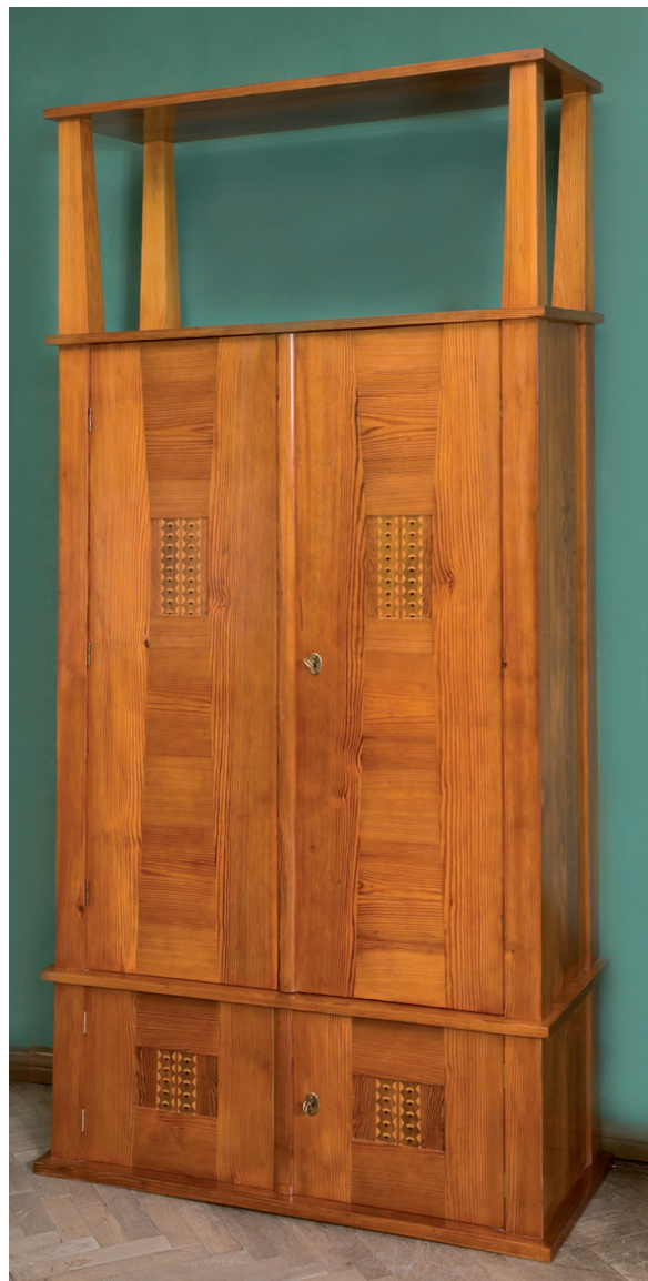
Il. 5. Szafa z kompletu mebli wystawowych, Kraków 2012; Fundacja Muzeum Wojciecha Weissa, Kraków, fot. Archiwum Fundacji MWW

my szafy, szafek i oparcia krzesła zdobi delikatny geometryczny ornament o genezie ludowej. Szczególny wyraz uzyskuje mała szafka i stół z szafką dwudrzwiową – w swojej zwartej formie niemalże prekursorskie w stosunku do mebli lat 20.