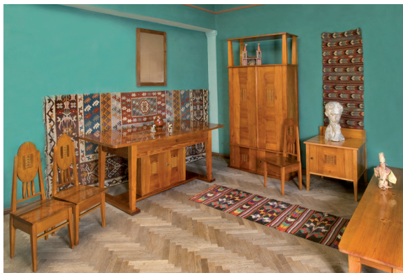
Il. 3. Rekonstrukcja wnętrza pokoju dziecięcego w stulecie wystawy, Kraków 2012; Fundacja Muzeum Wojciecha Weissa, Kraków, fot. Archiwum Fundacji MWW