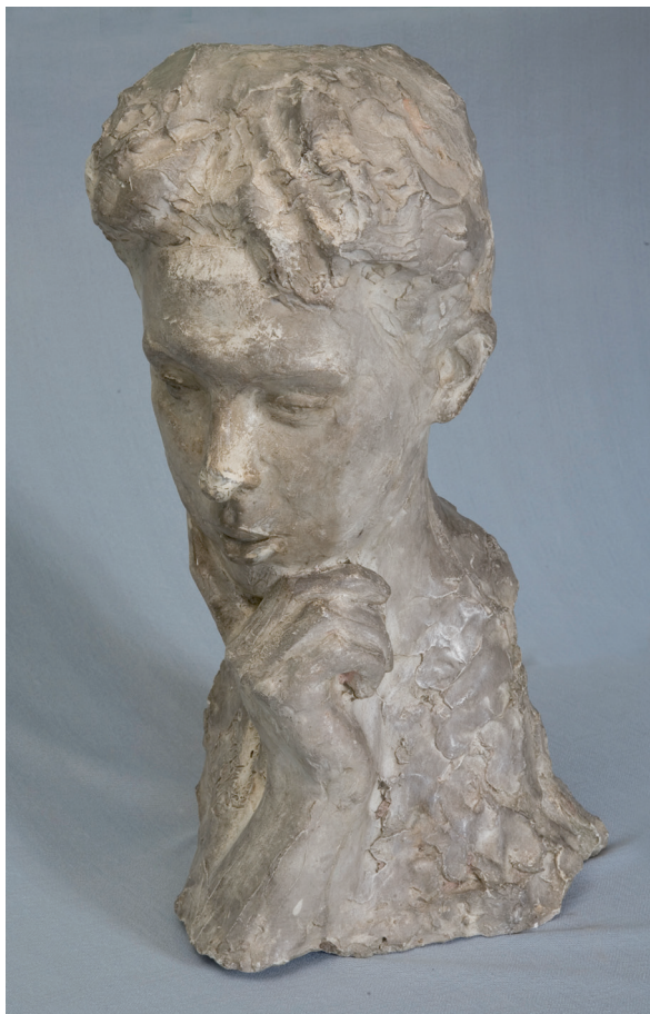
Il. 1. Henryk Hochman, popiersie Józefa Sperlinga, 1905 r.; Fundacja Muzeum Wojciecha Weissa, Kraków, fot. Archiwum Fundacji MWW

dzających. „Na pierwszym planie tej części wystawy widzimy przede wszystkim ów dworek podmiejski dla zamożnej rodziny. W głębi pięknie założonego i obszernego ogrodu widnieje jego biały fronton z gankiem, wspartym na białych kolumnach. Z ganku wejście do przedpokoju, stąd do dużej hali, która zarazem służyć może za salon. Po obu stronach hali pokoje pana, pani, sypialnia, jadalnia, pokój kredensowy itp. Na piętrze dworku pokoje dla dzieci i ich wychowawców, tudzież duża sala, pomyślana jako pracownia pana domu [...]. Projektował cały budynek p. J. Czajkowski. Na dekorację zaś wewnętrzną i umeblowanie złożyły się projekty artystów: Bukowskiego, Bartłomiejczyka z Warszawy, Czajkowskiego, Frycza, Małkowskiego, Tichy'ego, Trojanowskiego i Uziembły 12 .