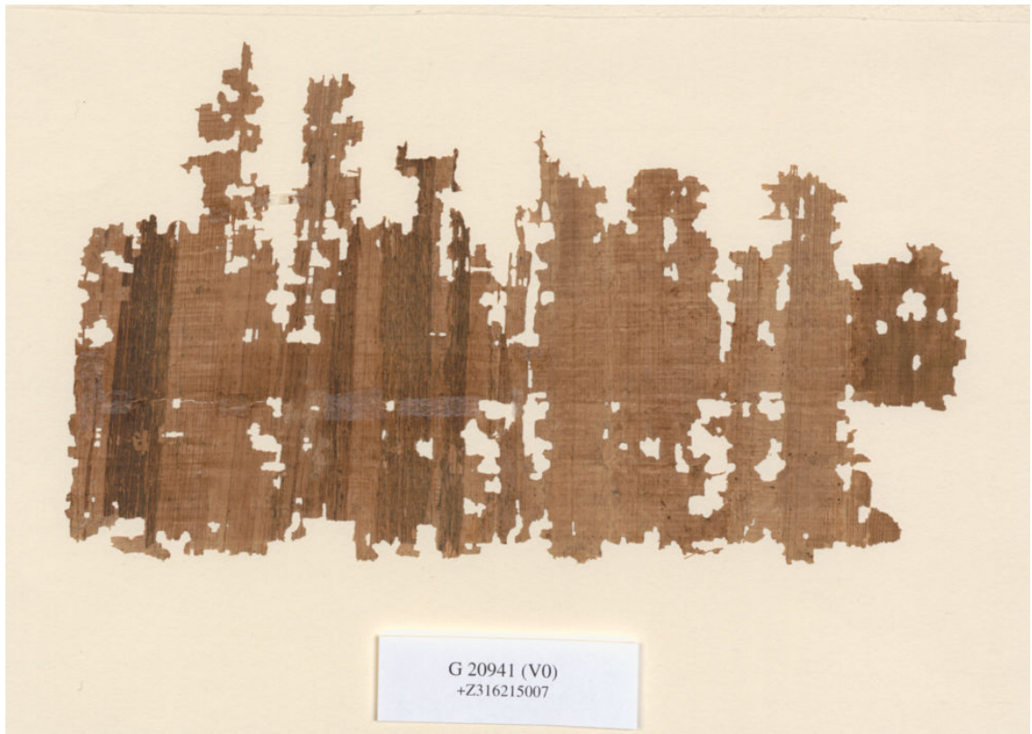
Fig. 1: P.Vindob. G 20941 verso.