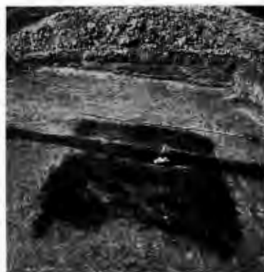
Derselbe Hüttenboden von Südwesten gesehen.