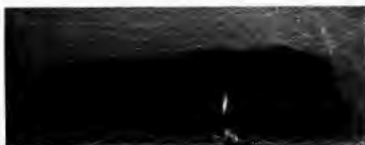
Der Schnitt durch den Hüttenboden zeigt die scharfe Begrenzung an der rechten (Ost-)Seite und nach unten.