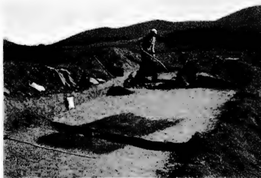
Die Fundstelle Moravany-Žarkovska mit dem alt- steinzeitlichen Hüttenboden von Westen. Im Hinter- grund die Inovecberge.