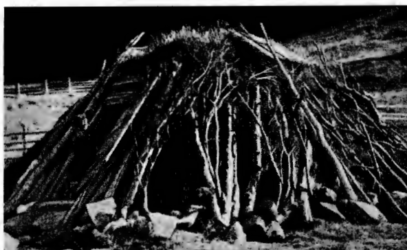
Kote der Karesuandolappen (Nach Bernatzik.)