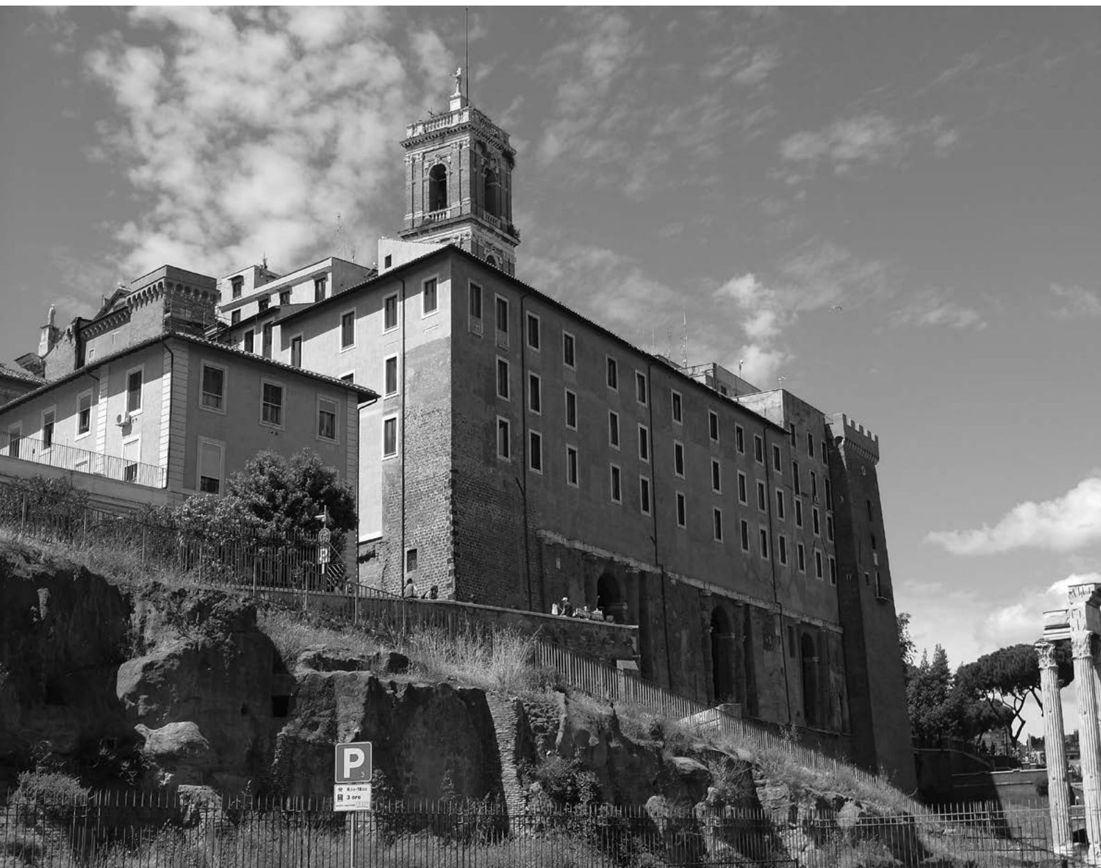
15. Wieże wbudowane w Pałac Kapitoliański, Rzym.