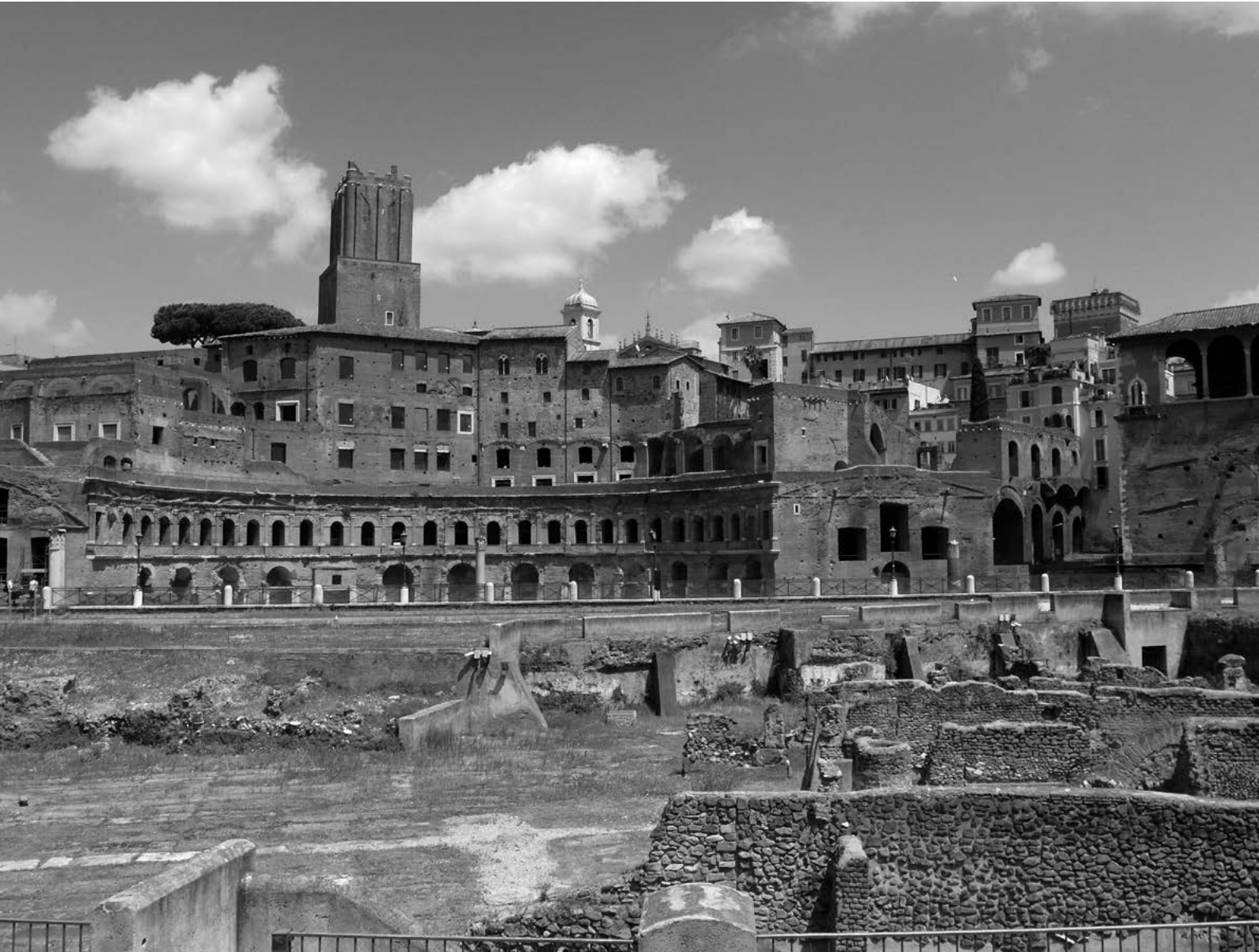
8. Torre delle Milizie, Rzym.