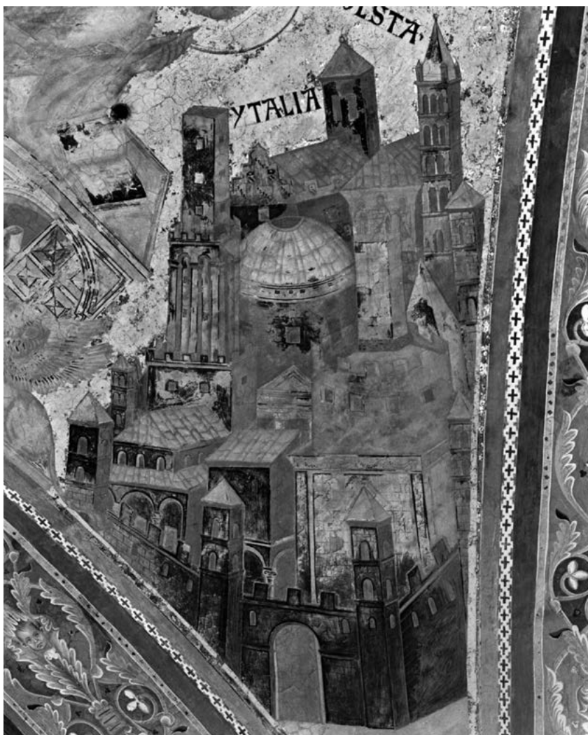
4. Fragment fresku Italia Cimabuego, z widokiem Torre delle Milizie, przełom XIII i XIV wieku.

cję: dążenie do pozostawienia wież – znaków ich dawnej dominacji. Tworzona pod różnymi nazwami società della torre gwarantowała nie tylko utrzymanie dawnych rodzinnych więzów, ale również środki na wznoszenie kompleksów wieżowych. Wieże odzwierciedlały opowywanie – przez poszczególne rody – obszarów miast, choć obszary te zmieniały się, a ich granice były czasem zgodne z podziałem terenu ośrodka między familie sprzyjające konkurującym ze sobą propapieskim gwelfom lub procesarskim gibelinom.