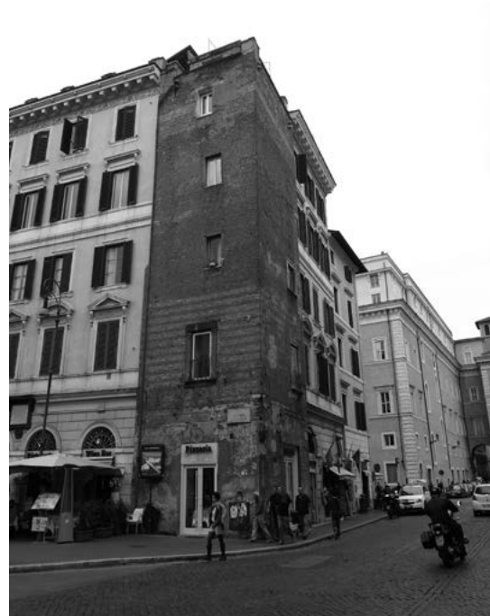
14. Wieża przy Via Giuseppe Zanardelli 21, Rzym.