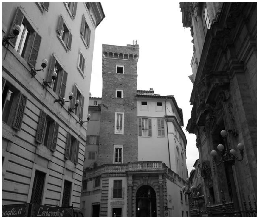
12. Torre della Scimmia, Rzym.