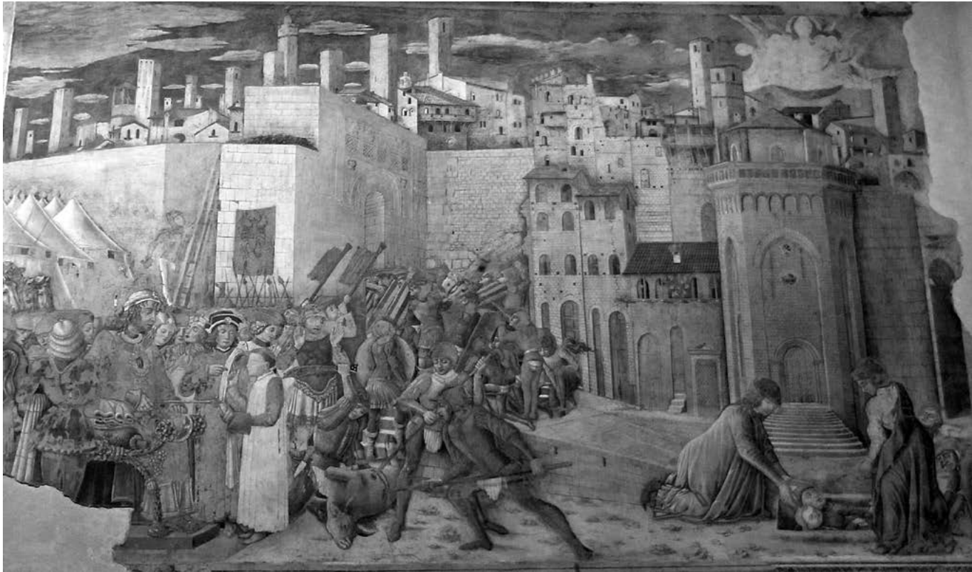
5. Benedetto Bonfigli, fresk w Palazzo Publico w Perugii.