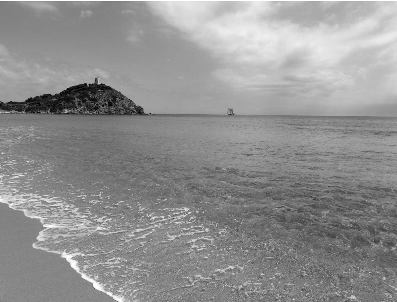
2. Wieża w Baia di Chia na południowo-zachodnim wybrzeżu Sardynii.