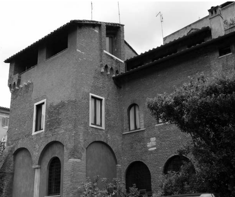
13. Dom wieżowy przy Via delli Mercanti, Zatybrze, Rzym.