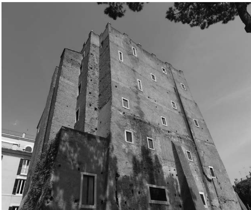
9. Torre dei Conti, Rzym.

przeszła w ręce ludu rzymskiego, a lud przekazał ją ponownie rodowi Collonnów. W 1329 należała do Paola Contiego, a potem do Napoleona Orsiniego.