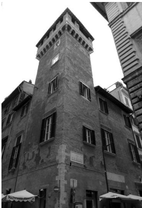
11. Torre Millina, Rzym.