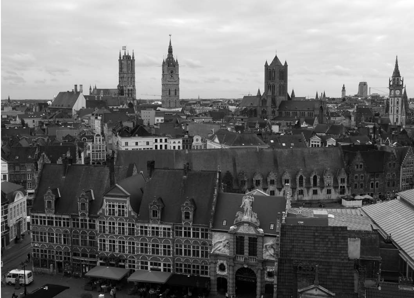
1. Panorama Gandawy z zamku Hrabów Flandrii.

Quart 2021, 3 PL ISSN 1896-4133 [s. 3-25]