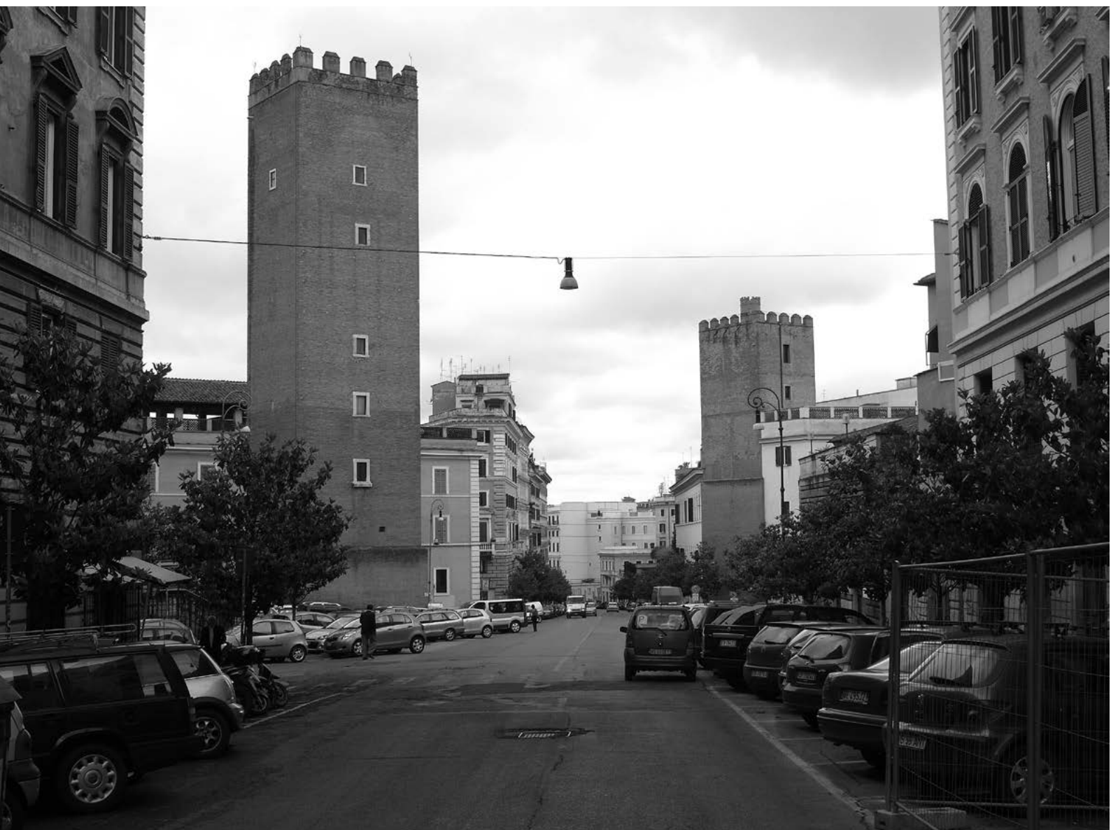
— 10. Torre dei Ceroni, Rzym.