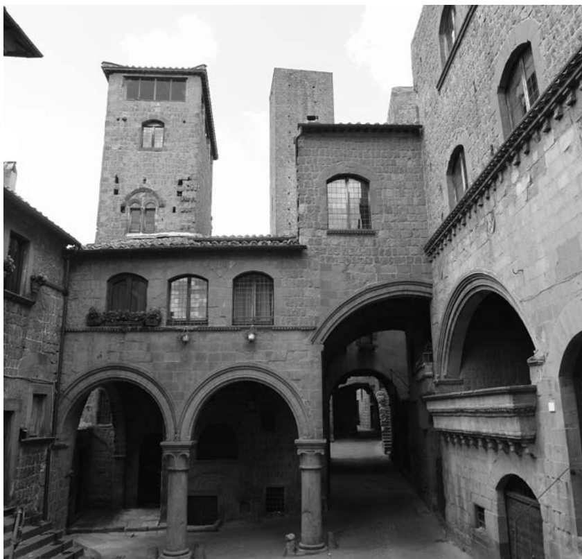
6. Piazza san Pellegrino, Viterbo.