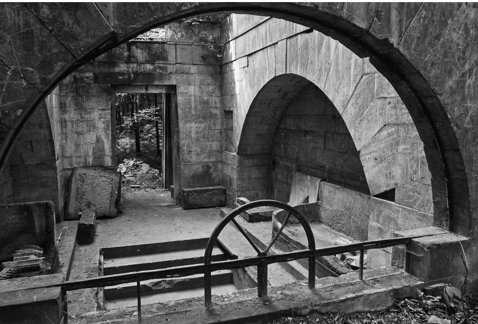
— 3. Wnętrze mauzoleum od strony wschodniej, 1984.