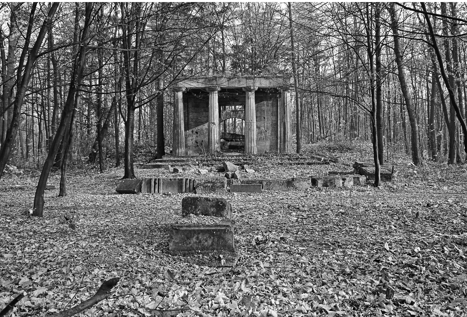
2. Widok mauzoleum od strony zachodniej, 1982.