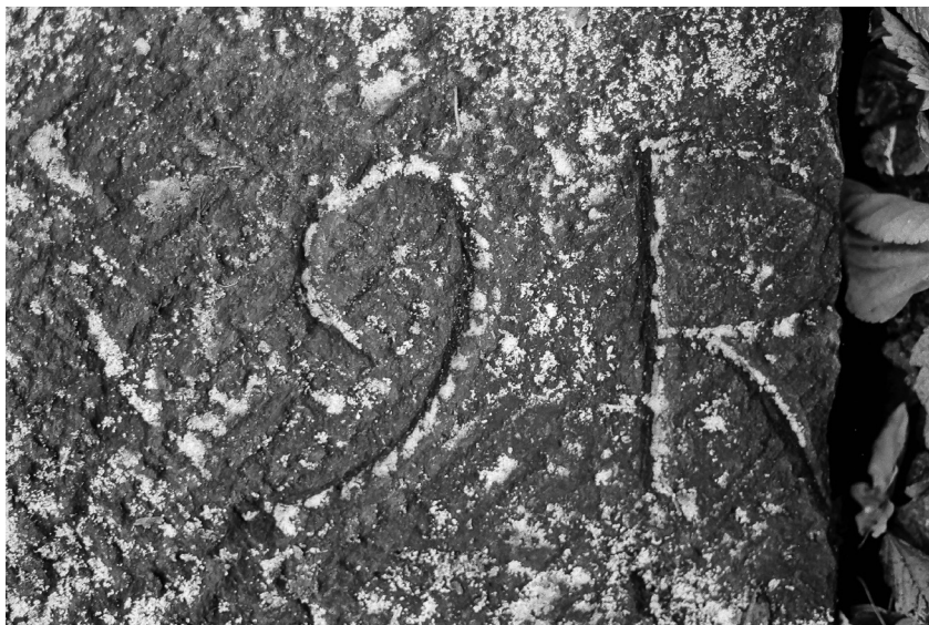
5. Oznakowanie położenia ciosów w ścianach mauzoleum, 1984.

ryckie kolumny portyku, pozbawione nie tylko baz, ale także entazis. Również wewnątrz budowli można, jak się wydaje, interpretować w kategoriach nowych zasad kompozycji architektonicznej, stworzonych we Francji w opozycji do nowożytnego systemu architektonicznego. Głównym motywem integrującym prostokątne wnętrze mauzoleum jest trzykrotnie powtórzony łuk odcinkowy, tworzący w ścianach bocznych dwie wnęki na sarkofagi, a w ścianie wschodniej – jedyne okno oświetlające mroczne wnętrze [fig. 6].