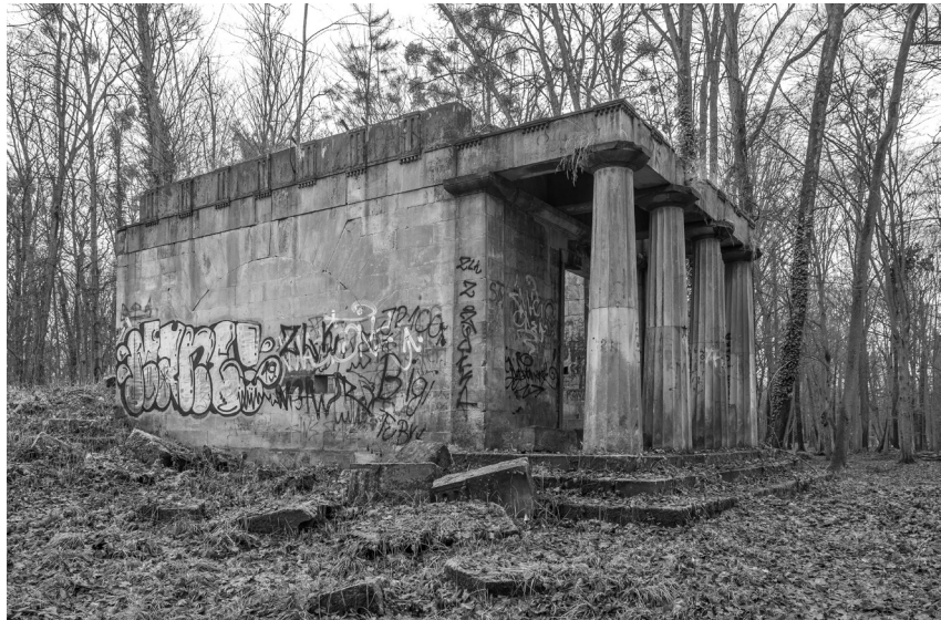
4. Widok mauzoleum od strony północno-zachodniej, 2022.

był jego nauczyciel, a prywatnie szwagier, Heinrich Gentz (1766–1811), pochodzący z Wrocławia, będący najlepszym w Berlinie tego czasu znawcą architektury greckiej i rzymskiej, które poznał podczas swego wieloletniego pobytu w Rzymie i na Sycylii w latach 1790–1795.