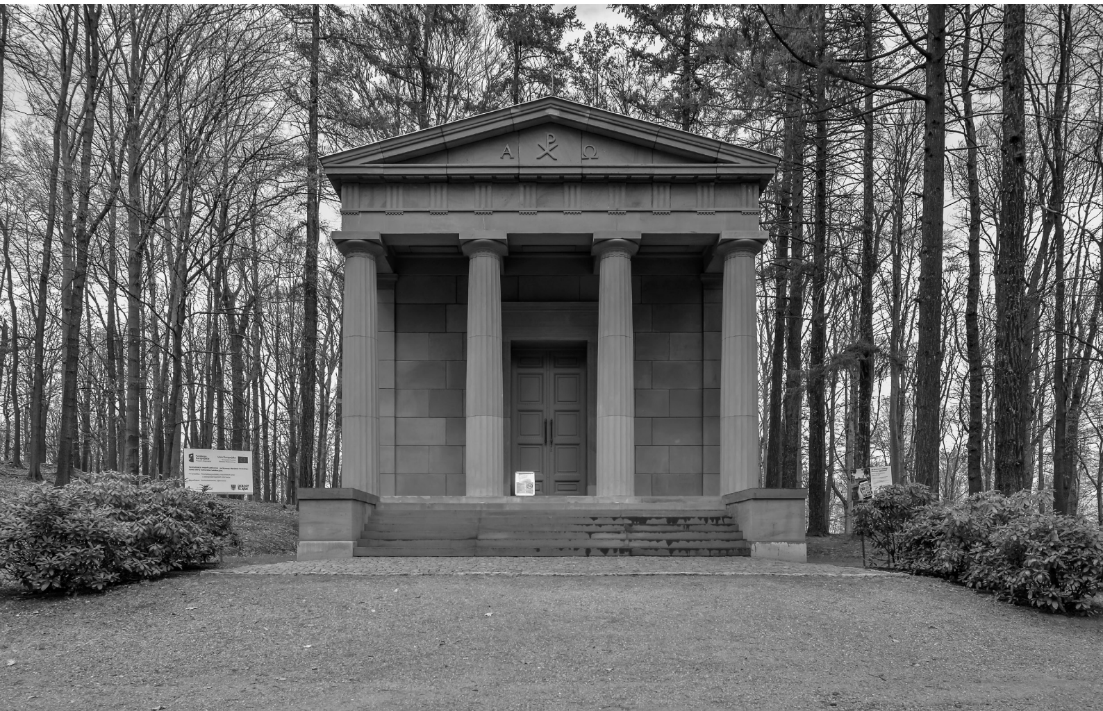
8. Mauzoleum Hohenzollernów, ok. 1890 (?); Kamieniec Ząbkowicki. Fot. J. K. Kos, 2022