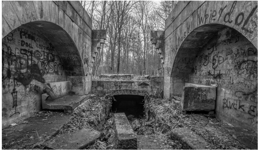
6. Widok wnętrza mauzoleum, 2022.

oraz trwającego już od wielu dekad oddziaływania wilgoci i mrozu na ruinę dzieła Gilly'ego nadal istnieje.