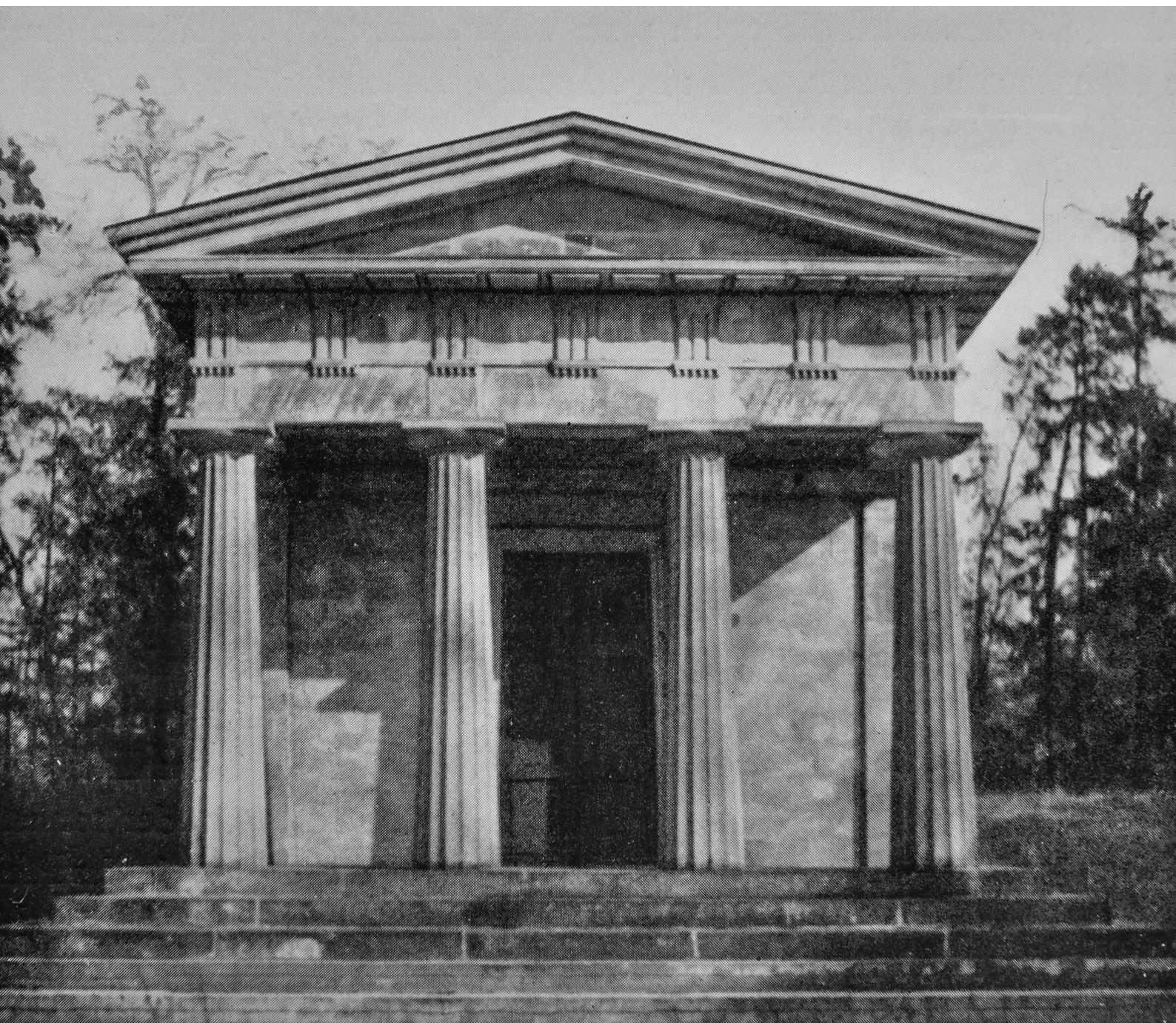
1. Mauzoleum Hoymów, przed 1931. Fot. za: F. Landsberger, Die Kunst der Goethezeit , Leipzig 1931, s. 190