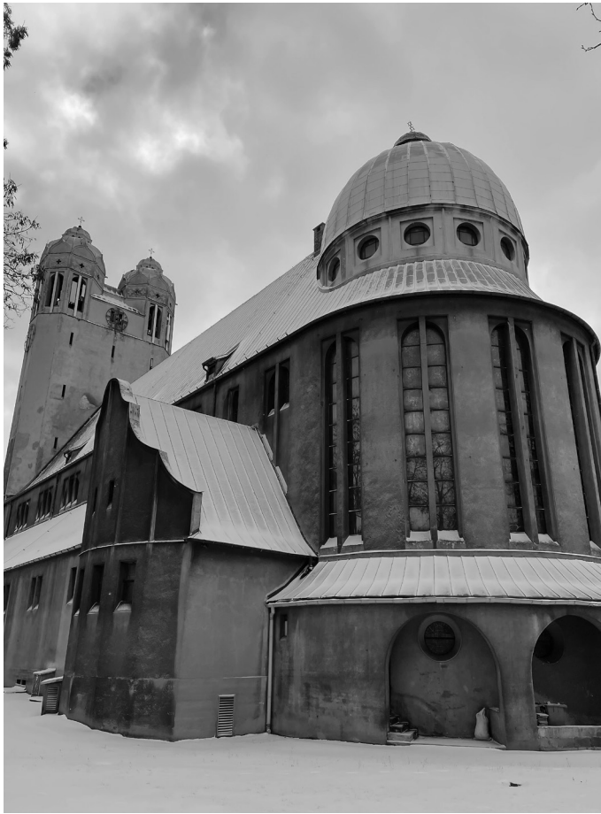
5. Arthur Kickton, kościół św. Barbary w Bytomiu, prezbiterium i północna elewacja, 1928–1930.