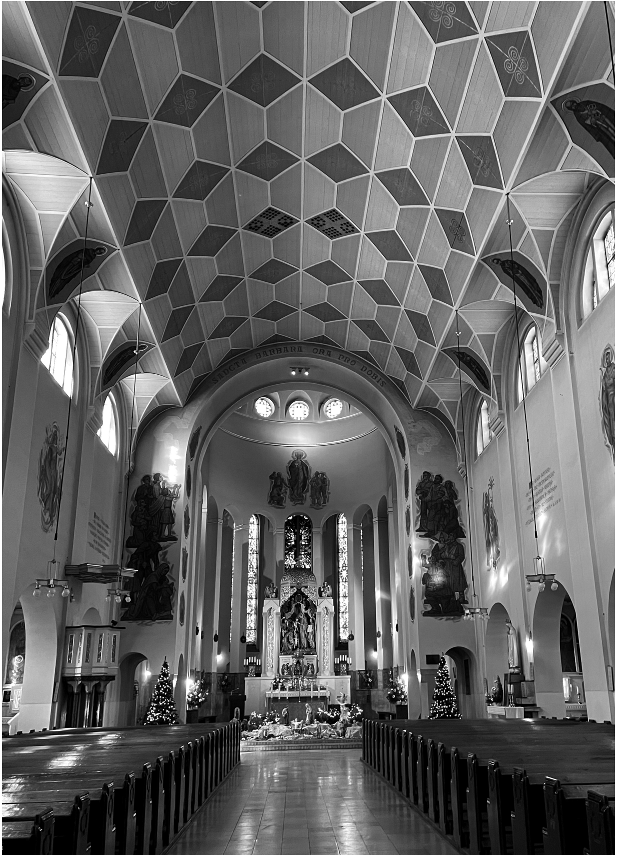
9. Wnętrze kościoła św. Barbary w Bytomiu, stan obecny.