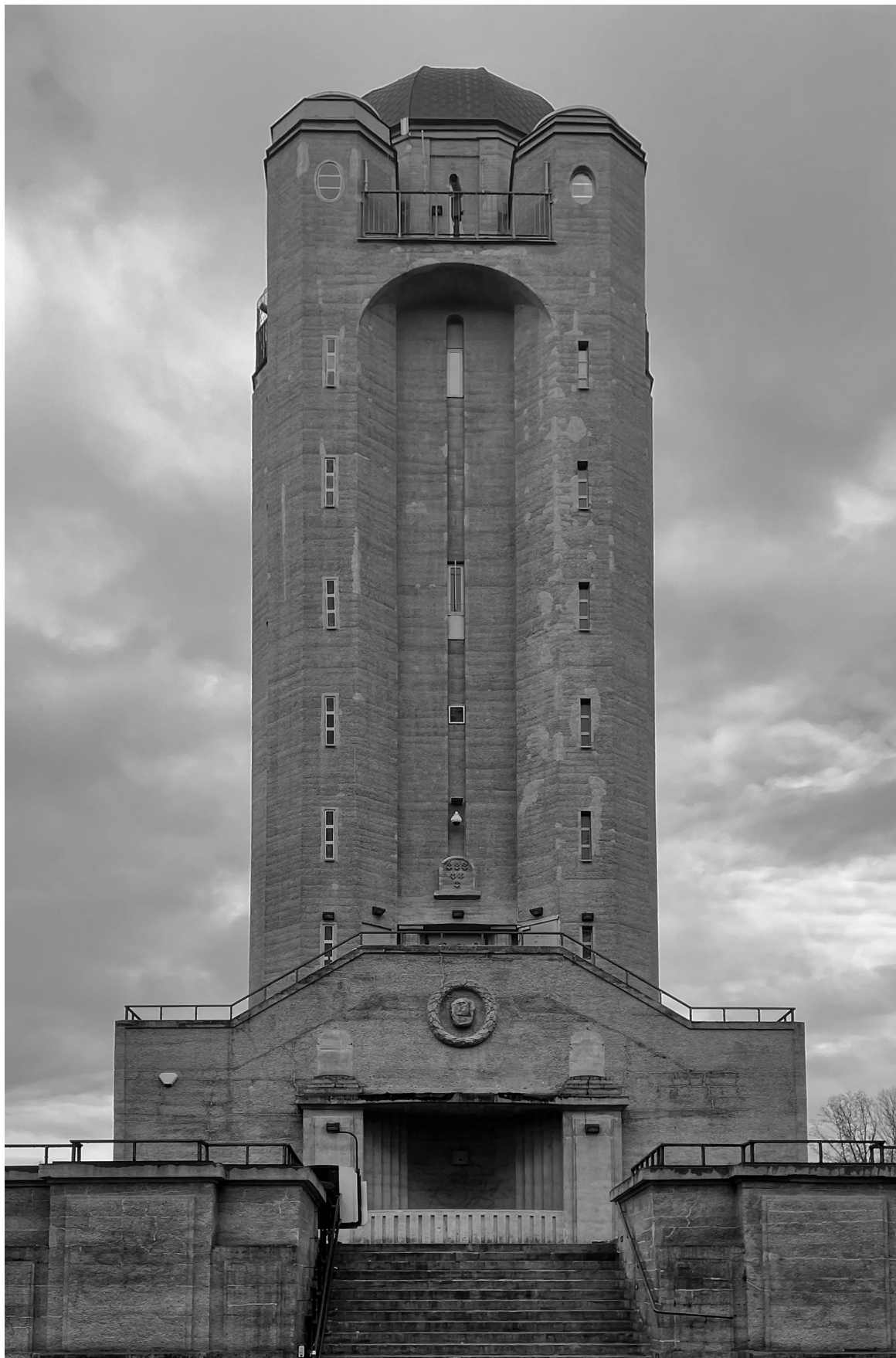
8. Arthur Kickton (?), Wieża Bismarcka w Nysie, 1907.