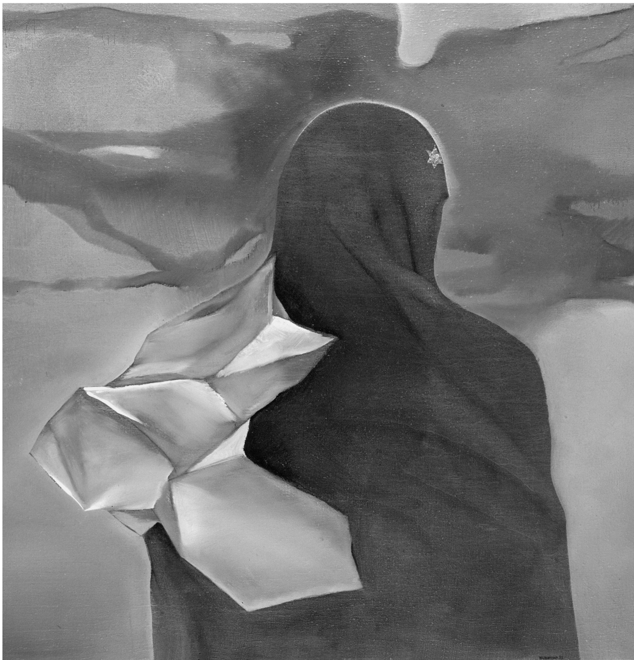
— il. 6 M. Wróblewska, Zwiastowanie IV , 1983, ol. pł., 100 × 100, własność prywatna.