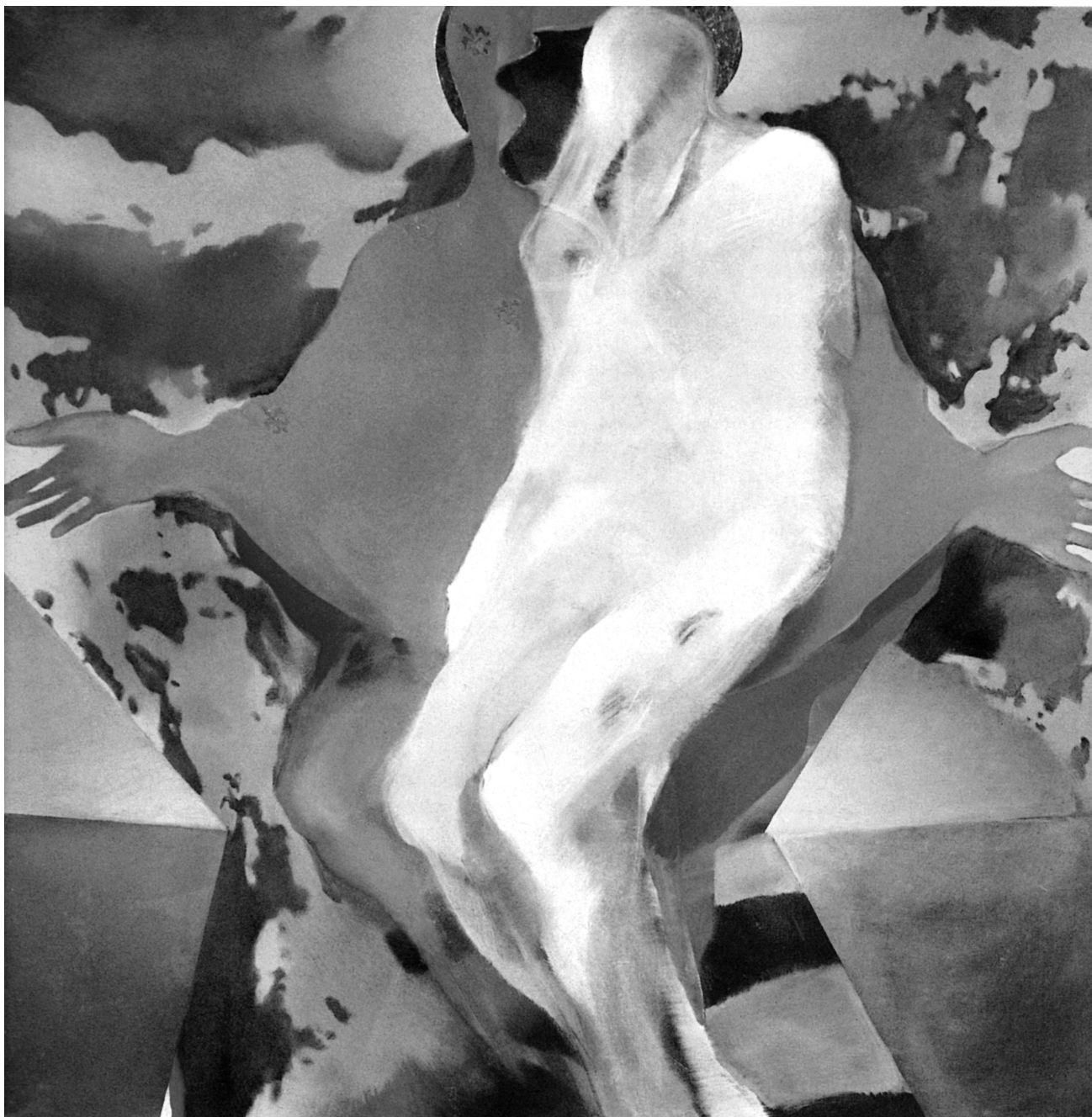
— il. 3 M. Wróblewska, Pietà , 1981, Muzeum Archidiecezjalne w Warszawie.