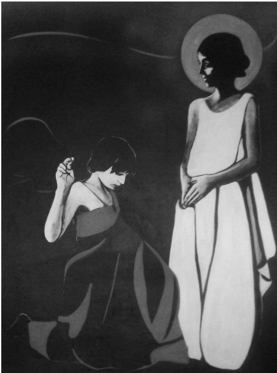
— il. 5 A. Fałat, Zwiastowanie , 1983, 100 × 150 (?), parafia św. Katarzyny w Warszawie.