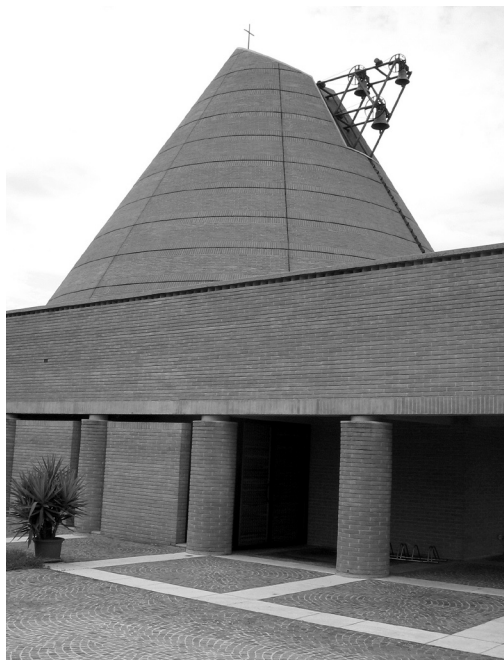
il. 11 Mario Botta, Kościół Błogosławionego Odoryka, Pordenone, 1987–1992, Włochy