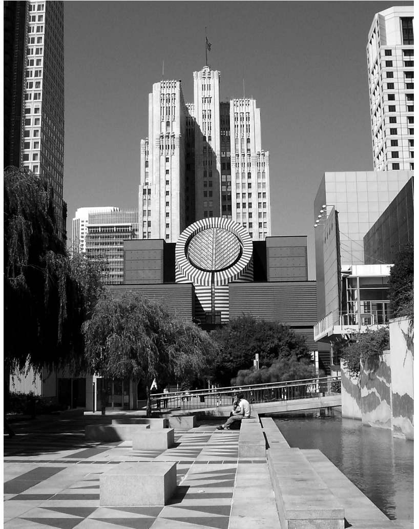
il. 8 Mario Botta, Muzeum Sztuki Nowoczesnej, San Francisco, 1989–1995, fot. Christopher Beland, http://upload.wikimedia.org/wikipedia/commons/b/bf/Yerba-Buena-Gardens-MOMA.jpg

Lipy zasadzone na dachu mają – zdaniem innego autora – symbolizować koronę cierniową Chrystusa, znacznie słuszniej jednak należy widzieć w nich odcień pewnego podejścia panteistycznego, które uniwersalizuje przesłanie katedry i czyni z niej swego rodzaju panteon. Próby „rekatolicyzacji” katedry wyhamowywane są przez jej wykorzystywanie do bardzo różnych celów. Część z nich ma charakter czysto świecki, jak na przykład koncerty muzyczne. Budowla przejawia przy tym niezliczone walory dobrej sali koncertowej. Inna część mieszkańców użytkuje katedrę w celach religijnych, lecz w ogóle niezwiązanych z katolicyzmem. Do tych należą między innymi kobiety ubrane w sari , które biją pokłony przed posągiem Marii z Dzieciątkiem pojmowanej jako bogini prokreacyjnego sukcesu, natomiast kupki grochu, fasoli czy