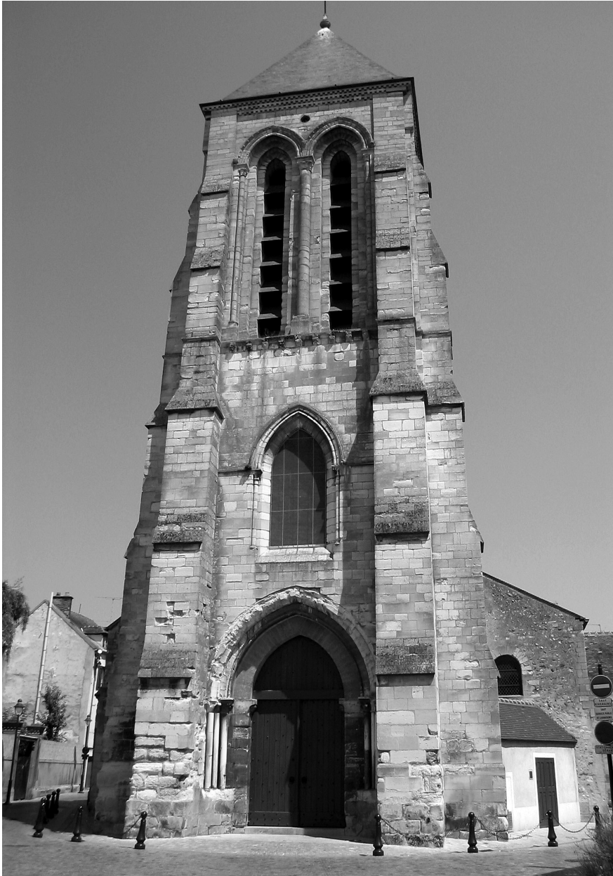
il. 2 Katedra Saint Spire, Corbeil

Wcześniej niż gdziekolwiek indziej plan budowy katedry pojawił się wśród urzędników zarządzających rozwojem Évry. To w tym środowisku podniosły się głosy, że sposobem na zwiększenie komfortu zamieszkiwania w Évry jest utworzenie w nim jednoznacznego centrum, w którym znalazłyby swe miejsce kościół katedralny i ratusz. Urbanistom zależało przede wszystkim na ponownym zhierarchizowaniu przestrzeni miejskiej i to w oparciu o takie elementy, które umożliwiłyby integrację wieloetnicznej społeczności. Przez budowę katedry chciano miastu przywrócić pamięć o wartościach, które tradycyjnie towarzyszyły kreowaniu jednolitych społeczności. Nie zapominano jednak przede wszystkim o luksusie zamieszkiwania miasta posiadającego wyraziste