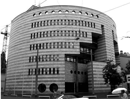
il. 7 Mario Botta, Budynek Union Bank of Switzerland (UBS), obecnie Bank für Internationalen Zahlungsausgleich (BIZ), Bazylea, Szwajcaria, 1986–1995, fot. Julian Mendez, http://upload.wikimedia.org/wikipedia/commons/c/cb/Basel_BIS_building_by_Mario_Botta_20070723.jpg