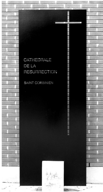
il. 5 Wejście do katedry w Évry, tablica z napisem: Cathédrale de la Résurrection, Saint Corbinien