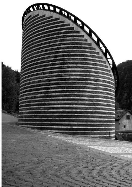
il. 9 Mario Botta, Kościół w Mogno, 1986–1989, Ticino, Szwajcaria