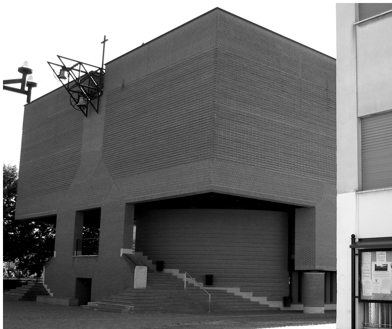
il. 12 Mario Botta, Kościół św. Piotra Apostoła, Sartirana di Merate, 1987–1995, Włochy, fot. Wioleta Bakinowska

określenia różnic, są jednak zbliżone, ponieważ cechy obronne można również dostrzec w kaplicy Ronchamp, która jak mała forteca umieszczona została na strategicznie ważnym wzgórzu i w klasztorze La Tourette o cechach warownego romańskiego klasztoru. Wysokie ściany katedry w Évry, w których Mollard znalazł podobieństwo z wyglądem murów miejskich średniowiecznych miast, wraz z silnie odizolowanym od zewnątrz sanktuarium kreują ten – pochodzący zarówno od Le Corbusiera, jak i z dzieł średniowiecza – „obronny” charakter katedry. Mollard uznał te wartości za odpowiednie dla obecnej sytuacji, gdy Kościół jako instytucja umacniał się na pozycjach defensywnych 20 . Wydaje się jednak, że z punktu widzenia jego urzędniczych kompetencji olbrzymie znaczenie miała także możliwość wzbogacenia kulturowego wyposażenia miasta w dzieło światowej sławy architekta. Nie jest zatem przypadkiem, że najliczniejszymi użytkownikami katedry i gorliwymi wyznawcami jej wartości są turyści, dla których atrakcją jest dzisiaj nie jedynie zwiedzanie zabytków, lecz także obiektów wzniesionych przez modnych architektów.