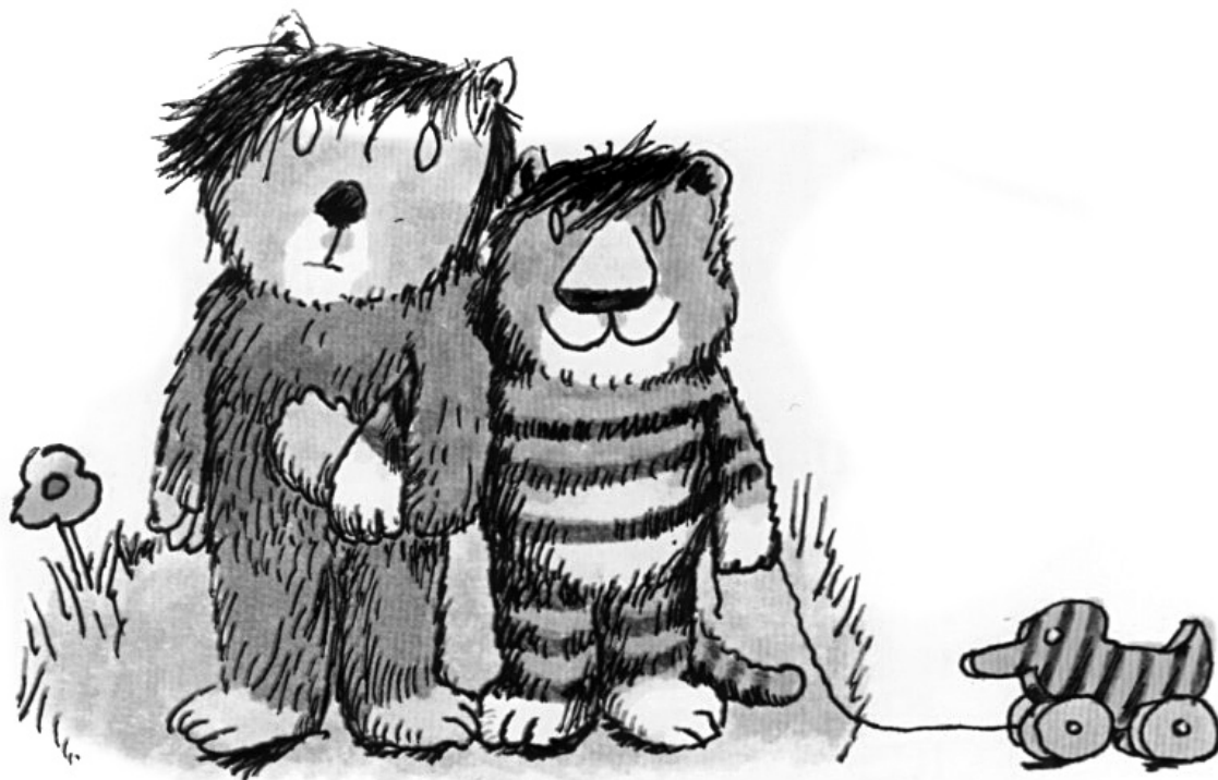
il. 4 Janosch, ilustracja do Ach, jak cudowna jest Panama , Kraków, Wyd. Znak, 2009