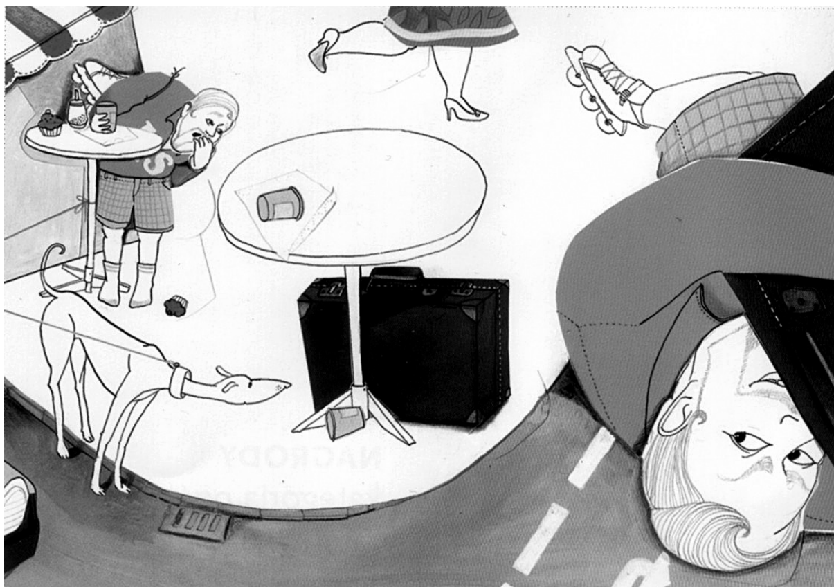
il. 1 Julia Kotulla. ilustracja do Alles wegen Blasmusik