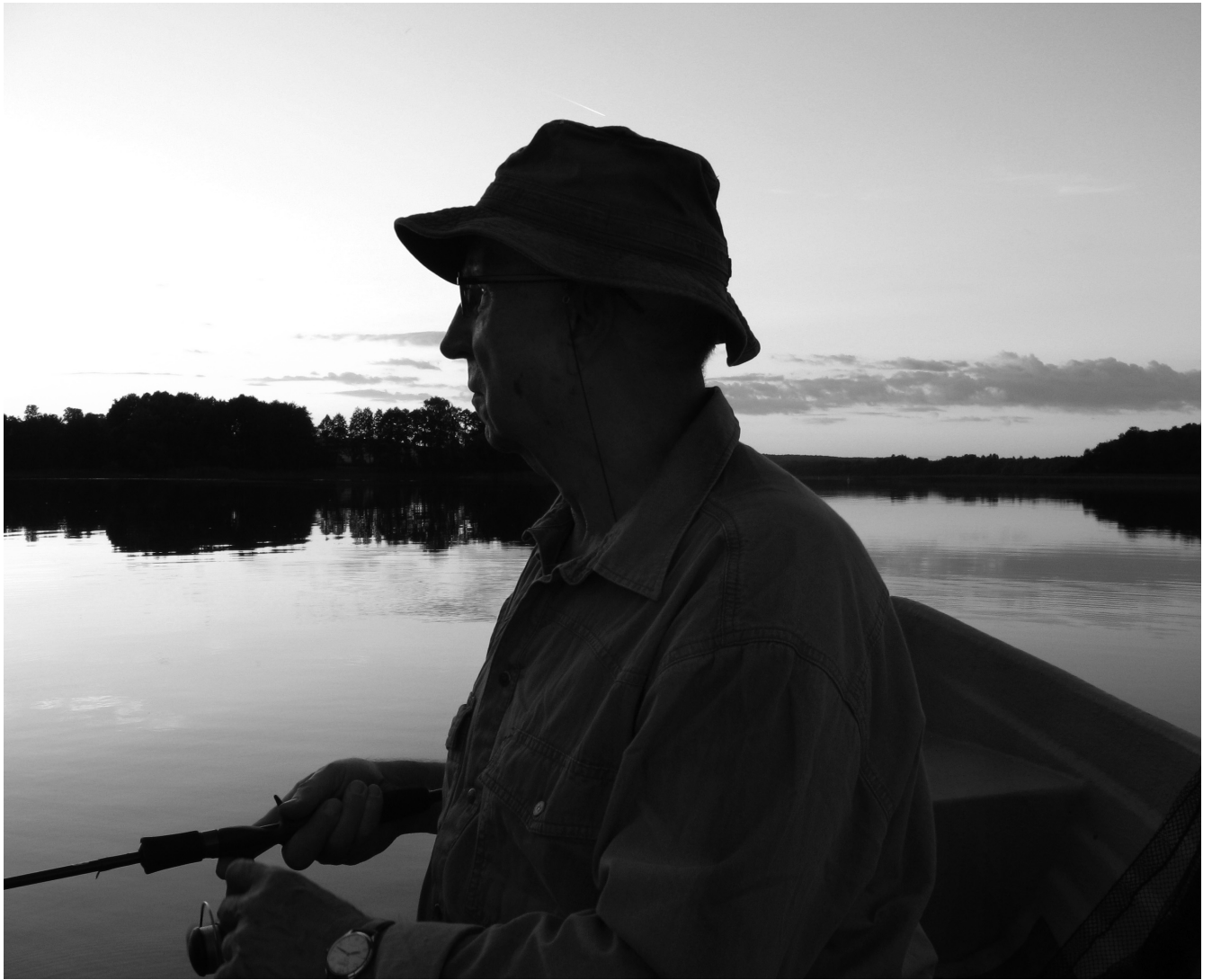
— il. 3 Na rybach.