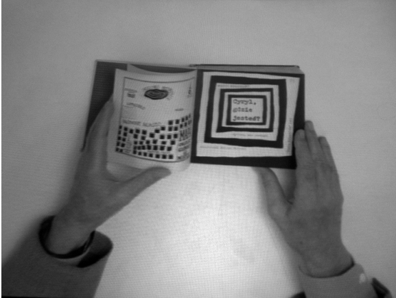
il. 4 Videobook Cyrul, gdzie jesteś? Wiktora Woroszyńskiego, Nasza Księgarnia, Warszawa 1962.

skotliwym dowcipem Mistrza, jak i przypomnieć sobie niektóre realizacje tym, którzy już od dawna z entuzjazmem reagują na sygnaturę „ Butenko pinxit ”.