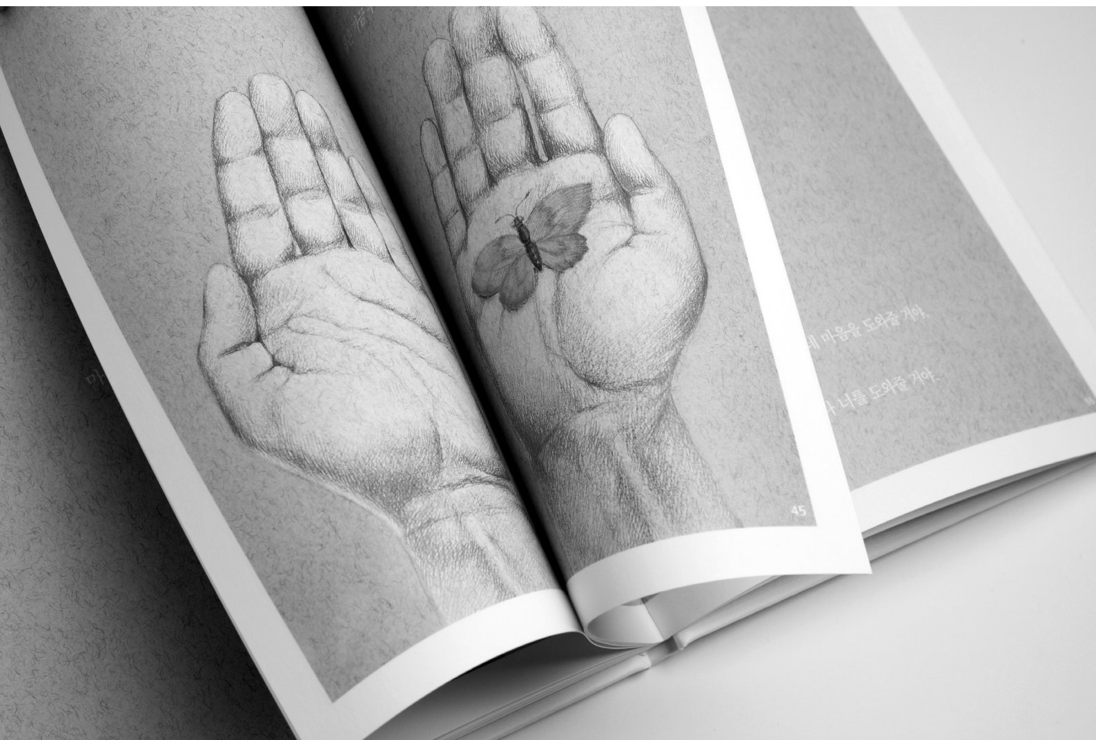
il. 1. K. Hee-Kyung, Dom duszy: Maum , il. I. Chmielewska, wyd. Changbi Publishers, Paju-si (Korea) 2011.