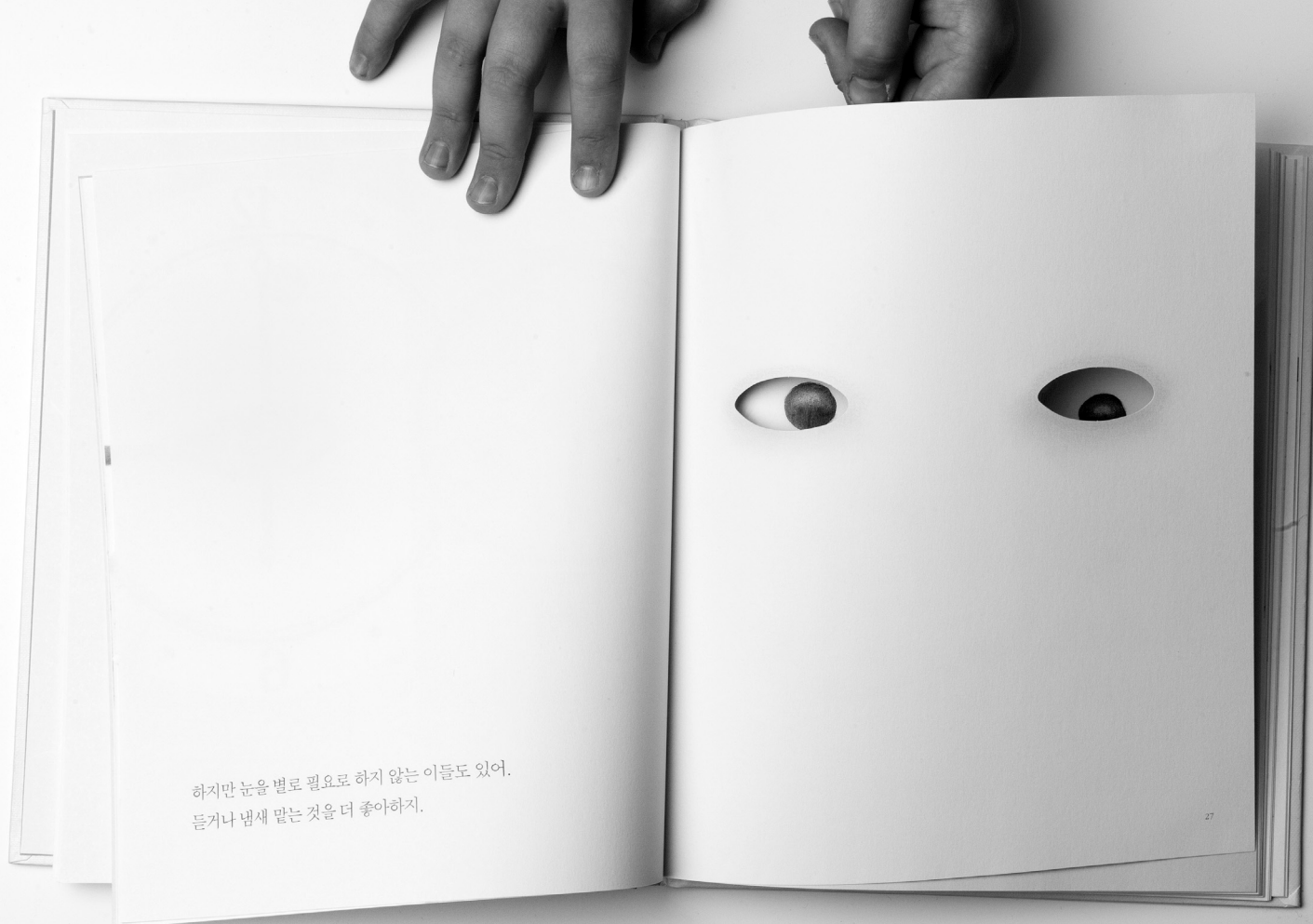
il. 5. I. Chmielewska Eyes (Oczy) , wyd. Changbi Publishers, Paju-si (Korea) 2013.

otrzymuje równorzędną funkcję z treścią, dlatego możemy mówić o narracyjności obrazu i badać jego relacje wobec składownika literackiego.