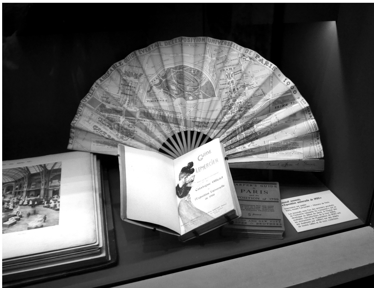
Pamiątki z Wystawy Światowej r. 1900, fragment ekspozycji „Paris, vitrine du monde”.

Palais de l'Électricité zachwycał potencjałem energii elektrycznej, a w Palais Optique można było przez lunetę oglądać „jak na dłoni” Księżyc. Industrialną formę, korespondującą z tematyką ekspozycji, przyjął, rozebrany po zakończeniu prezentacji, pawilon projektu Louisa Bonnier dla firmy Schneider Electric, która produkowała m.in. lokomotywy i motory. Z nieskrywaną dumą twórcy „Paris 1900...” pochwalili się metrem paryskim, inaugurowanym podczas Wystawy Światowej. Już sama aranżacja sali nawiązywała do kształtów wejść do metra projektu Hectora Guimarda.