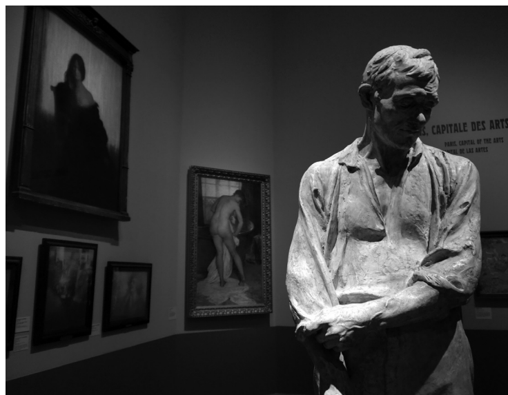
J. Dalou, Grand paysan , w tle T. Robert-Fleury, Le Bain , fragment ekspozycji „Paris, capitale des arts”.