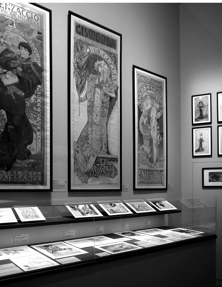
Plakaty autorstwa Alfonsa Muchy, fragment ekspozycji „Paris en scène”.

mnętych gabinetów restauracyjnych i domów publicznych Paryża wracamy jeszcze do sal teatralnych czy też kinowych. Kuratorzy na koniec wystawy spróbowali pokazać, jak szeroki wachlarz rozrywek proponował przybyszom Paryż. Na przełomie XIX i XX w. coś interesującego dla siebie mogli znaleźć zarówno miłośnicy sztuki wysokiej prezentowanej w tradycyjnej formie (na nich czekały spektakle w operze), jak i wielbiciele lżejszej tematyki (odwiedzający prywatne teatry – np. Vaudeville, Variétés czy Théâtre de la Porte-Saint-Martin) – oraz preferujący realizacje nowoczesne (tych gromadził Théâtre Libre). Bez wątplenia tą częścią wystawy zawiązała największa gwiazda ówczesnej paryskiej sceny – wymieniana tu już Bernhard. Przypominają ją m.in. plakaty Muchy, popiersie dłuta Gérôme’a czy fotografie Nadara. Usunięci nieco w cień zostali inni aktorzy tej epoki – chociażby Benoît-Constant