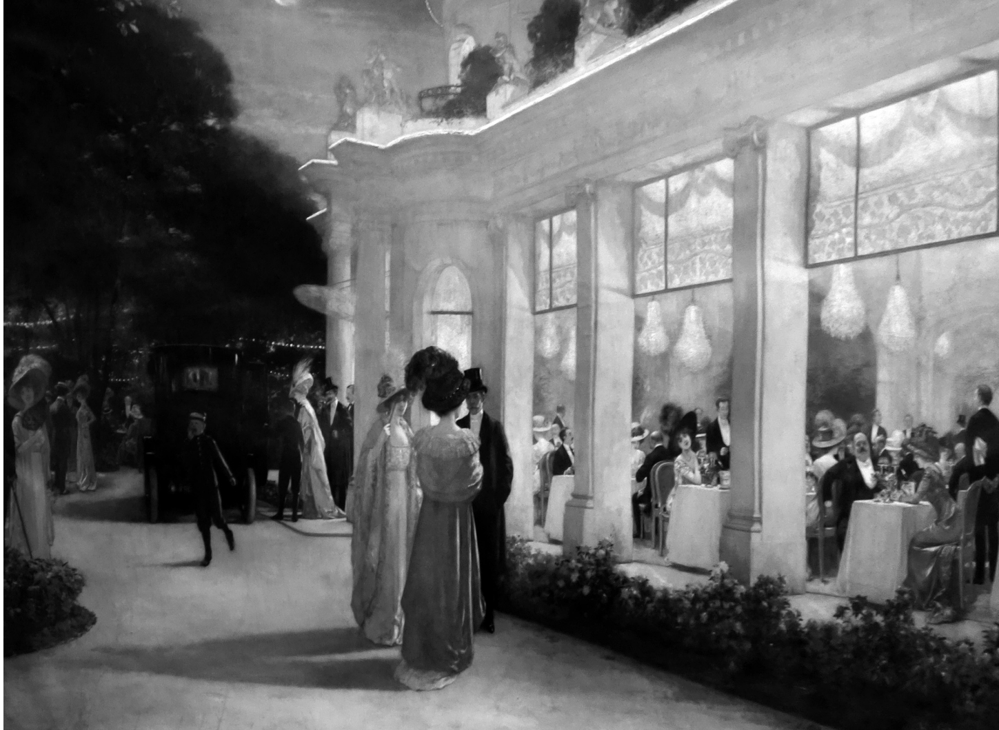
H. Gervex, Soirée au Pré Catelan , fragment ekspozycji „Paris, la nuit”.