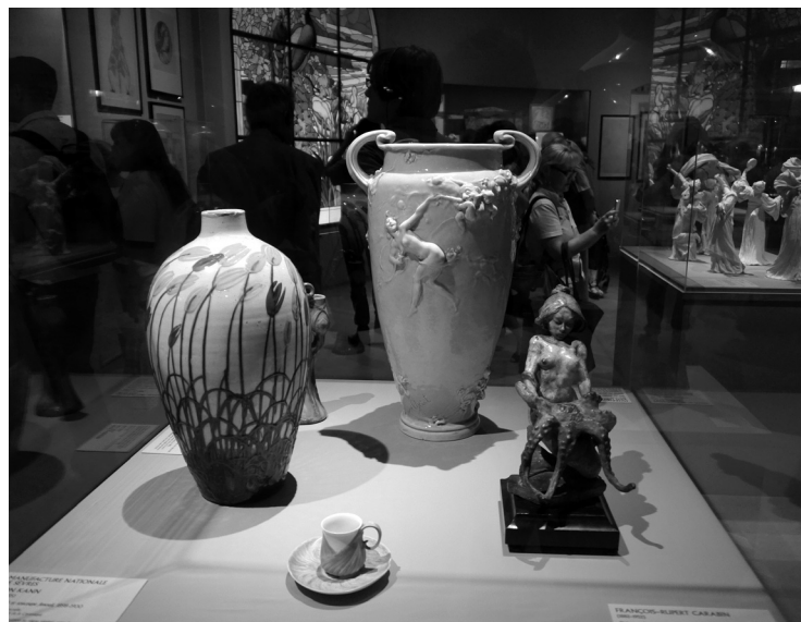
Ceramika autorstwa m.in. L. Kanna i F.-R. Carabina; fragment ekspozycji „Paris, Art nouveau”.

Aby odtworzyć tygiel artystyczny, jakim ok. r. 1900 był Paryż, skonfrontowano ze sobą obrazy i rzeźby prezentujące różne i często odmienne postawy artystyczne. Pośród dzieł sztuki malarskiej znalazły się prace zarówno aktywnych wciąż w tamtym okresie akademików (William-Adolphe Bouguereau, Jean-Léon Gérôme), jak i impresjonistów (np. Pierre-Auguste Renoir, Alfred Sisley, Claude Monet, Mary Cassatt), symbolistów (Odilon Redon, Edgard Maxence, George Desvallières), kończąc na nabistach (Maurice Denis). Starano się wyeksponować wszelkie gatunki malarskie – portrety (Paul Cézanne, Portret Ambroise’a Vollarda , 1899), pejzaże (Sisley, Le Port de Cardiff [Kanał żeglugowy w Cardiff], 1897), akty (Tony Robert-Fleury, Le Bain [Kąpiel], 1903), sceny symboliczne (Albert Maignan, Zielona muza , 1895), a także prace inspirowane utworami literackimi (Luc-Olivier Merson, Łza za kroplę wody , 1903). Podobnie postąpiono, wybierając rzeźby. W jednej przestrzeni można było zobaczyć wyidealizowany akt (Louis Convers, La Source [Źródło], po 1904), rzeźby realistycznie (Jules Dalou, Grand paysan [Wielki wieśniak], ok. 1899), impresjonistyczne (Medardo Rosso, Złoty wiek , 1885), klasycyzujące (Antoine Bourdelle, La Naissance d’Aphrodite [Narodziny