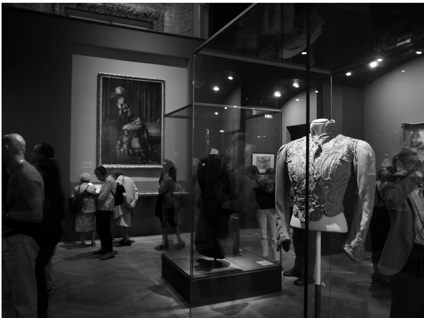
Fragment ekspozycji „Le Mythe de la Parisienne”.

verry, Vertige (Zawrót głowy, ok. 1903). Następnie pokazano znane i oklaskiwane przez tłumy tancerki (Caroline Otero, Liane de Pougy, Cléo de Mérode), a także anonimowe baletnice, słynące z licznych romansów, kochanków i przygód. Prezentują je m.in. fotografie pochodzące z atelier Léopolda Reutlingera i Paula Nadara. Ówczesny Paryż był też miastem wielu domów publicznych, hoteli wynajmowanych na godziny, prostytutek poszukujących klientów w kawiarniach i na bulwarach. Na wystawie przypominały o tym liczne anonimowe fotografie erotyczne i pornograficzne. Twórcy ekspozycji stworzyli także zaciemniony „pokoik”, w którym można było wejść w świat domów publicznych Paryża. Widza witała starająca się być demoniczną, ale równocześnie pełną słodyczy Madame Satan z obrazu George’a-Achille’a Foulda (1904). Towarzyszyły jej rzeźby Carabina