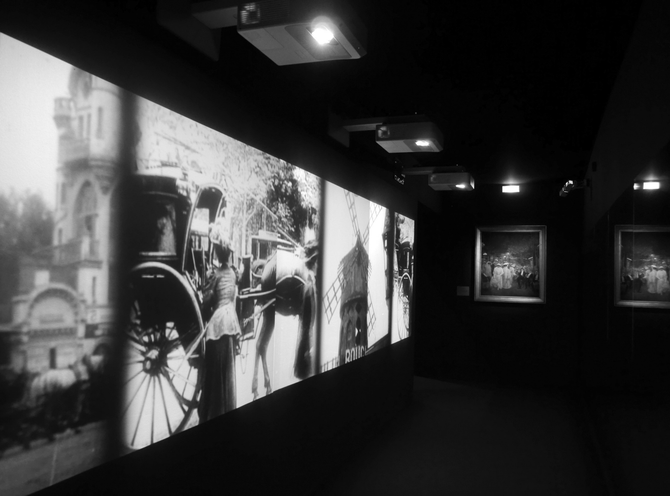
Przejście pomiędzy salami wystawy „Paris 1900, la ville spectacle”.

zaznaczyć, że r. 1900 i Wystawa Światowa były chwilą wielkiego triumfu tego stylu. Kuratorzy skupili się na przedstawieniu prac twórców francuskich lub z Francją związanych. Licznie ekspozowano ceramikę z Sèvres projektu Guimarda, Léona Kanna czy André-Fernanda Thesmara, a także biżuterię autorstwa m.in. Georges’a Fouqueta, René Lalique’a i Eugène’a-Samuela Grasset. Nie zapomniano również o meblach Louisa Majorelle’a, o meblach i wyrobach ze szkła Émile’a Gallégo ani o oddziaływaniu stylistyki secesyjnej na modę (pokazano np. spódnicę firmy Callot Soeurs). Pomędzy Francuzami pojawił się także francuski Czech – wspomniany już Mucha – święcący triumfy w Paryżu ok. r. 1900. Przywołano jego projekt wnętrza sklepu jubilerskiego Fouqueta – kwintesencję paryskiego art nouveau .