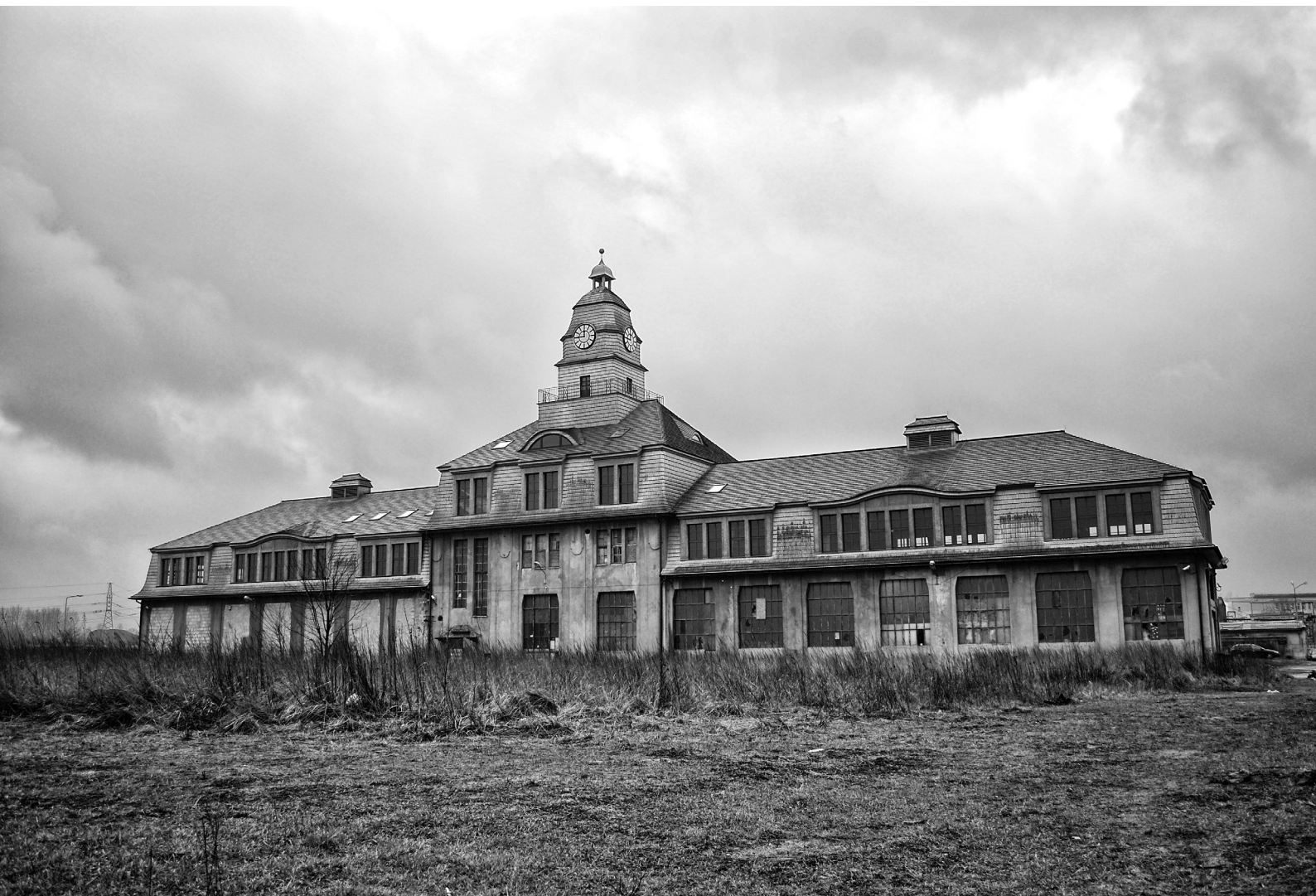
— il. 2 Żelbetowy budynek cechowni huty cynku Uthemann.