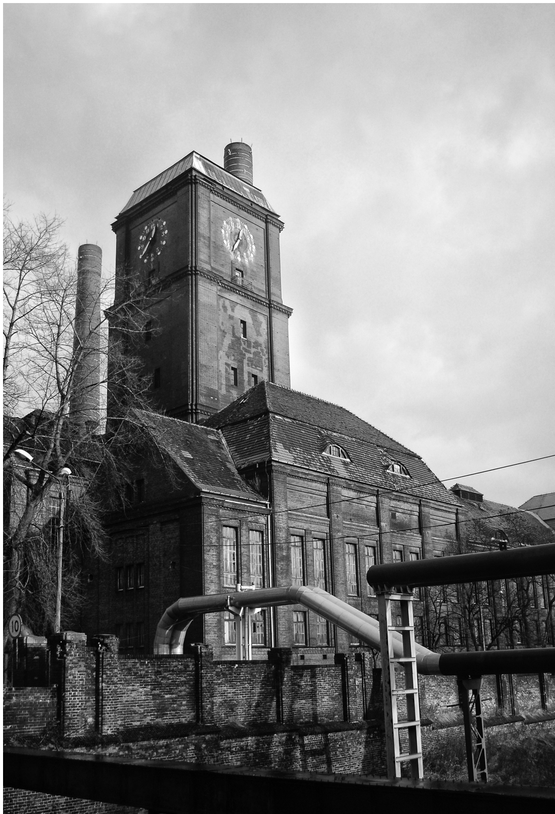
— il. 4 Elektrociepłownia Oberschlesien.