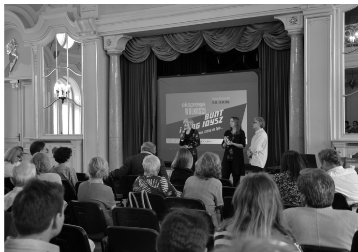
5. Konferencja pt. „Grupa Jung Idysz i żydowska awangarda artystyczna”, Muzeum Miasta Łodzi, 12 czerwca 2019.

Swoje wysiłki kreacyjne Podjęte przez członkowie Jung Idysz realizowali w środowiskach awangardy plastycznej i literackiej w Krakowie, Lwowie, Warszawie i Białymstoku. Pomimo silnego akcentowania przynależności etnicznej (język, tradycja) na sztukę ugrupowania znacznie oddziaływały aktualne wówczas kierunki artystyczne: futurizm, ekspresjonizm, kubizm. W latach 20. i 30. XX w. Idyszowcy i Buntowcy funkcjonowali w środowisku międzynarodowym – przede wszystkim w Berlinie, Dreźnie, Paryżu. Choć po zawieszeniu działalności obu grup, wzajemne relacje uległy rozluźnieniu, późniejsze dokonania poszczególnych twórców nawiązywały do okresu wspólnych poszukiwań i inspiracji w dążeniu do zdefiniowania tożsamości narodowej (polskiej oraz żydowskiej) i artystycznej.