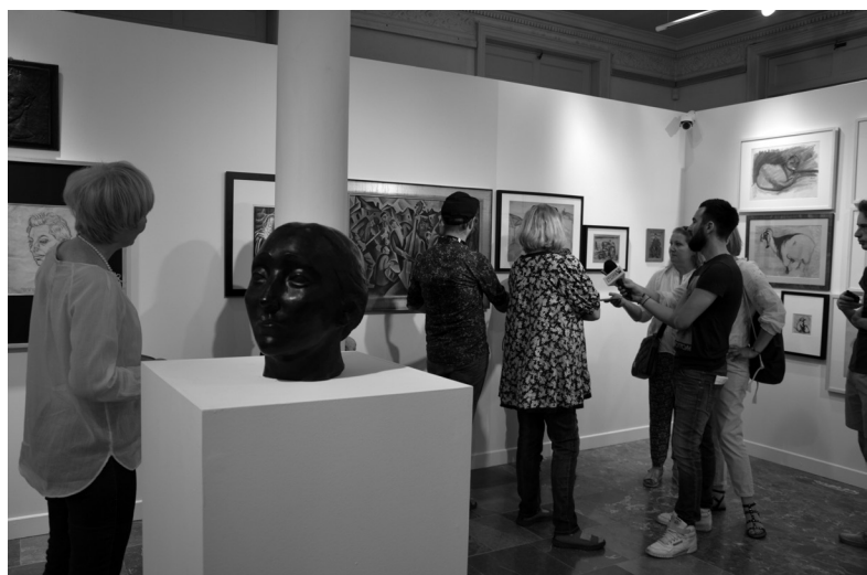
3. Wernisaż wystawy „Ekspresje Wolności”.