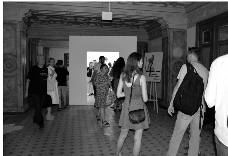
7. Projekt „Hommage à Bunt i Jung Idysz” - widok z holu wejściowego.