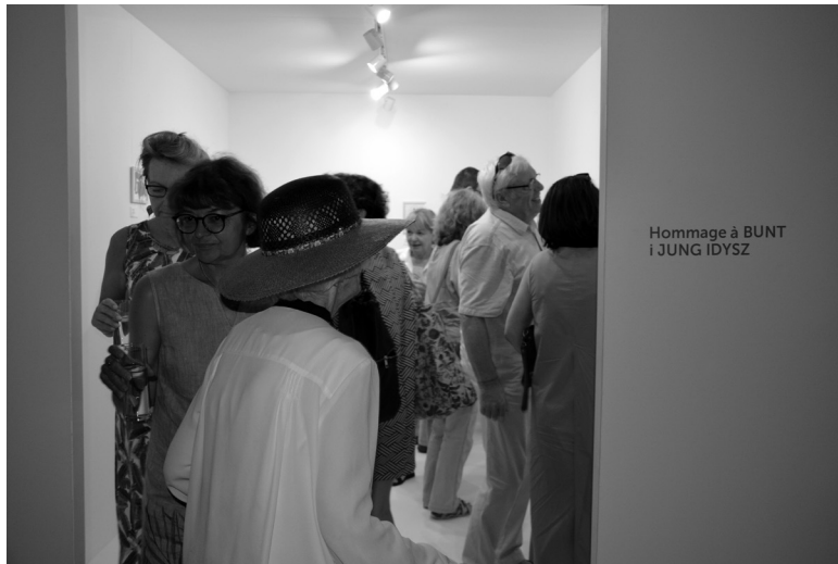
6. Projekt „Hommage à Bunt i Jung Idysz”.