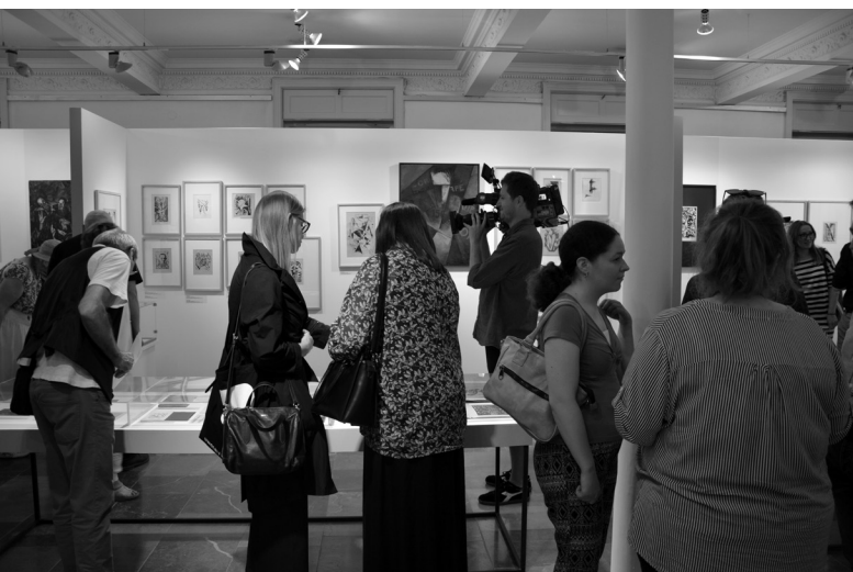
2. Wernisaż wystawy „Ekspresje Wolności”.