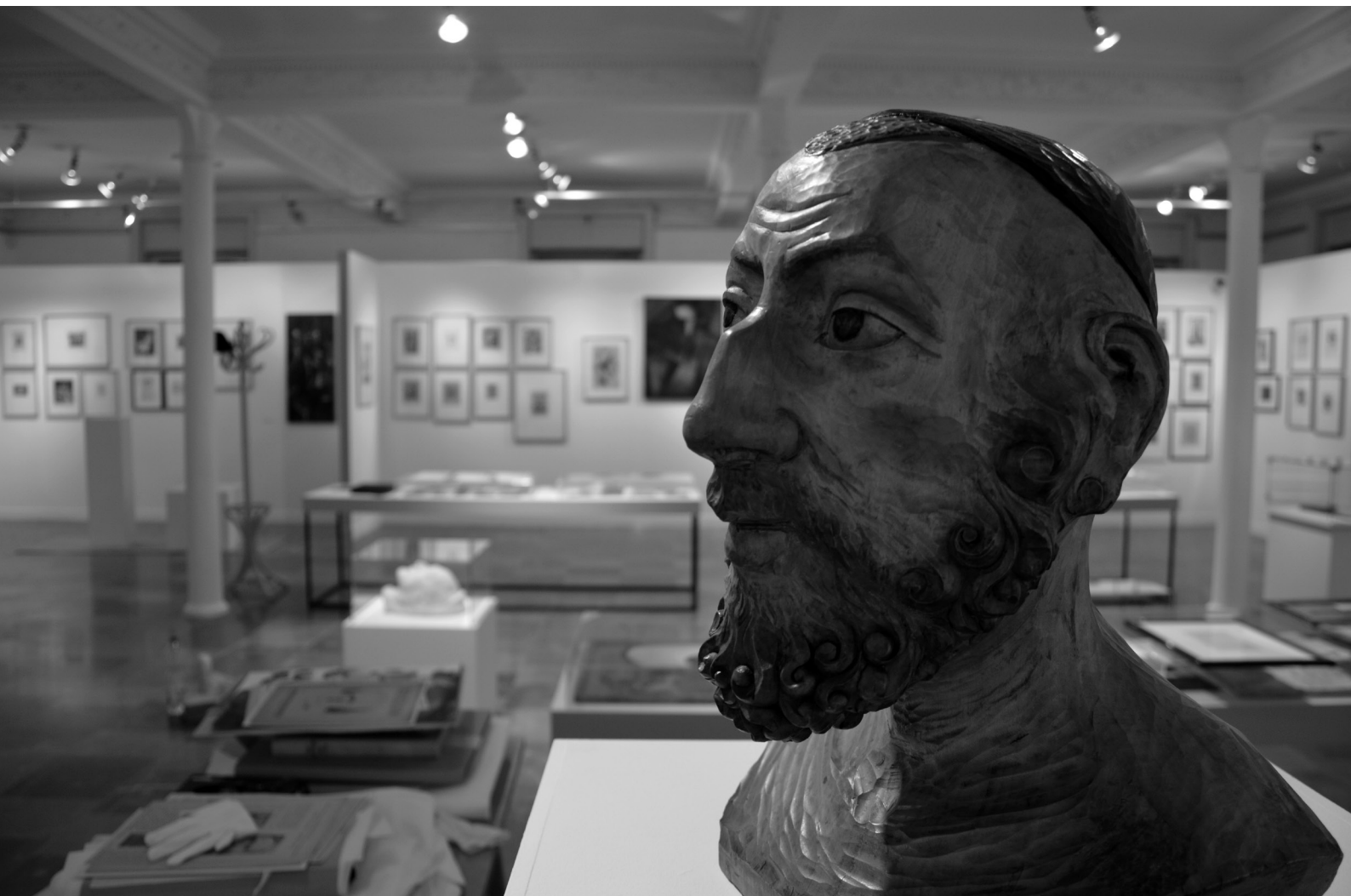
1. Widok ogólny wystawy „Ekspresje Wolności” z rzeźbą I. Braunera na pierwszym planie.