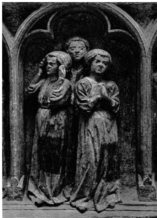
11. Nagrobek Henryka IV Probusa z kościoła św. Krzyża we Wrocławiu, płaczkowie, pierwsza tercja XIV w.; Muzeum Narodowe we Wrocławiu.