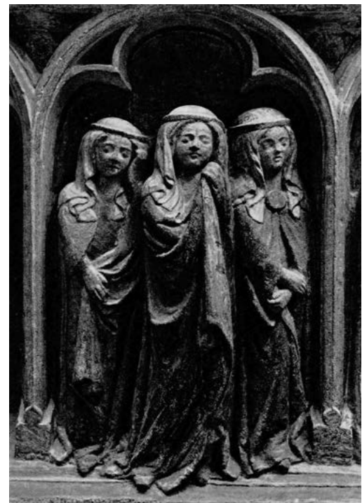
10. Nagrobek Henryka IV Probusa z kościoła św. Krzyża we Wrocławiu, rodzina książęca, pierwsza tercja XIV w.; Muzeum Narodowe we Wrocławiu.