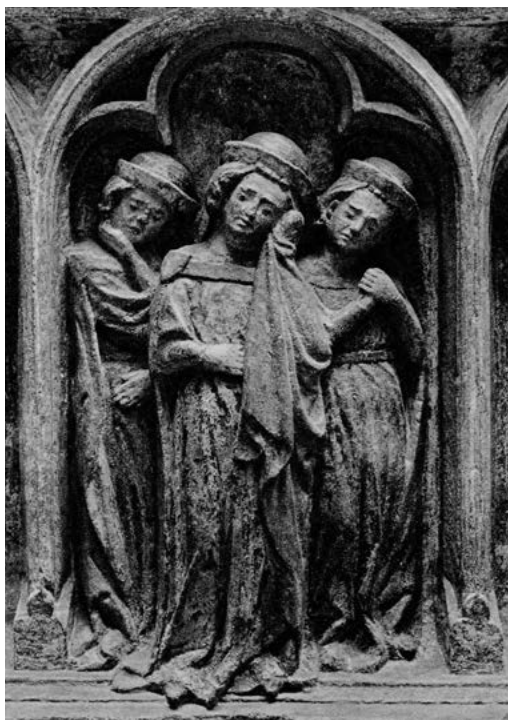
12. Nagrobek Henryka IV Probusa z kościoła św. Krzyża we Wrocławiu, rodzina książęca, pierwsza tercja XIV w.; Muzeum Narodowe we Wrocławiu.