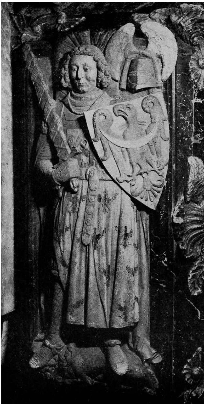
16. Nagrobek Bolka I Chwalebnyego, kościół pocysterski w Krzeszowie, ok. 1320-1330.