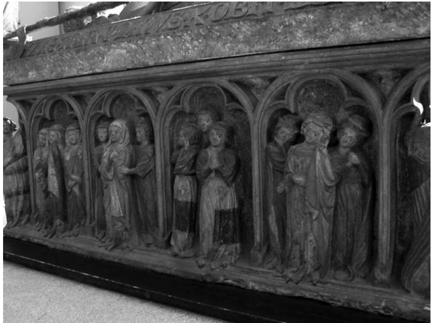
5. Nagrobek Henryka IV Probusa z kościoła św. Krzyża we Wrocławiu, widok z boku – rodzina i dwór książęcy, pierwsza tercja XIV w.; Muzeum Narodowe we Wrocławiu.