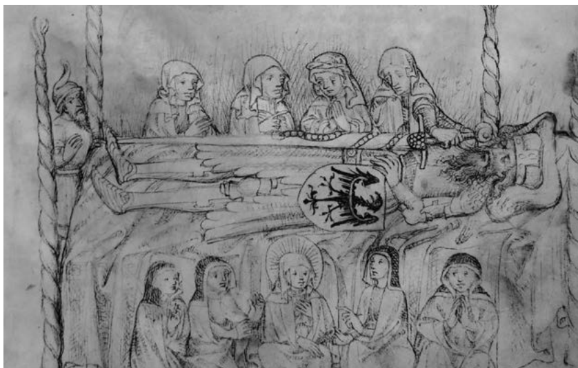
15. Henryk I Brodaty na łożu paradnym, Kodeks hornigowski z Legendą o św. Jadwidze , 1451; Biblioteka Uniwersytecka we Wrocławiu.

Gruby, książę legnicki, a niebawem i wrocławski, rodzina, urzędnicy, dwór, damy dworu i duchowieństwo 28 . Pokazano też, niewymienione w deskrypcji, płaczki – żałobnice 29 .