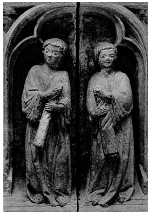
13. Nagrobek Henryka IV Probusa z kościoła św. Krzyża we Wrocławiu, klerycy ze świecami, pierwsza tercja XIV w.; Muzeum Narodowe we Wrocławiu.

czany i wystawiono w katedrze św. Wita. Tam też po uroczystej mszy żałobnej i innych obrzędach pogrzebowych ciało cesarskie, przebrane w habit franciszkański i złożone do drewnianej trumny, spoczęło w krypcie pod prezbiterium katedry 19 .