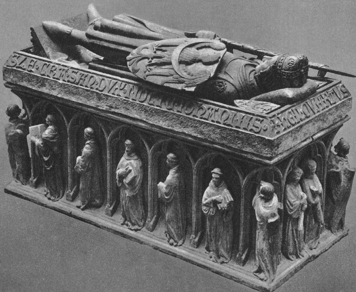
2. Nagrobek Henryka IV Probusa z kościoła św. Krzyża we Wrocławiu, pierwsza tercja XIV w.; Muzeum Narodowe we Wrocławiu.