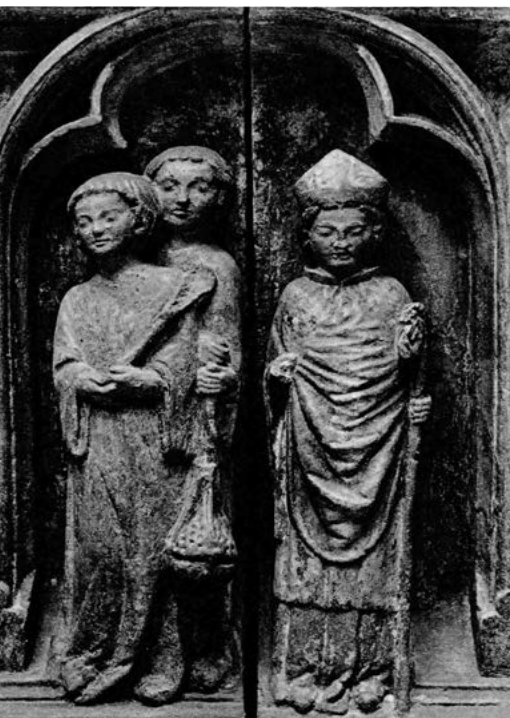
8. Nagrobek Henryka IV Probusa z kościoła św. Krzyża we Wrocławiu, biskup Tomasz II i akolici, pierwsza tercja XIV w.; Muzeum Narodowe we Wrocławiu.