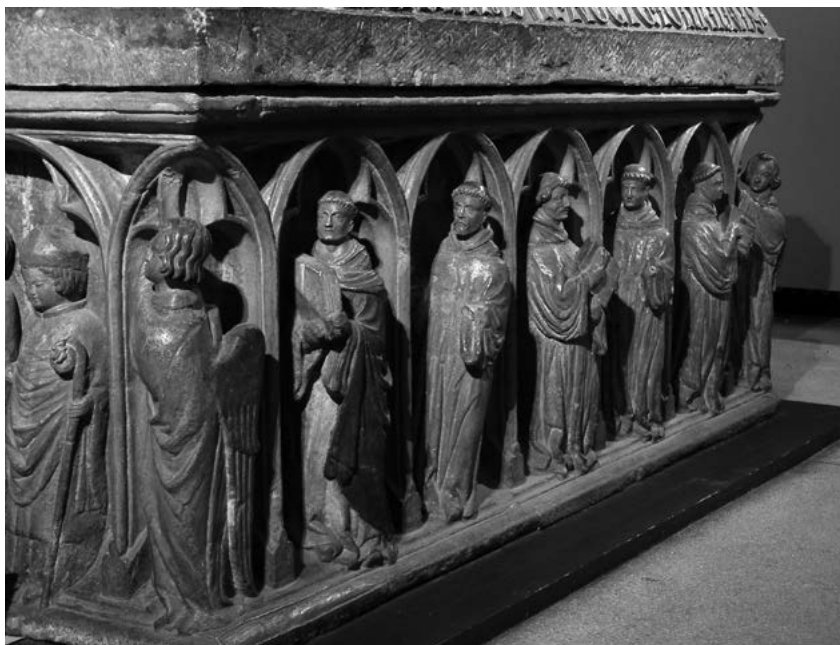
7. Nagrobek Henryka IV Probusa z kościoła św. Krzyża we Wrocławiu, widok z boku – kanonicy kolegiaty św. Krzyża, pierwsza tercja XIV w.; Muzeum Narodowe we Wrocławiu.

na widok publiczny w auli zamkowej, zaprezentowane w całym splendorze monarszym, przybrane w strój uroczysty, zaopatrzone w insygnia władzy książęcej – mitrę, tarczę i oparty na ramieniu miecz. Dokładnie tak samo ukazywani są książęta śląscy na ich pieczęciach, od sigillum Bolesława II Rogatki (ojca Henryka Grubego) z 1244 r. poczynając 13 . W najstarszych pieczęciach nie pojawia się tylko mitra, którą spotykamy jednak już na pieczęciach Henryka III Głogowskiego z początku XIV wieku 14 . Może jako pierwszy na Śląsku używać jej zaczął właśnie Henryk Probus? Łoże paradne, na którym spoczywa ciało księcia, otoczone jest, jak później katafalk w kościele św. Krzyża, wielkimi świecami, podobnie jak widać to na miniaturach obrazujących uroczyste wystawienie zwłok Henryka Brodatego w Kodeksie lubińskim z 1353 r. i w jego naśladownictwie – Kodeksie hornigowskim z 1451 r. (Wrocław, Biblioteka Uniwersytecka) [fig. 15], oraz w podobnej scenie namalowanej na ołtarzu św. Jadwigi z kościoła Bernardynów we Wrocławiu (ok. 1430–1450, Muzeum Narodowe w Warszawie) 15 . Po ceremonialnym przeniesieniu zwłok księcia do kościoła następują w nim uroczystości religijne. Charakterystycznym szczegółem jest też wiadomość o uprzednim przebraniu ciała zmarłego w habit zakonny i przykryciu go płaszczem książęcym – jedynym insygnium władzy, jakie zmarły otrzymał do grobu 16 .