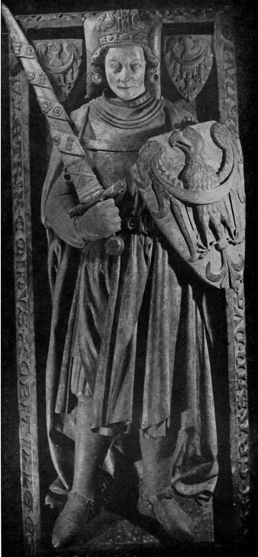
3. Płyta wierzchnia nagrobka Henryka IV Probusa z kościoła św. Krzyża we Wrocławiu, pierwsza tercja XIV w.; Muzeum Narodowe we Wrocławiu.