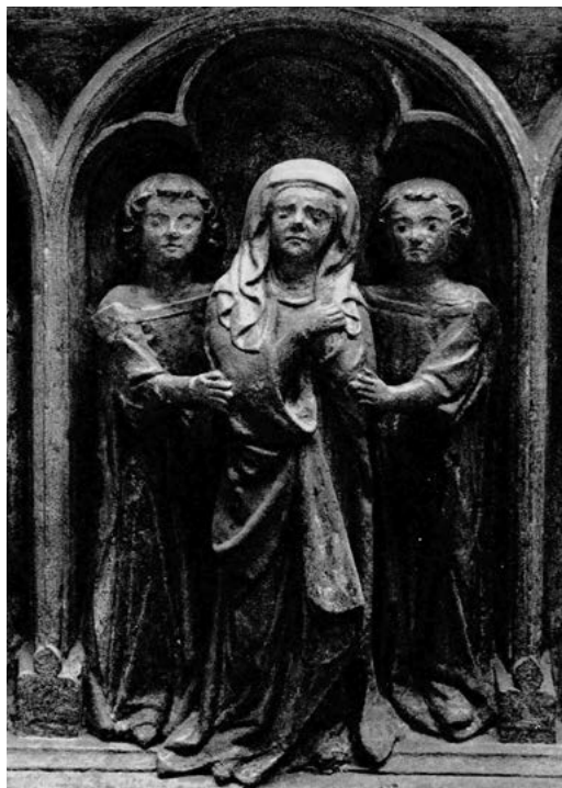
9. Nagrobek Henryka IV Probusa z kościoła św. Krzyża we Wrocławiu, księżna Matylda, pierwsza tercja XIV w.; Muzeum Narodowe we Wrocławiu.