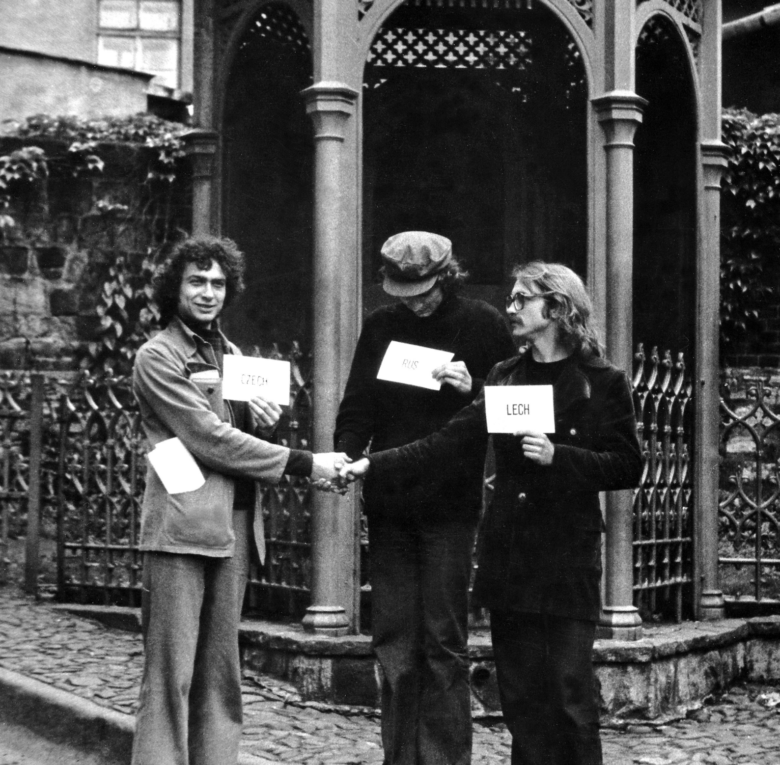
5. ASPUJ, Spotkanie trzech braci , 1976; Festiwal Młodzieży Szkół Artystycznych, Cieszyn.