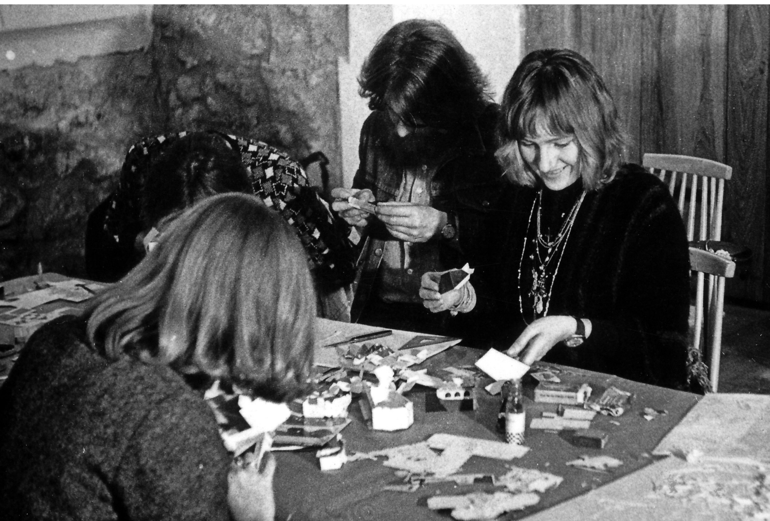
— 2. ASPUJ, Spółeczne determinanty procesu wycinania i klejenia , 1977; Galeria „Mały Rynek”, Kraków.