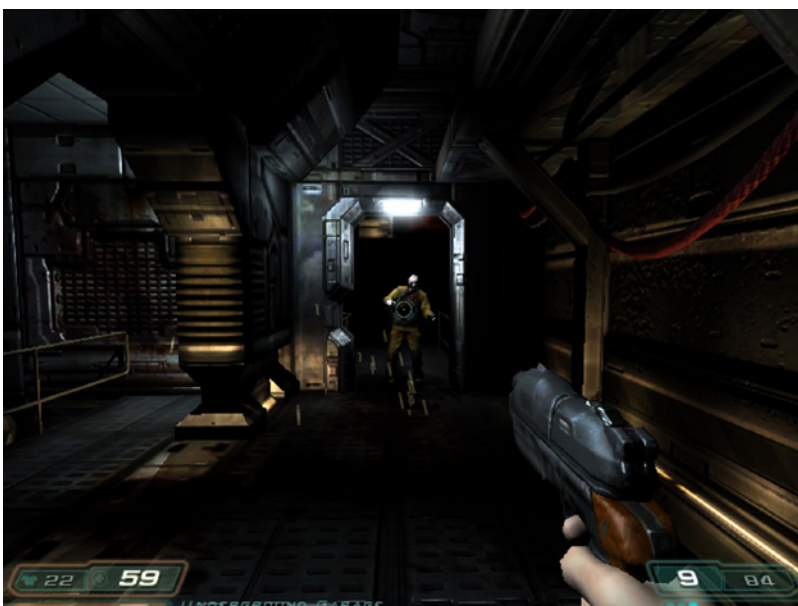
Ill. 3 : id Software, DOOM 3 , 2004