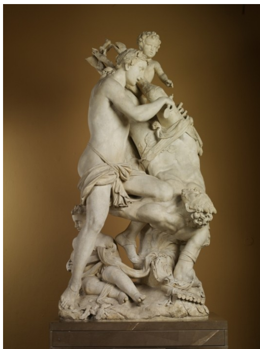
2 Antonio Corradini, Apollo scorticante Marsia , ante 1728, marmo, 220 x 100 x 57 cm, Londra, Victoria and Albert Museum, A.6-1967