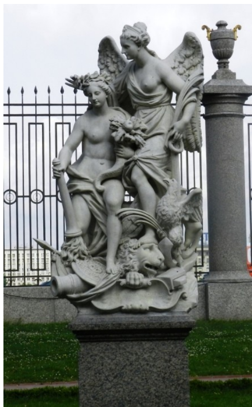
1 Pietro Baratta, Allegoria della Pace di Nystad, 1722, marmo, 175 cm, Giardino d'Estate, San Pietroburgo