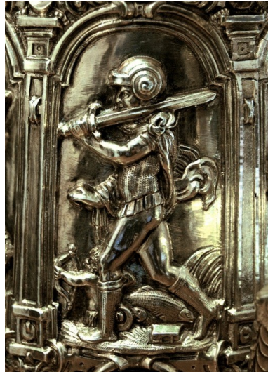
4 Werkstatt Jamnitzer, Personifikation des Jupiter auf dem Planetenhumpen, um 1550 und 1570er-1580er Jahre, Silber, gegossen, ziseliert, vergoldet, Höhe 6,5 cm. Stredoslovenské múzeum, Banská Bystrica