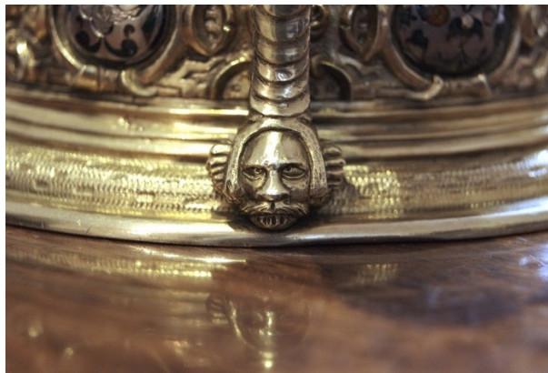
12 Werkstatt Jamnitzer, Detail des Kopfs am Henkelansatz des Planetenhumpens, 1570er-1580er Jahre, Silber, gegossen, ziseliert, vergoldet. Stredoslovenské múzeum, Banská Bystrica

[20] Der Schöpfer des Planetenhumpens wiederholt ein Motiv, das beispielsweise an der Wandung des luxuriösen Lavabos auftritt, das Wenzel Jamnitzer irgendwann in den Jahren 1550-1560 schuf und sich heute im Louvre befindet. 52 Das langfristige Interesse Jamnitzers an der Gestaltung des Löwenkopfs als für ihn charakteristisches Motiv bzw. als Handelsmarke 53 kann auch im Rahmen des sog. Berliner Skizzenbuchs von Wenzel und Christoph Jamnitzer beobachtet werden. 54 Doch die allgemeine Robustheit des Humpens aus Neusohl/Banská Bystrica und eine gewisse Rustikalität des Rollwerk-Ornaments und der Email-Medaillons schließen eine Einordnung des Planetenhumpens in das minutiöse eigene Schaffen Wenzel Jamnitzers aus, das im Übrigen auch durch eine ausgeklügelte Thematik und Konzeption charakterisiert ist; in Frage könnte jedoch ein weniger talentiertes oder weniger profiliertes Mitglied der Familie Jamnitzer kommen, das vielleicht sein Selbstporträt am Henkelansatz in Form eines überaus ausdrucksstarken bärtigen Männerkopfs hinterlassen hat (Abb. 12). 55