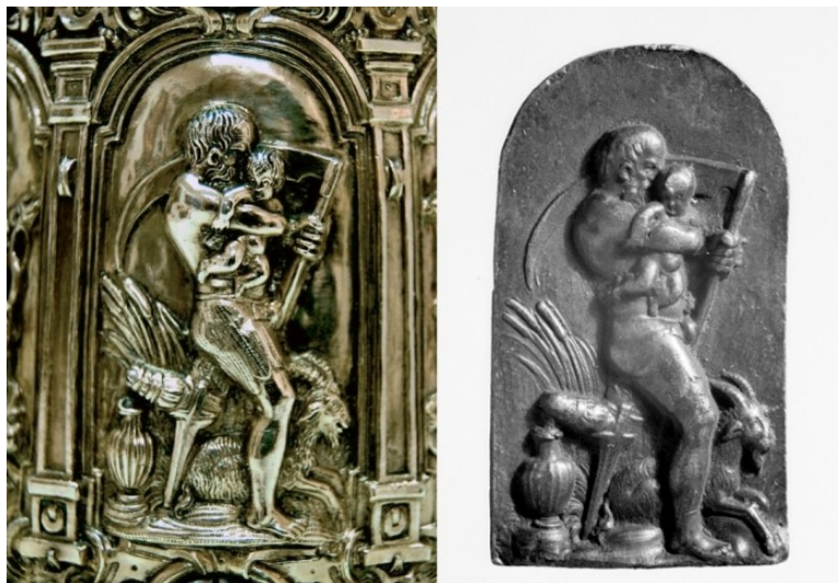
3a (links) Werkstatt Jamnitzer, Personifikation des Saturn auf dem Planetenhumpen, um 1550 und 1570er-1580er Jahre, Silber, gegossen, ziseliert, vergoldet, Höhe 6,4 cm. Stredoslovenské múzeum, Banská Bystrica