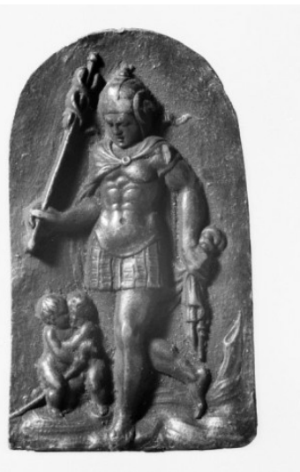
5a (links) Werkstatt Jamnitzer, Personifikation des Merkur auf dem Planetenhumpen, um 1550 und 1570er-1580er Jahre, Silber, gegossen, ziseliert, vergoldet, Höhe 6,3 cm. Stredoslovenské múzeum, Banská Bystrica