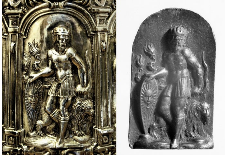
2a (links) Werkstatt Jamnitzer, Personifikation der Sonne auf dem Planetenhumpen, um 1550 und 1570er-1580er Jahre, Silber, gegossen, ziseliert, vergoldet, Höhe 6,5 cm. Stredoslovenské múzeum, Banská Bystrica (© Barbara Balážová, Bratislava)