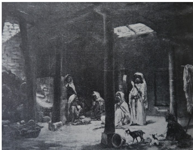
4 Adolf Sandoz, Wnętrze mieszkania w Biskirze , 1879 (reprodukcja z Tygodnik Ilustrowany 41 [1913], 805)

[23] Przyglądając się uważnie tematyce obrazów Sandoza związanych z Algierią, możemy zauważyć, że zdecydował się na kilka bardzo popularnych motywów obecnych także w twórczości innych zafascynowanych północną Afryką malarzy-podróżników. Prezentowane w Paryżu, a następnie w Polsce Wnętrze mieszkania w Biskirze (ilustr. 4), malarz opisywał w następujący sposób: