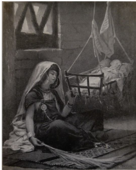
5 Adolf Sandoz, Arabka przy kolebce , 1879 (reprodukcja z Katalog wystawy sztuki współczesnej , Lwów 1913, 16)

[24] W zacisznym wnętrzu arabskiego domu Sandoz umieścił także scenę ukazującą Arabkę przy kolebce (Niewiasta saharyjska) . Dzieło znamy dzięki reprodukcji zamieszczonej w katalogu wystawy z roku 1913 (ilustr. 5) 52 . Na rozpostartych na podłodze dywanikach siedzi młoda kobieta, ubrana w typowy dla mieszkańców tego regionu strój, którym zachwycał się malarz – udrapowaną szatę spiętą agrafami, jako mężatka na głowie nosi warkocze z wełny i osłania je jasnym welonem, malowniczy strój dopełnia biżuteria. Arabka piastuje dziecko śpiące w zawieszanej u sufitu kołysce. Sandoz podjął nigdy nietracący na atrakcyjności temat macierzyństwa, wywodzący się z ikonografii Matki Boskiej, a także św. Anny, przełożony na realia życia w krajach Orientu. Temat macierzyństwa wykorzystywali tacy malarze orientaliści jak Chassériau, Jean-Baptiste Huysmans, Leroy, Landelle 53 . Postać siedzącej dziewczyny algierskiej, w tradycyjnym stroju, melancholijnie spoglądającej przed siebie, pojawia się natomiast u Louisa Ernesta Barriasa w rzeźbie zdobiącej nagrobek Guillaumeta na cmentarzu Montparnasse.