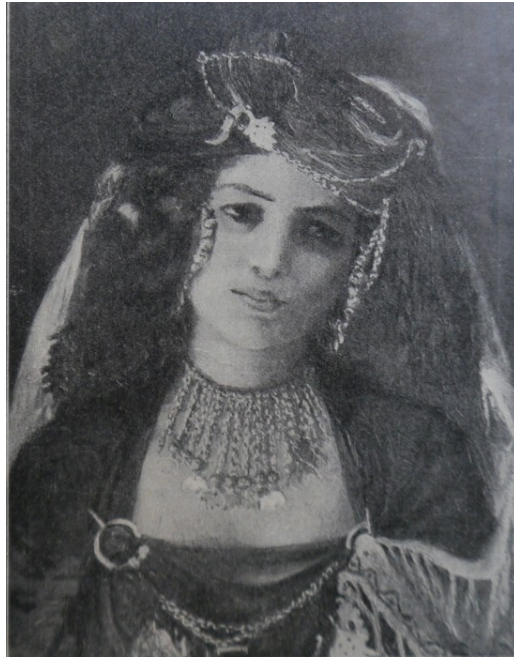
2 Adolf Sandoz, Szejkowa El-Kantary , 1881