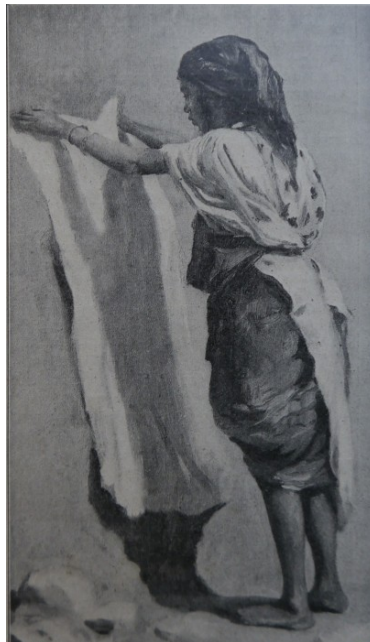
3 Adolf Sandoz, Arabka z El-Kantary , 1881 (reprodukcja z Tygodnik Ilustrowany 41 [1913], 805)