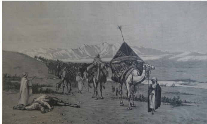
7 Adolf Sandoz, Karawana wielbłądów w Saharze , 1881 (reprodukcja z Kłosa 917 [1883], 58)

Obraz ten był reprodukowany w czasopiśmie Kłosa , towarzyszyły mu ciekawe wspomnienia malarza, które wyjaśniają scenę rozgrywającą się na pustyni. Sandoz niespodziewanie spotkał w okolicach Biskiry karawanę. Opisywał to wydarzenie w następujący sposób: