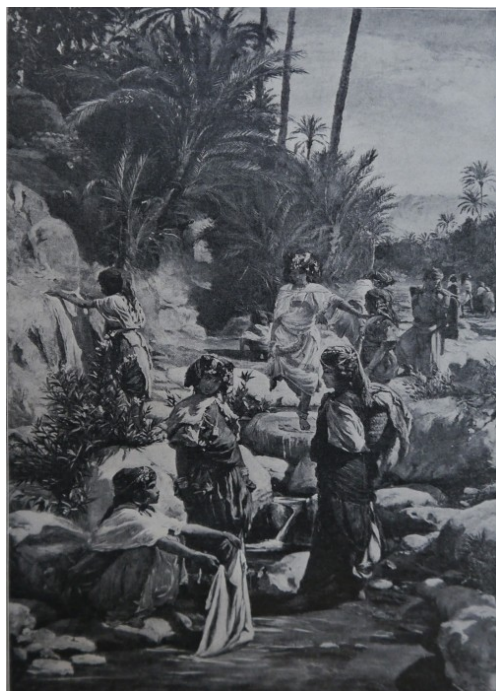
6 Adolf Sandoz, Nad brzegiem Ued w oazie El-Kantary , 1881 (reprodukcja z Tygodnik Ilustrowany 41 [1913], 805)

Malarz ukazał kobiety i dziewczęta, pochodzące z rodziny szejka El-Kantary, które piorą nad brzegiem rzeki. Kobiety noszą tradycyjne stroje i bogatą biżuterię. Sandoz utrwalił je w różnorodnych pozach – pochylające się nad wodą, niosące pranie, rozmawiające, rozwieszające tkaniny. Widoczna jest jego fascynacja wdziękiem i malowniczością strojów i urody kobiet algierskich. W tle rozpościera się pejzaż El-Kantary – kamieniste brzegi rzeki obrośnięte palmami. Wokół wody, cudu pojawiającego się na pustyni, skupiało się życie – tutaj czerpano wodę, zażywano kąpeli, prano. Te codzienne czynności, wykonywane przez arabskie kobiety, przyciągały uwagę malarzy podróżujących po Algierii. Kobiety piorące nad brzegiem rzeki ukazywali także Dinet, Jules Taupin, Francisque Noailly 61 .