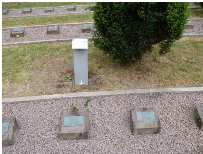
6 Kriegsgräberstätte Ludwigstein, die Gedenktafel (Abb. 5) auf der Grabanlage (Foto: Marco Dräger, August 2015)

[27] In diesem Beitrag wurde nur über zwei Friedhöfe berichtet. Die Gesamtzahl betroffener Kriegsgräberstätten im In- und Ausland, die noch einer Aufarbeitung harren, dürfte im dreistelligen Bereich liegen (Abb. 7). 51