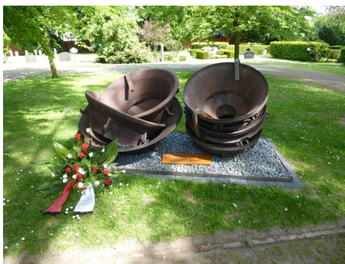
3 Friedhof Fössefeld, Hannover, Deserteur-Denkmal mit dem Titel „Ungehorsam 1939-1945“