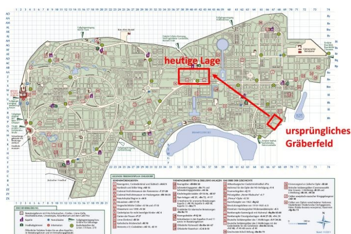
1 Friedhof Hamburg-Ohlsdorf, Friedhofsplan mit der ehemaligen und aktuellen Lage der 1960 umgebetteten Gräber der Militärjustizopfer

Ohlsdorf. 22 Denn anders als es die Beschilderung des entsprechenden Gräberfeldes mit "Deutsche Soldatengräber 1939-1945" suggeriert, sind dort nicht nur gefallene Soldaten bestattet. Dort liegen auch "mehrere hundert Verfolgte des NS-Regimes" 23 , nämlich im Untersuchungsgefängnis oder im Konzentrationslager Neuengamme Hingerichtete, in der Heilanstalt Strecknitz Verstorbene, ermordete Säuglinge von sogenannten Ostarbeiterinnen, jüdische Opfer, erschossene sowjetische Kriegsgefangene und kriegsgerichtlich zum Tode verurteilte Soldaten. 24 Auch die Gräber der Militärjustizopfer wurden nach dem Zweiten Weltkrieg dorthin umgebettet. Bis zu ihrer Umbettung auf das militärische Areal des Friedhofs im Jahr 1960 befanden sie sich am äußersten Rand des zivilen Teils, weit entfernt von in Nutzung befindlichen Gräberfeldern (Abb. 1). 25