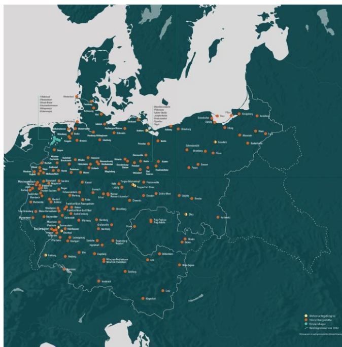
7 Karte der bislang bekannten Hinrichtungsstätten (orange) auf dem Gebiet des Deutschen Reiches in den Grenzen von 1942. Gestaltung: MMCD NEW MEDIA GmbH

[27] In diesem Beitrag wurde nur über zwei Friedhöfe berichtet. Die Gesamtzahl betroffener Kriegsgräberstätten im In- und Ausland, die noch einer Aufarbeitung harren, dürfte im dreistelligen Bereich liegen (Abb. 7). 51