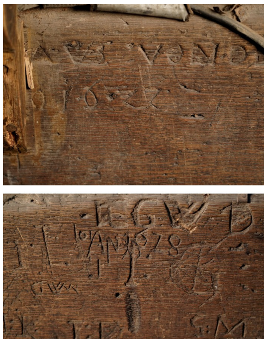
7 a-b Toruń, kościół pw. Wniebowzięcia NMP, XVII-wieczne graffiti na wewnętrznej stronie balustrady empory (fot. Juliusz Raczkowski).

rewersu w tych właśnie segmentach 58 (il. 7a, b) są pośrednim dowodem na to, że w okresie protestanckim empora była szerzej dostępna dla wiernych.