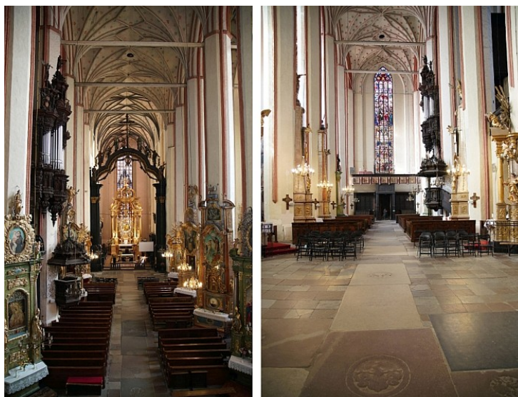
1 a-b Toruń, kościół pw. Wniebowzięcia NMP, wnętrze, (fot. Juliusz Raczkowski): a) widok w kierunku wschodnim, b) widok w kierunku zachodnim, z widocznymi historycznymi płytami nagrobnymi (fot. Juliusz Raczkowski)