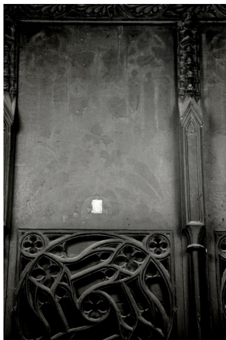
12 Toruń, kościół pw. Wniebowzięcia NMP, zaplecek stall w rzędzie południowym prezbiterium, segment wschodni, fotografia w bliskiej IR - na zdjęciu czytelny rysunek maswerków oraz dekoracji rocaillowej