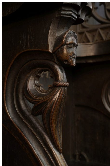
10 Toruń, kościół pw. Wniebowzięcia NMP, średniowieczna główka zdobiąca podłokietnik stall w rzędzie południowym, segment zachodni

kompozycji). W partii gotyckiej układ każdego z nich jest analogiczny 73 , podczas gdy ścianki w segmencie wschodnim są inaczej skomponowane i zróżnicowane, a grubo opracowane i pozbawione wykończenia główki o cechach fantastycznych, plujące labrami (por. il. 10 – il. 11), mają cechy dekoracji nowożytniej 74 . Odmienne, zapewne nowożytne, jest masywne, profilowane zwieńczenie tego segmentu, które zastąpiło ażurowe baldachimy ciągu głównego.