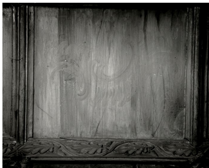
13 Toruń, kościół pw. Wniebowzięcia NMP, nowożytne podniebie baldachimu stall w rzędzie południowym prezbiterium, segment wschodni, fotografia w bliskiej IR - na zdjęciu uczytelniła się dekoracja rocaillowa

[26] Do nowych elementów, wprowadzonych do wnętrza chóru w okresie Reformacji, należały: horologium, chrzcielnica, oraz pulpit dla śpiewaków 76 . W 1603 roku skompletowano także pełen zestaw tarcz herbowych patrycjatu miejskiego (niestety niezachowany, opracowany niedawno na podstawie źródeł przez Krzysztofa