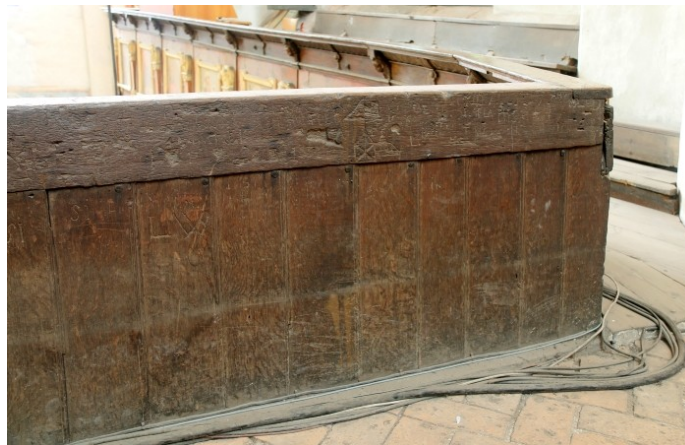
8 Toruń, kościół pw. Wniebowzięcia NMP, późnośredniowieczny parapet balustrady empory, ostatnie przęsło korpusu nawowego (fot. Juliusz Raczkowski).