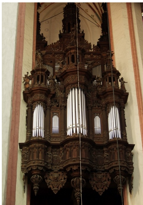
6 Toruń, kościół pw. Wniebowzięcia NMP, późnomanierystycki prospekt organowy, 1601-1609.

[18] Warto odnotować, że budowa nowego prospektu organowego naruszyła częściowo integralność średniowiecznej balustrady empory z przełomu XV i XVI wieku 55 , w której przetrwały częściowo starsze belki pochodzące z okresu 1353 +/-6 (najstarsza) - 1400 +/-6 (najmłodsza) 56 . Drewniane segmenty o konstrukcji pseudo wieńcowej z wąskim dębowym parapetem wcutym pomiędzy filary, przetrwały we wszystkich sześciu przęsłach nawy bocznej; od strony nawy zdoła je układać kasetonów wypełnionych maswerkowymi rozetami 57 . Wyjątkiem jest segment w prześle czwartym, w którym umieszczono prospekt - od strony lica balustrada pozbawiona jest dekoracji. Zwieńczono ją szerokim i dość wysokim dębowym parapetem, od strony nawy wyładowanym i drobno profilowanym. Podobne masywne parapety przydano - chyba w tym samym czasie - starszym balustradom w przęsłach drugim i trzecim licząc od wschodu. Modernizacja ta mogła się wiązać z udostępnieniem przestrzeni wiernym. Nowożytnie graffiti zachowane na powierzchni gotyckiej stolarki balustrad od strony