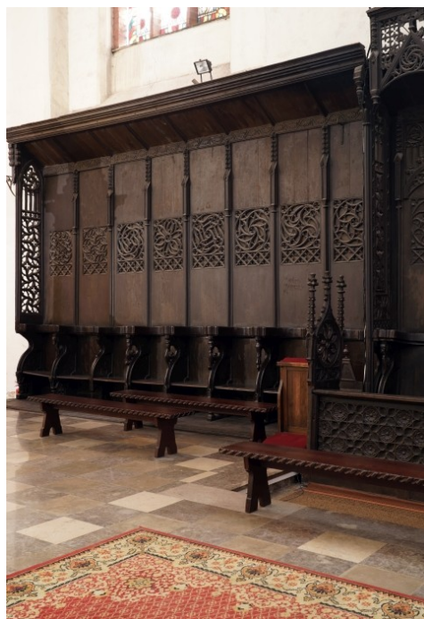
9 Toruń, kościół pw. Wniebowzięcia NMP, ośmiosiedziskowe stalle w południowym rzędzie w prezbiterium, segment wschodni

[23] Wnikliwa analiza struktury pozwala widzieć w tym segmencie dowód konieczności rozbudowania w bliżej nieokreślonym czasie ciągu stall o sześć dodatkowych miejsc. Jak się wydaje, wykorzystano w tym celu starszą strukturę: kompozycyjnie spójna z całym kompleksem stall prezbiterium oraz identyczna w snycerskich szczegółach jest para siedzisk od strony wschodniej. Sześć pozostałych powstało jednak w innym warsztacie. Zostały one wtórnie zintegrowane ze starszym elementem: ich zespolenie jest widoczne w partii fryzu wieńczącego i w partii podłokietników, zespolonych flekiem. Dodana struktura charakteryzuje się rozbieżnościami wymiarów 70 (siedziska są tu nieco węższe 71 ), a przede wszystkim różni się techniką wykonania dekoracji i snycerskimi detalami. Zaplecki pozostawiono gładkie 72 , wprowadzając jedynie ciąg snycerskich płomienistych rozet, które nie zostały wyrzeźbione w grubości drewna, lecz wykonane ażurowo i nałożone na deski. Opracowanie ich jest znacznie mniej finezyjnie, niż snycerstwa pozostałej części stall w prezbiterium. Dość płaski ornament z liści dębu we fryzie wieńczącym nosi cechy nowożytny, a dekoracja pinakli rzeźbiona jest bardziej surowo, niż pączki i kwiatony w części gotyckiej. Podstawy siedzisk pozbawione są ażurowej maswerkowej arkatury i główek. Różnice wykazuje także opracowanie profili ścianek między siedziskami (mimo zbliżonej krzywoliniowej