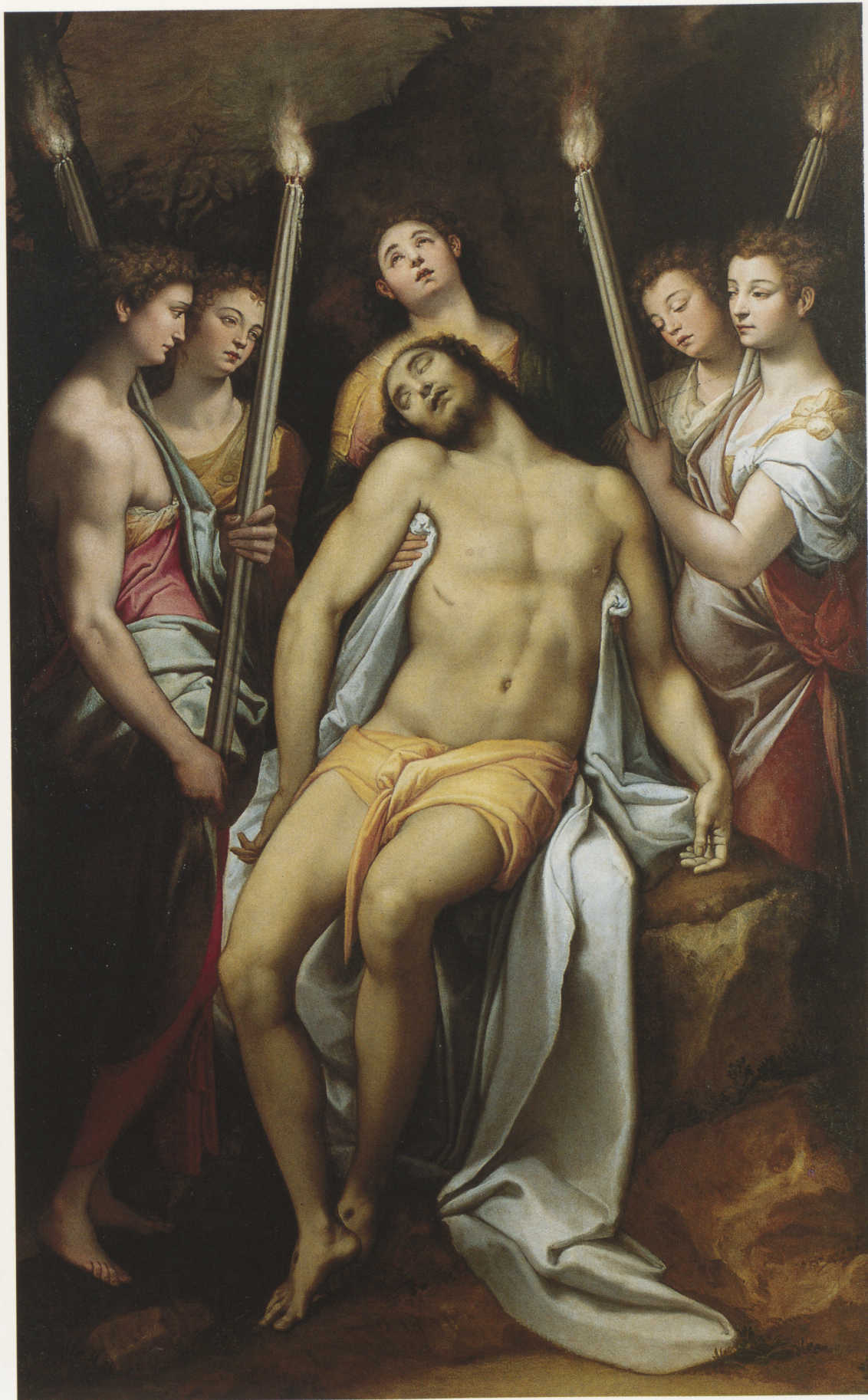
Farbtafel II. Federico Zuccari, Pietà degli Angeli. Roma, Galleria Borghese