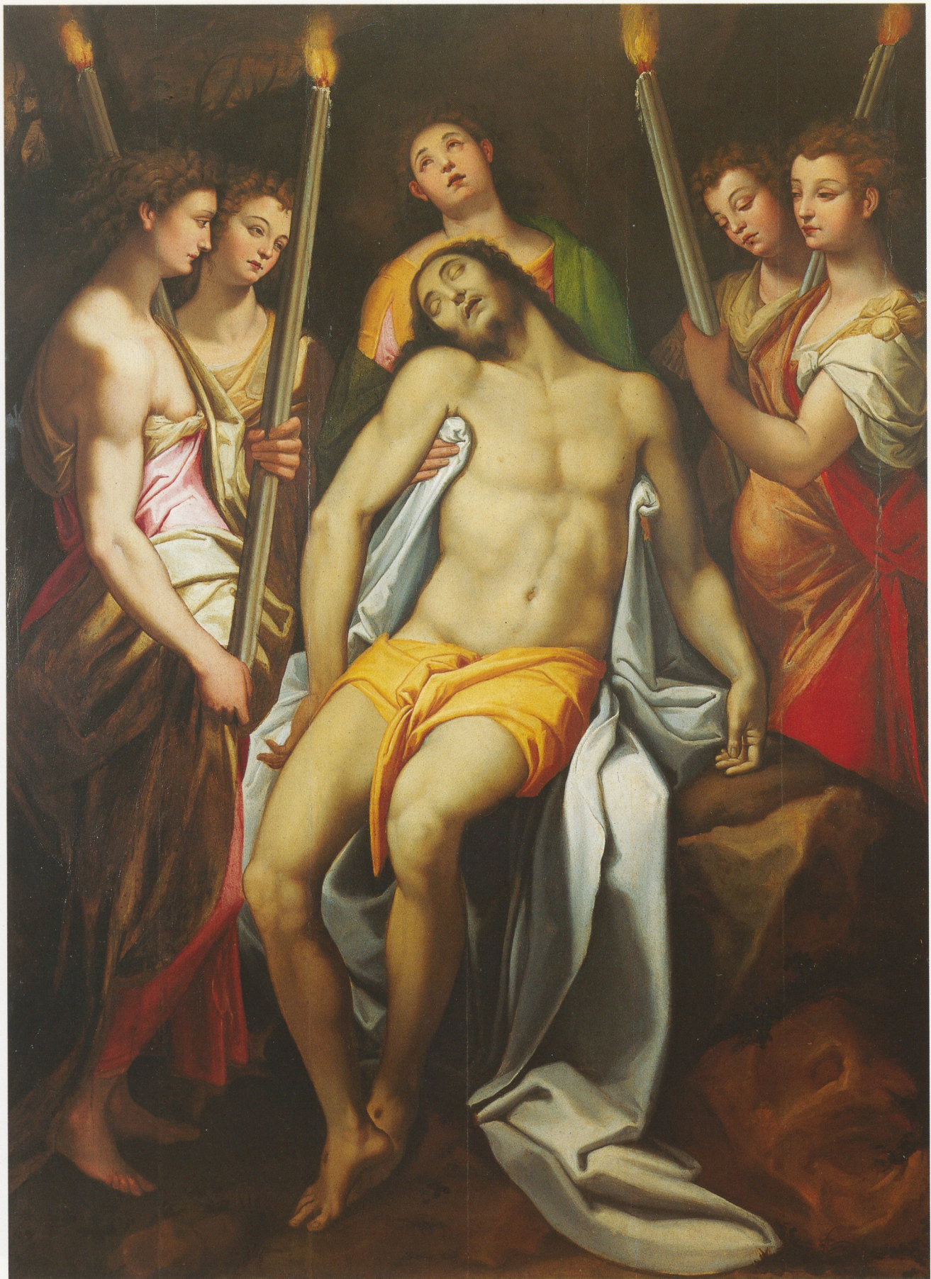
Farbtafel III. Taddeo Zuccari, Pietà degli Angeli (già collezione Vitelleschi). Torre Canavese, collezione Dadrino