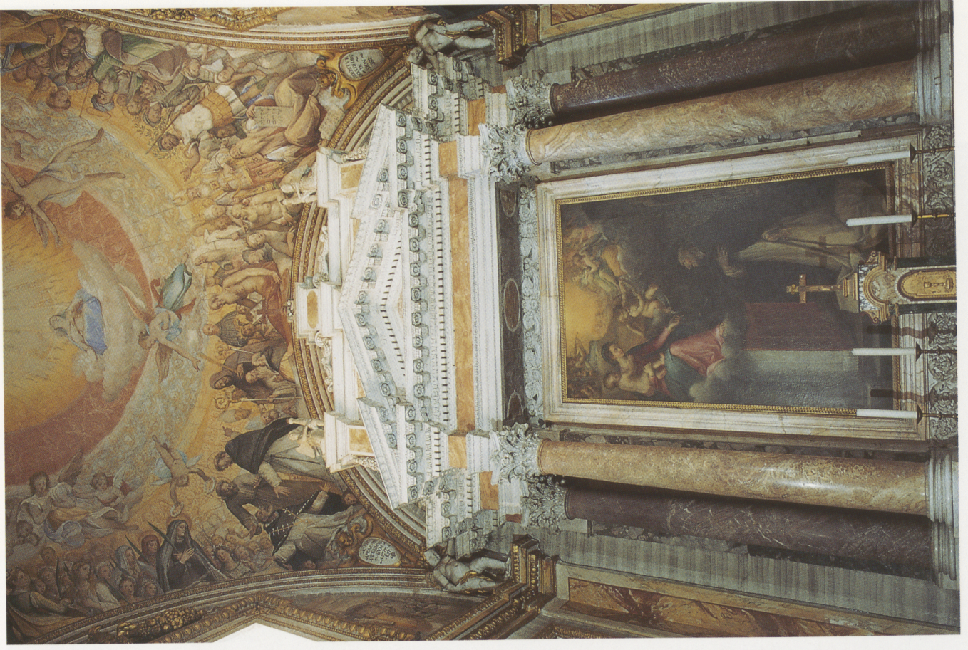
Farbtafel V. Federico Zuccari, Cappella di S. Giacinto, Altarbild und Kuppelfresko