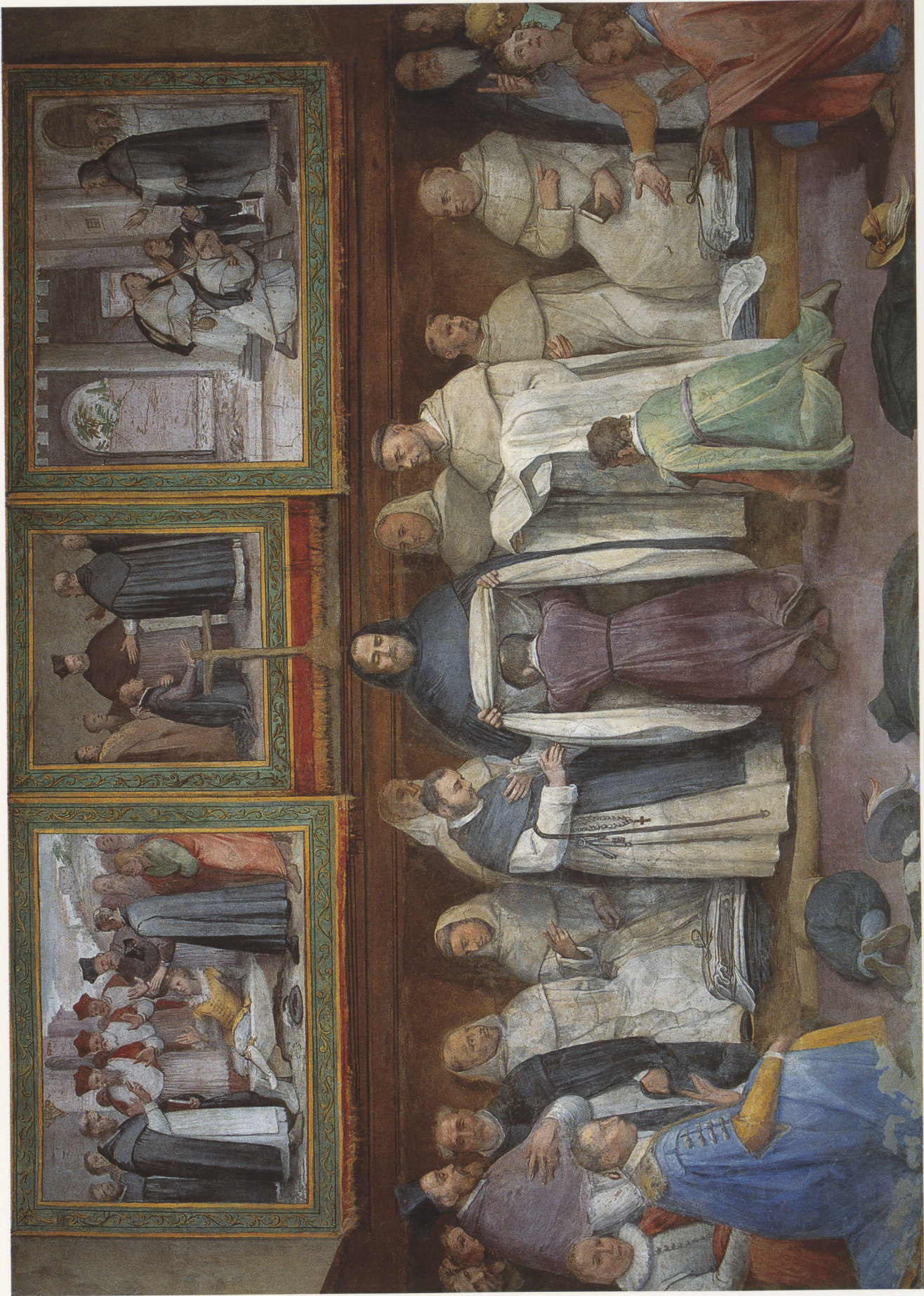
Farbtafel VII. Federico Zuccari, Einkleidung des Hl. Hyazinth. Cappella di S. Giacinto