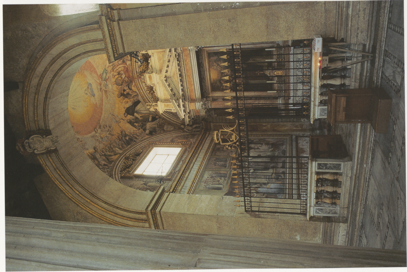
Farbtafel IV. Rom, S. Sabina, Cappella di S. Giacinto