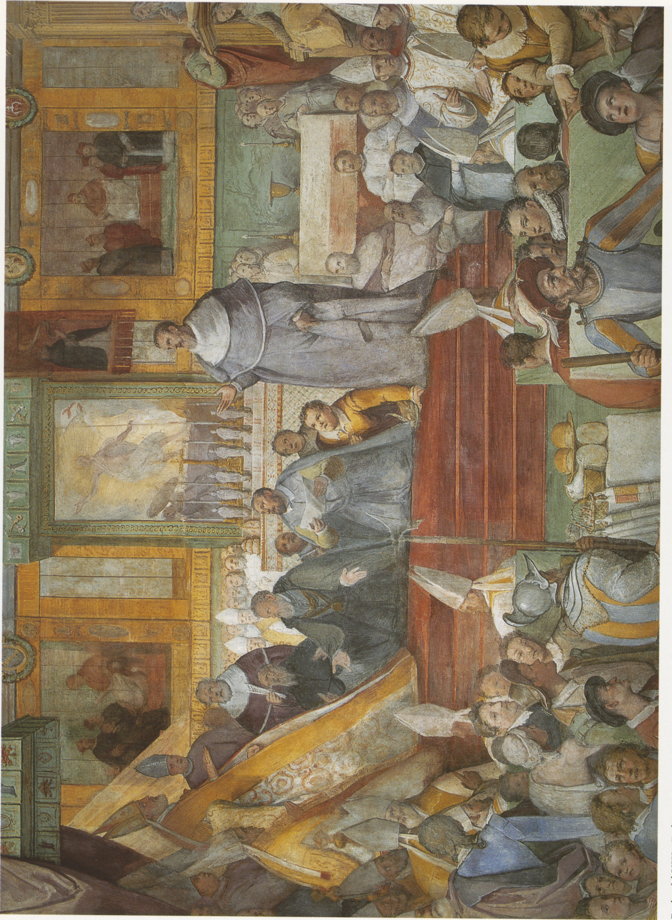
Farbtafel VIII. Federico Zuccari, Kanonisation des Hl. Hyazinth. Cappella di S. Giacinto