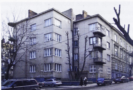
Il. 2. Lwów, budynek przy ul. Sykstuskiej 41c, ob. ul. P. Doroszenki 61, widok ogólny (fot. J. Lewicki, 2015 r.)