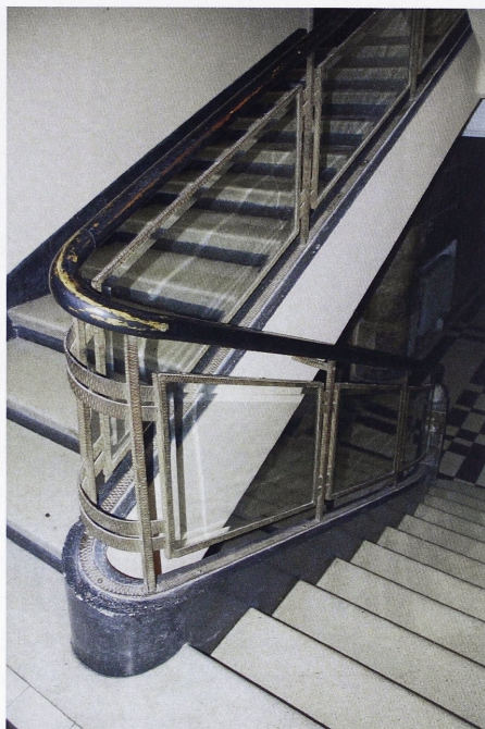
Il. 9. Szklana balustrada schodów i fragment spocznika w budynku przy ul. Sykstuskiej, ob. ul. P. Doroszenki 57

kowa jednego z mieszkańców zasłużonego w budowaniu ustroju radzieckiej Ukrainy.