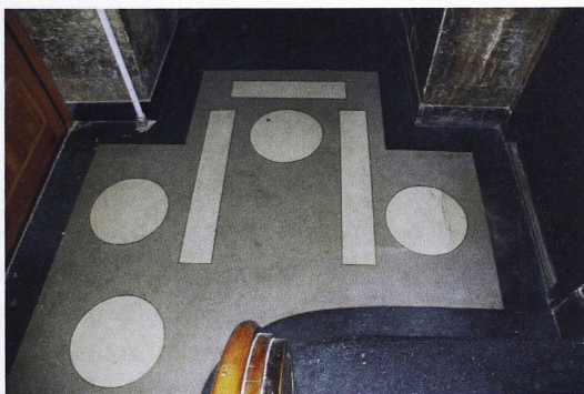
Il. 8. A-B Rozwiązanie strefy wejścia i geometryczne lastryko w budynku przy ul. Sykstuskiej, ob. P. Doroszenki 55 (fot. J. Lewicki, 2014 r.)