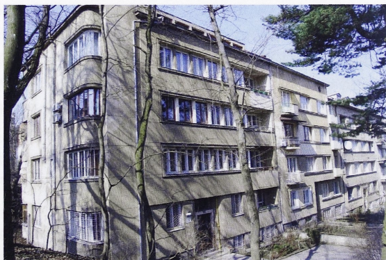
Il. 3. Lwów, zabudowa przy ul. Sykstuskiej, ob. ul. P. Doroszenki 51-59, widok ogólny. Fasady poszczególnych budynków nr 59, 57, 55. Projekt z 1937r., realizacja do połowy 1939 roku