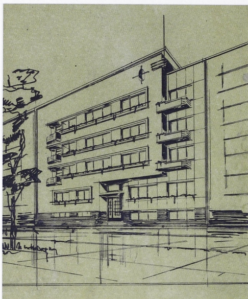
Il. 5. Lwów, budynek przy ul. Sykstuskiej, ob. ul. P. Doroszenki 53, aksonometria, przerys rysunku Salomona Keila. (opr. M. Korpala, 2017r.)