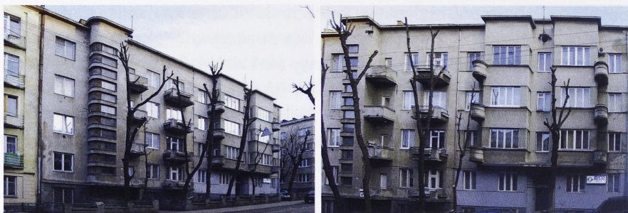
Il. 1. A-B Lwów, zabudowa ul. Sykstuskiej 49 b-c, ob. ul. P. Doroszenki 47-49, fasady poszczególnych budynków, widok ogólny (fot. J. Lewicki, 2015 r.)